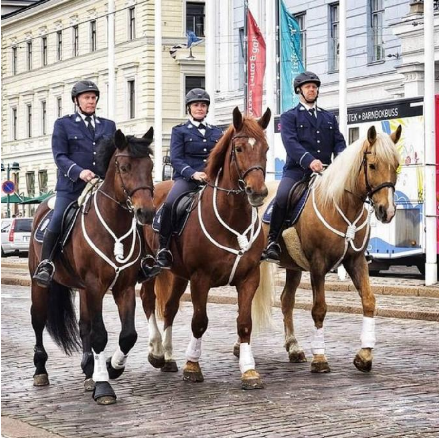
Kuva 1. Ratsupoliisi ja paraativarusteet (Helsingin Ratsupoliisin Instagram-tili)

Joukkojenhallintakeikoilla ratsastajalla on päällään musta haalari, paukkuturvaliivi sekä musta kypärä, johon on kiinnitetty aktiivikuulosuojaimet. Paraativaatteissa ratsastajalla on päällään valkoinen paita ja vierailutakki, sekä päässä kypärä tai koppelakki. Hevosille paraatiin laitetaan valkoinen rintaremmi sekä jalkoihin valkoiset suojat. Kuvassa 1 ratsupoliisi on työtehtävällä Helsingin keskustassa vartiovaihtoparaatikulkueessa paraativarustuksessa. (Haastattelu 11.1.2022.)