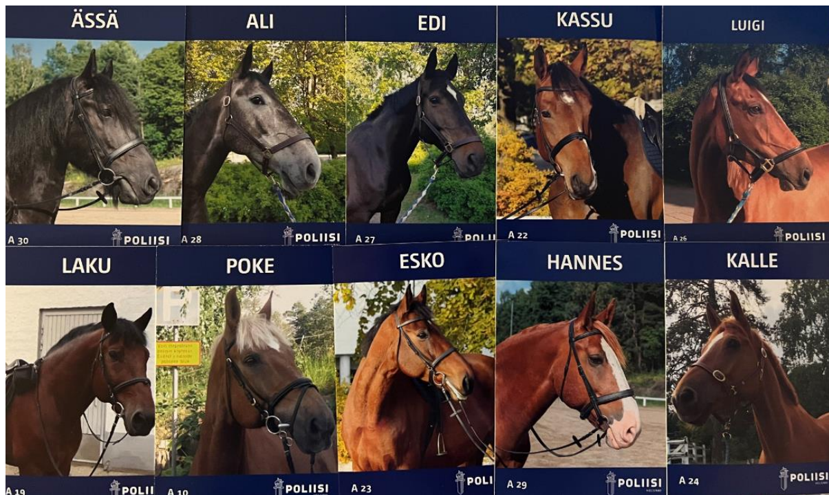
Kuva 2. Helsingin poliisilaitoksen poliisihevoskeräilykortit