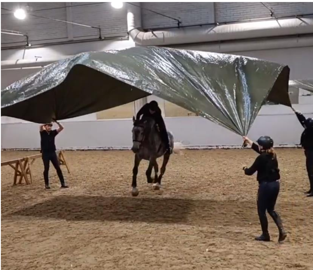
Kuva 5. Poliisihevosen siedätysharjoitus pressulla

Pressuharjoitukset ovat turvallisia ja helppoja toteuttaa. Kun pressu on tullut tutuksi hevosille, voidaan sitä hyödyntämällä tehdä monenlaisia harjoituksia. Pressu voidaan esimerkiksi nostaa seinäksi, jonka läpi hevoson on mentävä näkemättä, mitä se takana on. Pressua voidaan nostaa myös ilmaan ja ratsastaa sen alle. Tämän jälkeen pressun voidaan antaa laskeutua hevoson ja ratsastajan päälle. Kuvassa 5 on kyseinen harjoitus käynnissä. (Moottori 2017.)