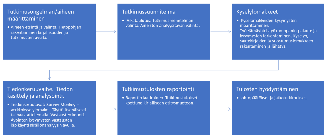
Kuvio 1. Tutkimusprosessin eteneminen

Tutkimustulokset koottiin raporttiin. Raportissa on esitetty tutkimukseen liittyvät johtopäätökset, pohdinta ja idea jatkotutkimuksesta.