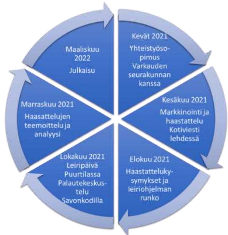
Kuvio 2. Opinnäytetyön prosessin kuvaus

Alkuperäisessä suunnitelmassamme oli, että syyskuussa pidämme saunaillan, johon toivomme mahdollisimman monen leiripäivään osallistuvan myös tulevan. Saunaillan tavoitteena olisi ollut tutustua toisiimme ja madaltaa kynnystä osallistua varsinaiseen leiripäivään. Saunailta kuitenkin peruuntui, koska ilmoittautuneita oli vain yksi. Varsinainen leiripäivä toteutettiin lokakuussa. Järjestimme vielä leiripäivän jälkeen tapaamisen Savonkodilla, jossa oli mahdollisuus sekä muisteluun että palautteen antoon. Heti leiripäivän jälkeen aloitimme vastauksien litteroinnin ja analysoinnin. Haastattelujen analysoinnin jälkeen alkoi varsinainen opinnäytetyön kirjoittamisprosessi. Varsinainen opinnäytetyö esiteltiin julkaisuseminaarissa maaliskuussa 2022.