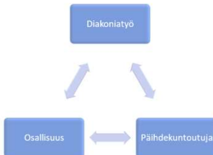
Kuvio 1. Opinnäytetyön keskeiset käsitteet

Tämän huomioiden pyrimme järjestämään olosuhteet leirillä niin, että leiriläisten oma ääni ja mielipiteet nousisivat esille. Tuomme esille sen, että olemme leirillä myös opiskelijan ja oppijan roolissa. Haluamme kuulla, mitä päihdekuntoutajat itse kokevat kaipaavansa diakoniatyöltä ilman, että tarjoamme kovin tiukkoja etukäteismalleja tai odotuksia.