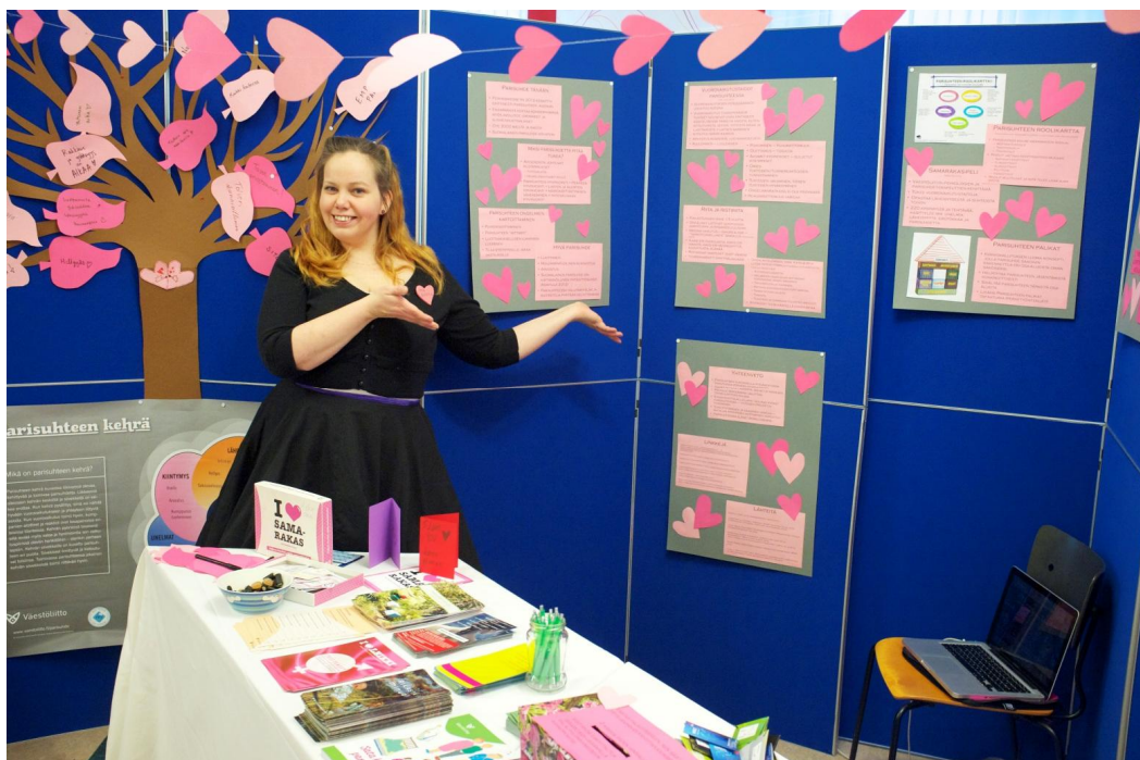
Kuva 2: Standi.