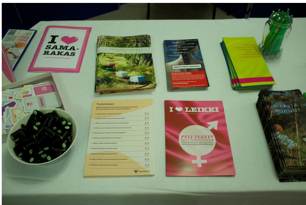
Kuva1: Esitteitä ja parisuhdepelejä.