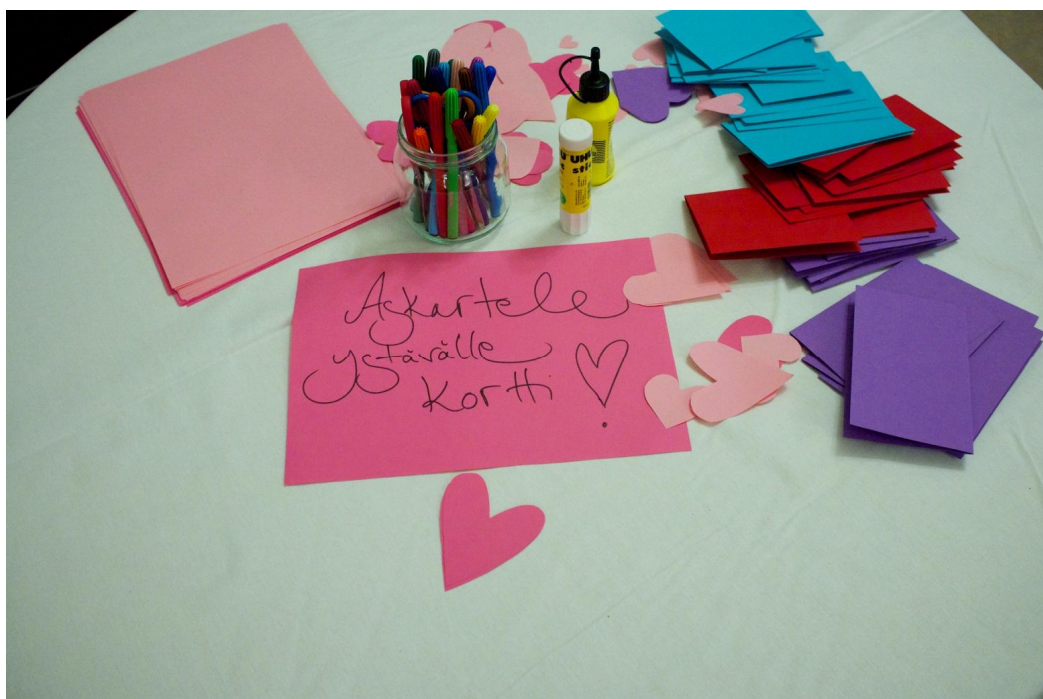
Kuva 4: Ystävänpäiväkorttien askartelupiste.