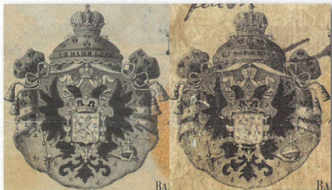
Kuva 7. Vertailua etupuolen vaakunasta. Väärennös oikealla. Väärennös on varsin huolellista työtä.