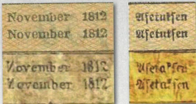
Kuva 11. Vertailua taustapuolen tekstieroista. Ylempänä aidon setelin tekstiä, alempana väärennöksen. Huomatkaa aidon setelin November-sanan alun kirjaimen N korvautuminen väärennöksessä kyrillisellä kirjaimella И (viittaisikohan tämä yksityiskohta tekijän venäläisyyteen?). Sana Asetuksen on väärenteessä korvautunut sanalla Asetaksen.

Kuten seuraavista etupuolen kuvista käy ilmi, olivat väärennökset jo perin hyviä. Verrokkina kuvat aidosta setelistä.