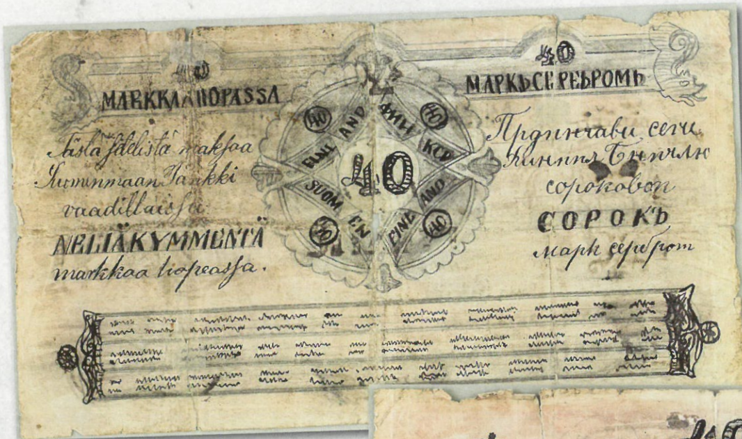
Kuva 1 (yläpuolella). Käsien piirretty väärennös 40 markan setelistä mallia 1862, etupuoli. Huomioikaa sarjanumero, joka on sikäläkin epäonnistunut, että suurin koskaan aidossa esiintynyt sarjanumero oli №132000. Allekirjoituksiksi on väärentäjä mukailnut August Törnqvistin ja F.W. Wendellin nimet, joista jälkimmäistä ei tietävästi edes esiinny tämän setelin allekirjoituksena.

40 markan seteli on eräs Suomen vaikeimmista ja kalleimmista setelityypeistä hankkia kokoelmaan. Sitä laskettiin liikkeelle vain 132 000 kappaletta. Saman sarjan 12 markan seteleitä laskettiin liikkeelle omituisesta nimellisarvosta huolimatta yhteensä 1 652 000 kpl. Valmistus ehdittiin jo lopettaa loppuvuotena 1877, mutta mallin 1878 10 markan setelin syyskuussa 1881 ilmi tullut väärennösongelma aiheutti tarpeen jatkaa liikkeellelaskua vuonna 1882 arviolta 27 000 kappaleella. 20 markan seteleitä laskettiin liikkeeseen yhteensä 1 032 000 kpl ja 100 markan seteleitä puolestaan yhteensä 696 000 kpl.