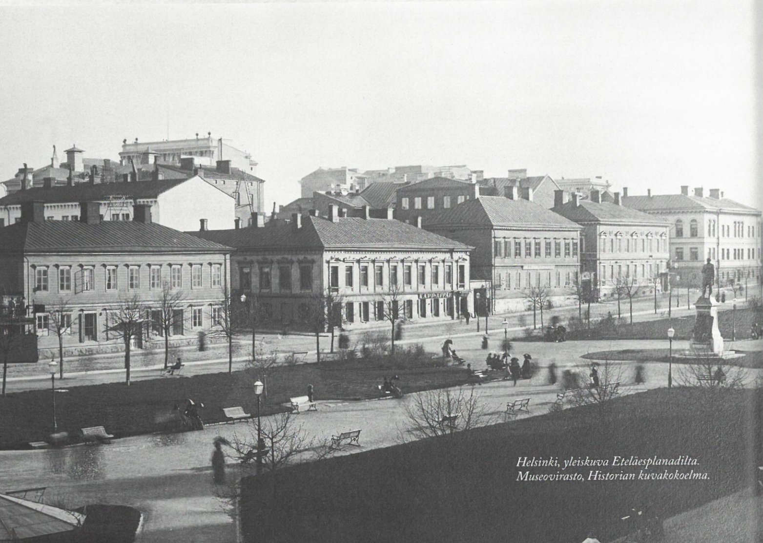
Helsinki, yleiskuva Eteläesplanadilta.

Aidon ja väärennetyn setelin taustapuolen yksityiskohtia vertailtaessa käyvät painotyön laadun puutteet selkeästi ilmi.