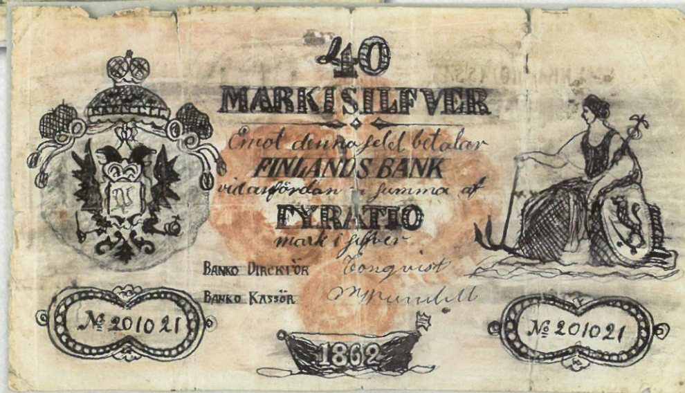
Kuva 2. Käsien piirretty väärennös 40 markan setelistä mallia 1862, taustapuoli.