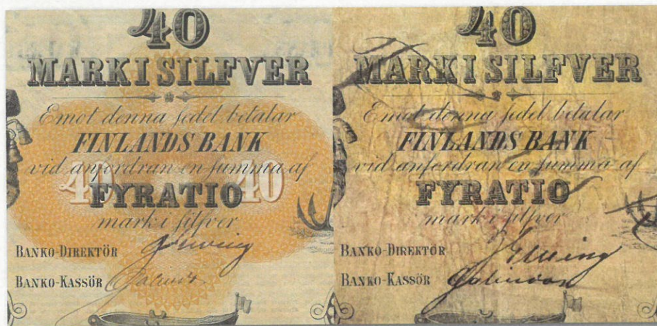
Kuva 5. Vertailua etupuolen arvomerkinnoistä, pohjapainatuksesta ja allekirjoituksesta. Väärennös oikealla. Jopa allekirjoitukset ovat varsin aidon kaltaisia.

rahan tarkka tunnistaminen vaatii niin hyvää näkökykyä kuin kirkasta valaistusta.