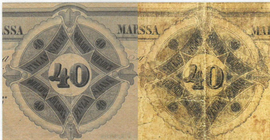
Kuva 13. Vertailua taustapuolen arvomerkitämedaljongista, väärennös oikealla.