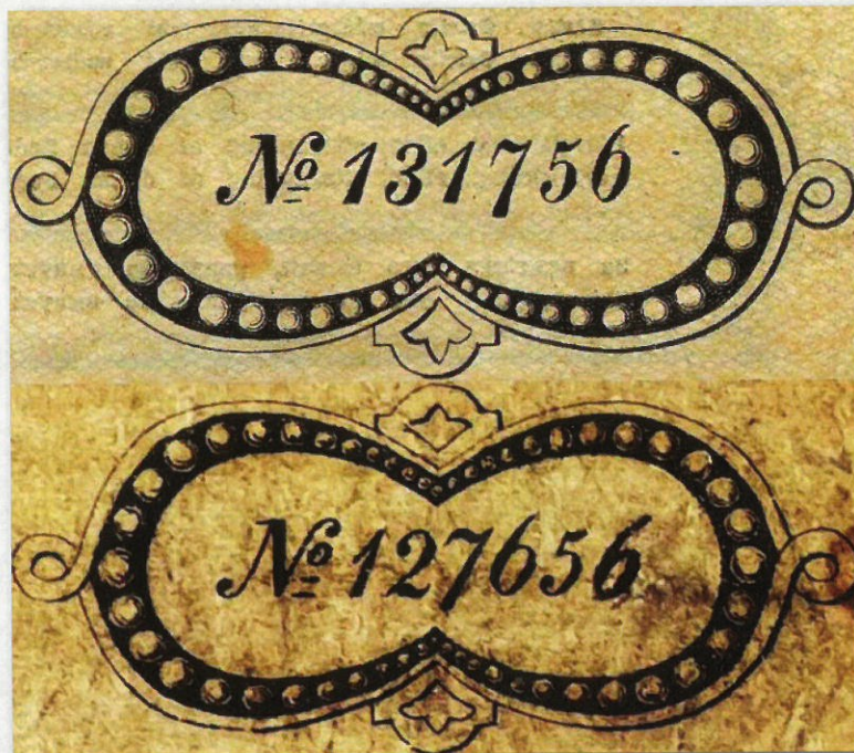
Kuva 6. Vertailua etupuolen oikeanpuoleisista sarjanumeroista. Väärennös alhaalla. Huomaa aidon keltaisenruskea pohjapainatus, mikä väärennöksestä puuttuu kokonaan ja joka ”korvattu” suttuisuudella.

Sittenkun kaksi wäärennyttä Suomen Pankin seteliä 40 markan arwosta äsken tuotiin Pankkiin ja waroa saattaa, että useampia setelejä samaa tekoa on pantu kulkemaan, waroitetaan yleisöä tämän kautta ottamasta wastaan seteliä mainitusta arwosta ilman tarkkaa tutkintoa. Wäärennytyt setelit, jotka