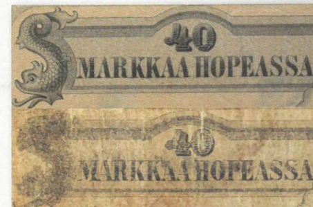
Kuva 14. Vertailua taustapuolen vasemmanpuoleisista arvomerkinnoista. Väärennös alhaalla. Huomaa aidon ruskea pohjapainatus, mikä väärennöksestä puuttuu kokonaan ja joka ilmeisesti ”korvattu” suttuisuudella. Samaten väärennöksen vasemman reunan kalakuvio on aitoon verrattuna onneton tubru.