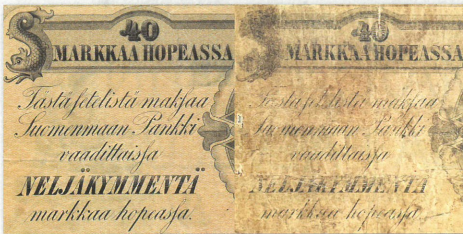
Kuva 12. Vertailua taustapuolen suomenkielisestä arvomerkitätekstistä, väärennös oikealla.

Vaikkakin esimerkiksi arvomerkitätekstien osalta on väärennöstyö periaatteessa ihan kelvollisesti toteutettu, leimaa koko taustapuolen painojälkeä nuhjuisuus ja sen aiheuttama epäselvyys.