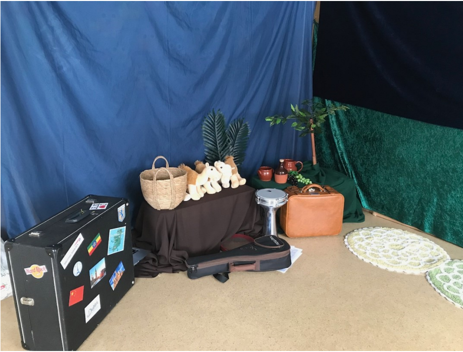
Kuva 3 Israel-tuokion sisustus

Autiomaalaulun jälkeen siirryimme sivussa olevien maalauspaperien ääreen. Israel-muskariin taideintegraatioksi oli valittu musiikkimaalaaminen. Olimme asettelleet työtoverini kanssa lattialle rullasta pitkät maalauspaperit piiriksi ja piirin keskelle olimme tehneet leikkihiekasta, pienistä kameleista ja palmuista pienen autiomaan keitaan virittelemään tunnelmaan. Jokainen lapsi sai paikan paperin äärestä ja jaoimme siveltimet ja purkkeihin valmiiksi annostellut värit. Ohjeistin kuuntelemaan musiikkia ja maalaamaan, mitä siitä tulee mieleen ja liikuttamaan pensseliä musiikin mukaan. Kuunneltava musiikki oli klezmermusiikkia ja hasidijuutalaisten horah- ja tsadik-tansseja. Tavoitteenani oli tarjoilla lapsille autenttista juutalaisesta musiikkiperinteestä tulevaa musiikkia. Lapset maalasivat keskittyneesti kaikessa rauhassa. Lopuksi käsien pesun jälkeen siirryttiin vielä loppupiiriin, jossa laulettiin taas Kuule Isä taivaan ja juteltiin siitä, mitä jäi mieleen ja miltä tuntui. Välipalaksi olin leiponut juutalaiseen Purim -juhlan perinteisiin kuuluvia, keksimäisiä taatelihilloa sisältäviä 'Hamanin korvat' -leivoksia ja lisäksi tarjolla oli appelsiinihiipaleita. Lopuksi oli hetki vapaata leikkiä ennen kuin vanhemmat tulivat hakemaan.