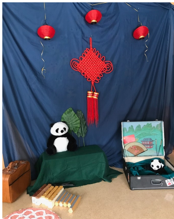
Kuva 4 Kiina-tuokion sisustus

Viimeinen toimintatuokio käsitteli Kiinaa. Jo tutuksi käyneissä alkulauluissa jokainen lapsi huomiointiin ja alkulämmittelyloru Heilutellaan käsiä johdatteli yhteiseen tekemiseen. Kiinassa tutustuttiin tietysti pandakarhuun, ja Ilolaukku -laulussa opeteltiin tällä kerralla tervehtimään kiinaksi 'Nihao!'. Bandakarhun bambumaja on säveltämäni helppo, pentatonisessa asteikossa kulkeva laulu. Lauluun tutustuttiin laulaen ja leikkien, sitten sävelpaloilla säestäen. Olin kerännyt kaikki c- ja g -sävelpalat ja näin saatiin säestykseen sopiva kvintti-intervalli borduna-säveliksi. Syömäpuikoista piirrettiin lattialle piirrä ja arvaa -kuvia. Viimeinen kuvista oli joki, jonka jälkeen syömäpuikoilla perussykettä soittaen opeteltiin laulu Huang Ho -joella . Laulun