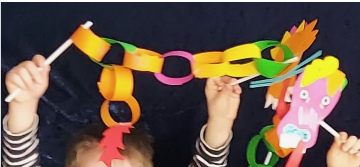
Kuva 5 Tanssivat lohikäärmeet

jälkeen soitettiin syömäpuikoilla helppoja kaikurytmejä ja harjoiteltiin oikeaa tapaa pitää syömäpuikkoja kädessä. Jotkut lapsista kertoivat syöneensä puikoilla Viitasaaren kiinalaisessa ravintolassa. Lopuksi tutustuttiin kiinalaiseen uuden vuoden juhlaperinteeseen askartelemalla eri värisistä paperisuikaleista värikkäät lohikäärmeet, jotka kiinnitettiin kahden puikon päihin niin, että lohikäärmettä pystyi liikuttamaan varovasti. Askartelun aikana kuunneltiin kiinalaista perinnemusiikkia ja askartelu näytti olevan erittäin mieluisaa puuhaa. Lopuksi tanssittiin kiinalaisen musiikin tahtiin lohikäärmeitä tanssittaen. Loppupiirissä laulettiin taas Kuule Isä Taivaan ja juteltiin yhteisestä matkasta. Jälleen kerran lasten palaute oli innostunutta ja tuokio oli ollut heille mieluinen. Lopuksi välipalalla maisteltiin kiinalaista luomuteetä ja metsästettiin popcornia syömäpuikoilla. Kiina-tuokio oli kaikista kolmesta tuokiosta omasta mielestäni sekä työkaverini palautteesta päätellen tasapainoisin ja toimivin kokonaisuus. En tiedä johtuiko se ryhmädynamiikan kehittymisestä vai oman ohjaukseni selkeydestä, mutta tunti oli itselleni jostain syystä helpoin pitää ja koin sen sujuvimpana. Se sisälsi riittävän yksinkertaisia, mutta monipuolisia toimintatapoja.