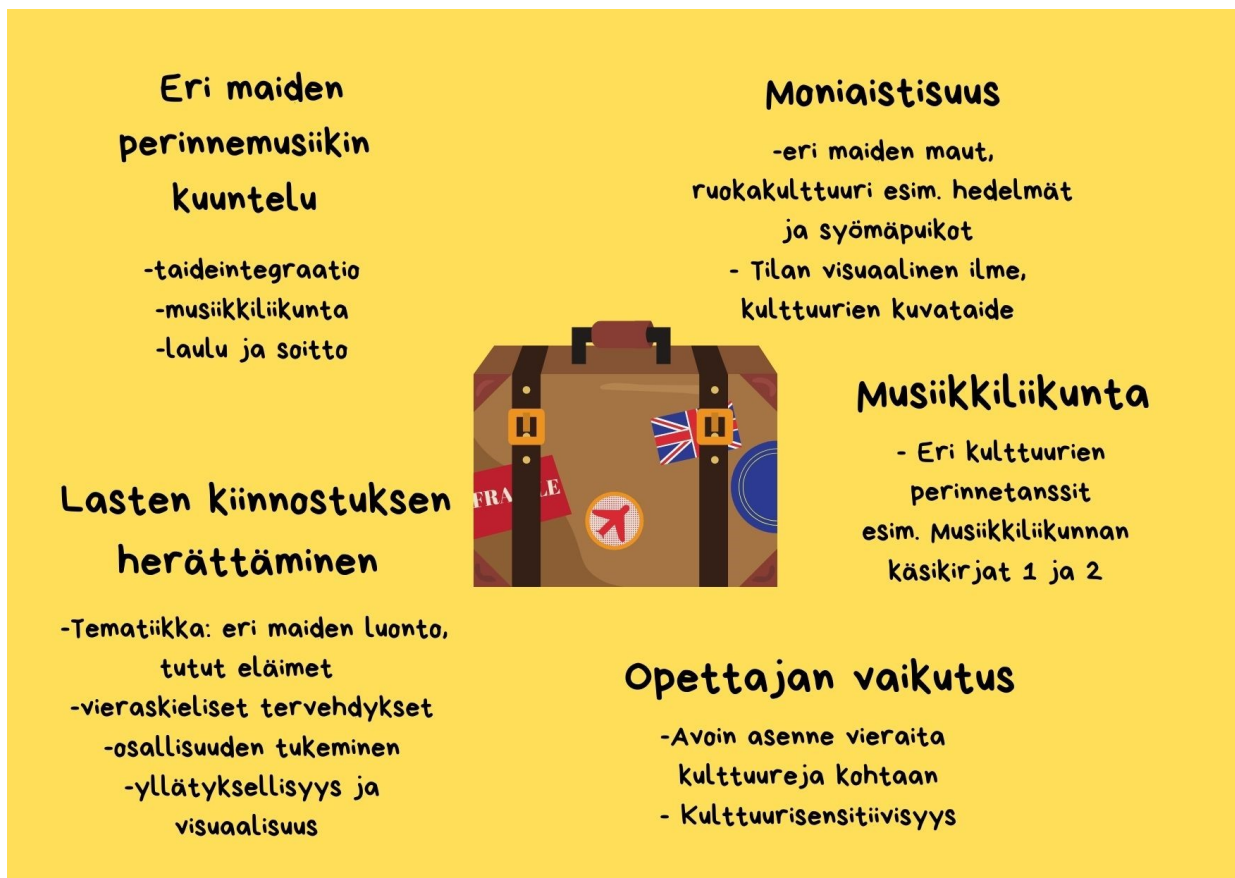
Kuvio 3 Kehittämisideat Viskarit matkalla maailmalla -projektin perusteella.

Opinnäytetyön perusteella näyttäisi siltä, että monikulttuurinen säiikkikasvatus voi tukea lasten kansainvälisyysosaamista, kun se toteutetaan kulttuurisensitiivisesti ja kokonaisvaltaisesti. Kehittämisideana esitetään laajasti eri maiden säiikkiperinteiden hyödyntämistä, leikinomaista eri maiden luonnon ja kulttuurien moniaistista tutkimista sekä säiikkiliikunnan ja tanssin moniaisten mahdollisuuksien hyödyntämistä lasten kansainvälisyyskasvatuksessa. Vieraskieliset tervehdykset, eri maiden luontoon tutustuminen, eri kulttuurien säiikkiin tutustuminen liikkuen, kuunnellen laulaen ja soittaen sekä taideintegraation keinoin ovat mielenkiintoinen tutustumiskohde lapselle. Havaintojen ja ryhmähaastattelujen perusteella näyttäisi siltä, että viisivuotiaat lapset ovat lähtökohtaisesti hyvin avoimia monenlaisen säiikin suhteen eikä varhaisiän säiikkikasvatuksessa tämän tutkimuskokeilun perusteella tarvitse jännittää aitoa vieraasta kulttuurista tulevan säiikin kuuntelua, jos tilanne on muuten turvallinen ja leikinomainen. Lasten kanssa voi myös harjoitella eri kulttuurien tansseja ja monikulttuurista säiikkiliikuntamateriaalia on tarjolla varsin runsaasti.