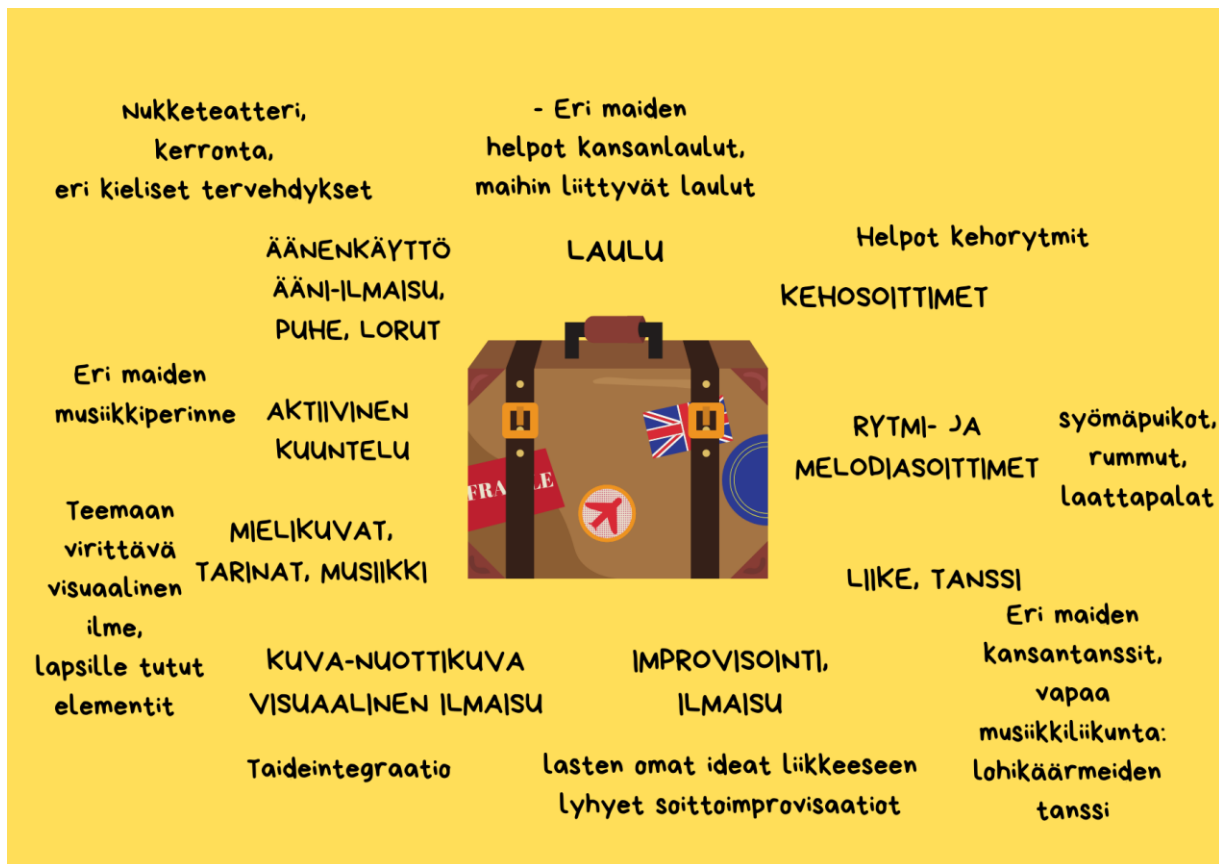
Kuvio 2 Orff-prosessikaavion soveltaminen Viskarit matkalla maailmalla -projektissa.