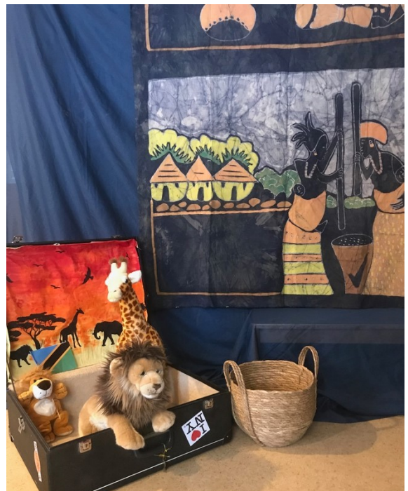
Kuva 1 Tansania-tuokion sisustusta.

Simama kaa -laulun jälkeen avattiin iso matkalaukku. Sieltä löytyi savanni. Tutkittiin taustakan- kaasta löytyviä savannin eri eläimiä. Sen jälkeen lähdettiin retkelle savannille omatekemäni laulun, Savannilla matkustan, myötä (Liite 2). Jaoin lapsille rummut ja marakassit ja kerroin, että niitä tarvitaan aina kertosaikeessa. Pyysin lapsia tulemaan mukaan laulun liikkeisiin. Laulun jokaisessa säkeistössä tulee vastaan jokin savannin eläin, jota ilmennetään liikkein ja elein. Jokaisessa säkeistössä kysytään, että 'arvaatko, mikä eläin se on.' Lapset osallistuivat innoissaan liikkeisiin ja huusivat kuorossa, mikä eläin kulloinkin oli kyseessä. Kertosaikeessa säestettiin laulua soittamalla rummuilla ja marakasseilla perussykettä. Laulu laulettiin kahteen kertaan niin, että jokainen lapsi pääsi kokeilemaan sekä rumpua että marakassia.