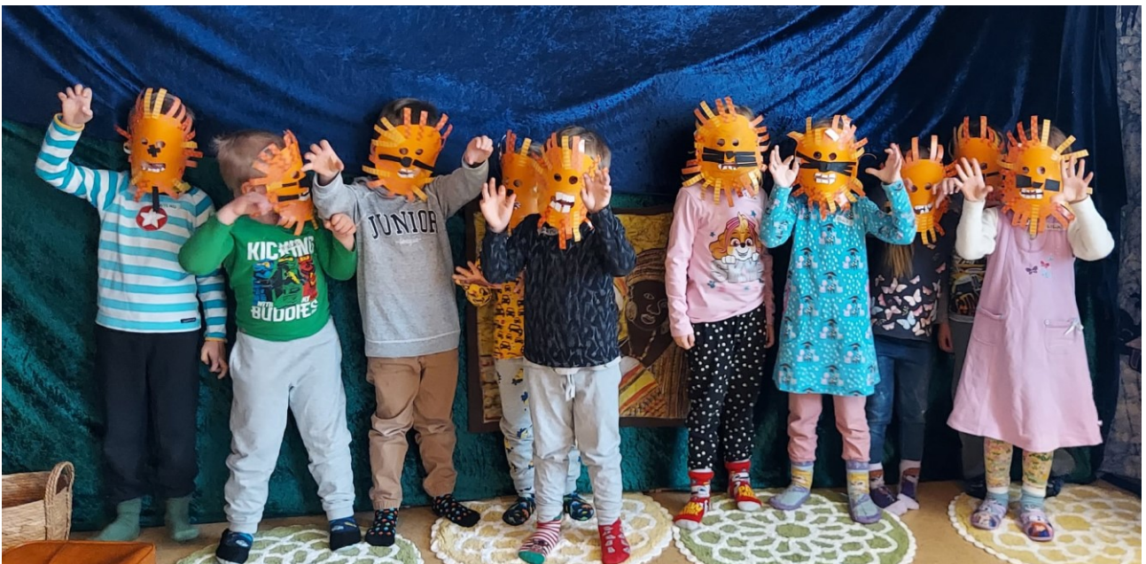
Kuva 2: Leijonien hurja irstyys

Laulun jälkeen siirryttiin askartelupöytien ääreen ja laitoin taustalle soimaan musiikkia eteläisestä Afrikasta. Askartelimme työkaverini johdolla leijonanaamiot pahvilautasista ja värillisistä paperisui-kaleista. Lapset askartelivat innokkaasti. Leijonanaamioiden askartelu vei hieman enemmän aikaa, kuin olimme suunnitelleet. Kaikki lapset saivat ne kuitenkin hienosti valmiiksi ja kiinnitimme työto- verini kanssa jokaisen naamioon kuminauhan, niin että naamion sai puettua kasvoille. Seuraavaksi palattiin takaisin piiriin ja leikittiin vielä leijonanaamioiden kanssa Soiva soppa -materiaalin laulu, Siispä heilutamme häntää . Jokainen otti parin ja parin kanssa liikuttiin eri tavoin. Lopuksi istuttiin loppupiiriin. Haastattelin lapsia ryhmänä kyselemällä mikä oli mieluisinta. Lasten mielestä kaikki oli kivaa, mutta mieluisinta oli leijonanaamioiden askarteleminen. Kysyin myös, mitä Tansaniasta jäi mieleen. Suurimmalle osalle jäi mieleen savanni ja eläimet ja osa muisti vielä tunnin jälkeen ja seu- raavallakin kerralla tervehdysten 'Jambo!'. Lopuksi johdattelin lauluun Kuule Isä Taivaan kerto- malla, että Taivaan Isälle kaikki ovat tosi rakkaita, niin täällä Suomessa kuin siellä kaukana Afri- kassa. Laulu laulettiin ja leikittiin viittomalla. Tämän jälkeen siirryttiin välipalalle. Välipalana oli uunibanaania ja jäätelöä. Lopuksi lapset saivat leikkiä vapaasti siihen asti, kunnes vanhempi tuli hakemaan.