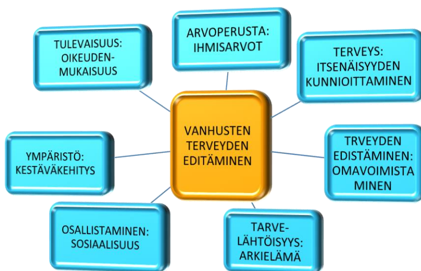
Kuvio 3. Vanhusten terveyden edistämisen ulottuvuudet (Pitkänen 2014)

Tässä opinnäytetyössä (kuvio 3) on koottu vanhusten terveyden edistämisen linjauksen ulottuvuuksia, joiden avulla kuvataan kammaritoiminnan terveyttä edistävää diakonian vanhustyön kehittämistä ja muotoutumista Rovaniemellä. Ulottuvuudet nousevat Ottawan asiakirjan (1986) terveyttä edistävästä toiminnasta ja ulottuvuuksissa, joissa painottuvat Savolan ja Koskinen-Ollonqvistin (2010, 39) kuvaamat terveyttä edistävät arvot. Näitä tukevat edellä mainitut näkökohdat ikääntyvien hyvinvoinnista ja terveyden edistämisestä sekä vanhustyön teesit. (Kattainen 2010, 198-200; Kirkon vanhustyön strategia, 2005.) Terveyden edistäminen etenee tavoitteellisen toiminnan kautta tuloksiin ja vaikutuksiin, joiden taustalla vaikuttavat esitetyt arvot.