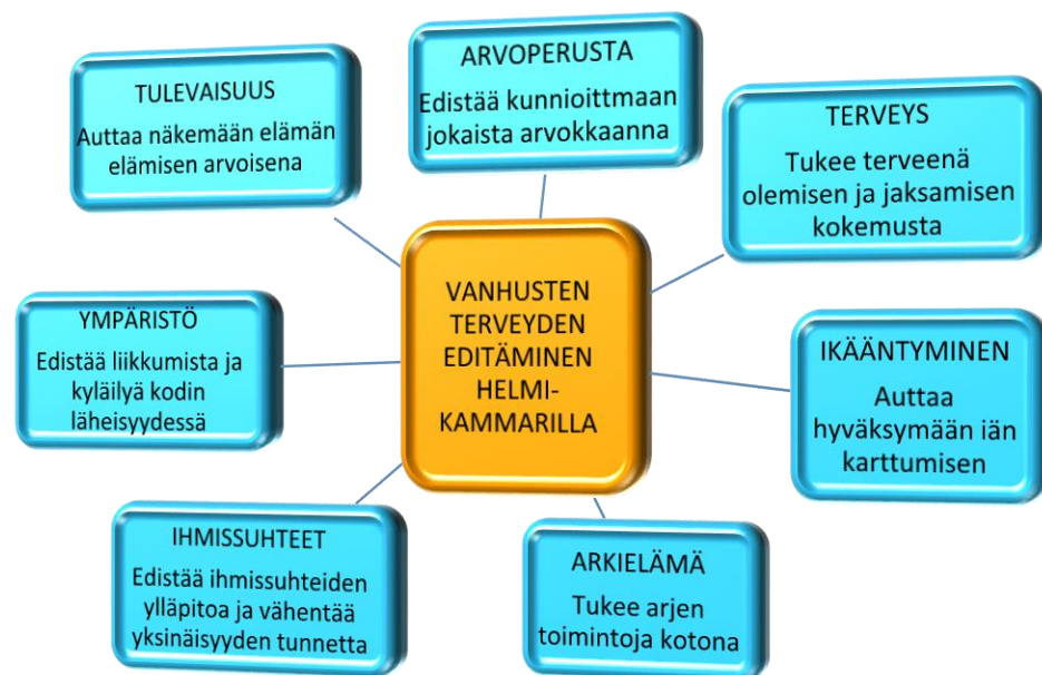
Kuvio 6. Helmikammaritoiminta vanhuksen terveyttä edistävänä diakoniatyönä (Pitkänen 2014)

Helmikammari ja sen toimintapalvelut toimivat terveyden edistämisen mahdollistajina, informaation tuojina, jolloin annettu tieto toi vaihtoehtoja kävijöille kantamaan vastuuta omista terveysvalinnoista oma-apuna (omat päätökset), ihmisten keskinäisenä apuna (jakaminen) tai terveellisenä ympäristönä, joka tukee ja edistää ihmisen terveyttä.