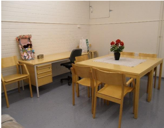
Kuva 7. Käsityökamari (Pitkänen 2009)

Helmikammarin toimitilan takaosassa sijaitseviin kahteen kamariin suunniteltiin aloitettavaksi erilaisia pieniryhmien toimintoja. Toinen kamareista vakiintui käsityö- ja askarteluhuoneeksi (kuva 7), jota varustettiin käyttötarvikkeiden mukaan. Toisesta kamarista oli suunniteltu myös askarehuonetta, mutta käyttäjien tarpeen mukaisesti siitä muotoutuikin ryhmähuone (kuva 8). Tähän kamariin perustettiin myös pieni kirjasto oppilastyönä, josta sai lainata kirjoja kirjaamalla lainaustiedot ylös vihkoon.