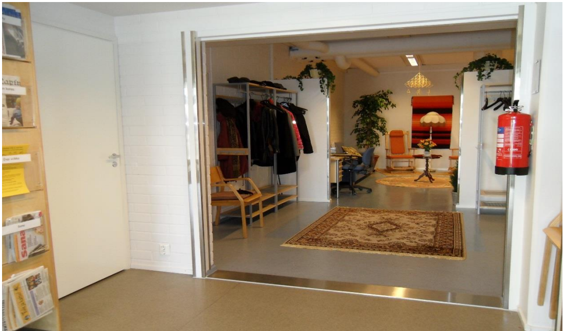
Kuva 4. Helmikammarin naulakkotilaa, lehtihylly ja tietokonepöytä (Pitkänen 2011)

Helmikammaritoiminnan edetessä tilojen sisustaminen ja varustaminen jatkuivat. Kyläpaikkasaliin laitettiin lehtihylly kyläilijöitä varten sekä rakennettiin seinätilaa taulunäyttelyille. Lisääntyvä tietokoneen käyttö innoitti sijoittamaan olohuoneeseen tietokonepöydän kammarilla toimijoiden ja kävijöiden käyttöön (kuva 4).