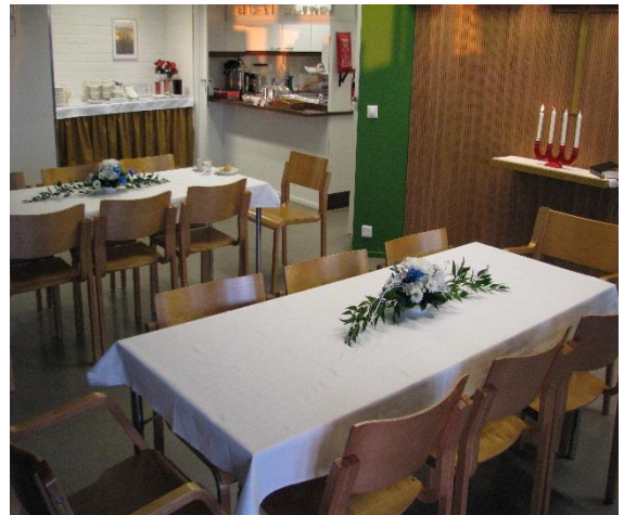
Kuva 12. Itsenäisyyspäivän juhla (Pitkänen 2011)

Helmikammarin ryhmätuokioiden kestivät noin tunnin puoleen toista tuntia kerrallaan ja niitä saattoi toteuttaa noin kolmea eri ohjelmaa päivää kohti. Tavoite oli saada ohjelma- ja toimintatuokioita myös keskiviikoille. Tuokioiden pidettiin avoimena ryhmätoimintoina, joita vetivät kammarin vapaaehtoiset. Helmikammaritoiminnan kehittäminen jatkui käyttäjien tarvelähtöisyyden pohjalta, joka näkyi muun muassa uusien ohjelmien käynnistymisinä. Yhteistyönä alkoivat muun muassa vuosittaiset Välittämisen päivät rovaniemeläisen Neuvokkaan vapaaehtoistoimijoiden kanssa. Vuodenkiertoon suunniteltavien ohjelmien ajoituksessa huomioitiin kesäaikojen lomat ja jouluaikojen tauot.