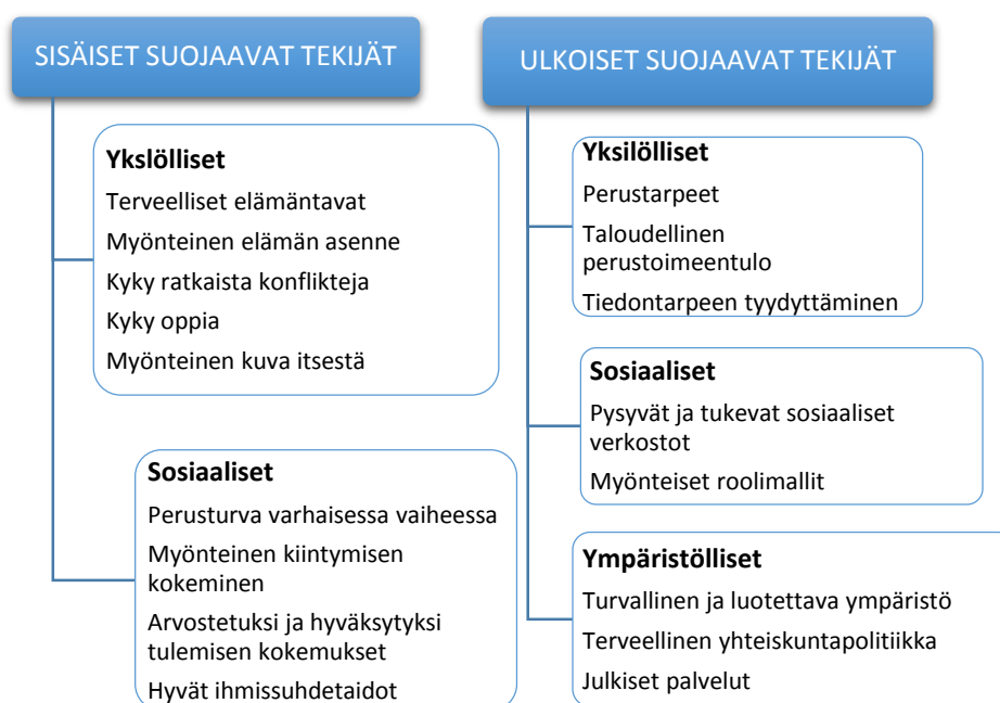
Kuvio 4. Terveyttä suojaavat ja vahvistavat sisäiset ja ulkoiset tekijät (Savola ja Koskinen-Ollonqvist 2010)

terveelliset elämäntavat. Ulkoisina tekijöinä esitetään yksilöllisten ja sosiaalisten tekijöiden lisäksi ympäristölliset tekijät. Ulkoisia tekijöitä ovat muun muassa perustarpeiden tyydyttäminen, pysyvät ja tukea antavat sosiaaliset verkostot sekä turvallinen ympäristö ja terveellinen yhteiskuntapolitiikka. Yksilöllisissä ja sosiaalisissa suojaavissa tekijöissä on kysymys yksilön ja yhteisön voimavarojen vahvistamisesta (kuvio 4).