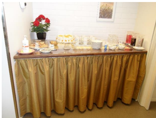
Kuva 9. Salin kahviotarjoilupöytä (Pitkänen 2010)

Helmikammarin tarvelähtöinen toiminta aloitettiin kysymällä kyläväeltä: mitä te haluaisitte tehdä täällä kammarilla, minkälainen toiminta teitä kiinnostaa ja kuinka usein haluaisitte sen tapahtuvaksi. Kysyttiin myös: tiedättekö vapaaehtoisia vetämään toivottuja ohjelmia, esimerkiksi yhteislauluihin säestäjiä ja esilaulajia.