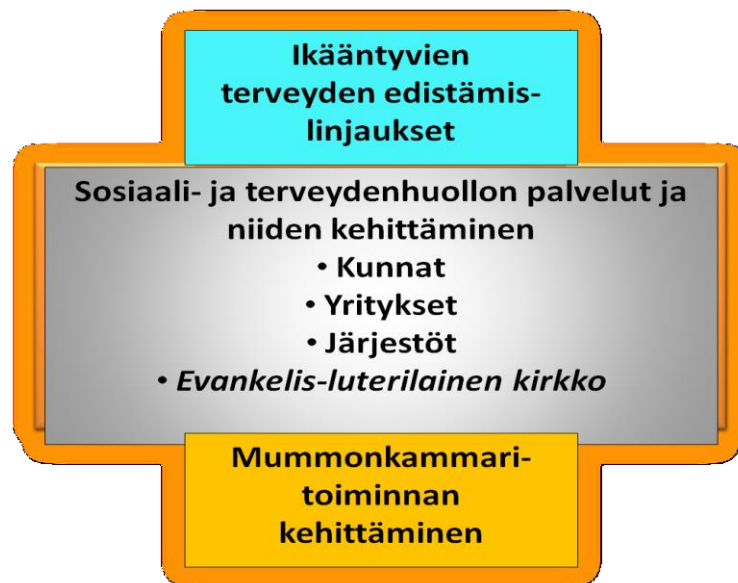
Kuvio 2. Yhteenveto sosiaali- ja terveydenhuollon terveyden edistämisen palveluista ja kehittämisestä (Pitkänen 2014)

Kirkollisen palvelun tulee olla asiakaslähtöistä ja laadukasta ja palvelujen tulee täyttää siihen kohdistuvat odotukset ja sille asetetut vaatimukset. Kirkon laatusuositukseen lukeutuvat toiminnan tilan määrittely, tavoitteiden tarkistaminen, parantamisalueiden ja vahvuuksien tunnistaminen sekä tilanteen arvioinnissa yhteisymmärryksen saavuttaminen ja lopuksi korjaavan toiminnan käynnistäminen ja oppiminen. Hyvä organisaation ja työyhteisön laadun hallinta etenee määrätietoisesti kohti suunnitelmallisia ja sovittuja palvelutoiminnan tavoitteita. Hyvässä laadun hallinnassa työyhteisö huomio oman toimintakulttuurinsa ja kytkee laatutyöskentelynsä siihen. Laadukkaan toiminnan tarjoaminen edellyttää paneutumista laatua ylläpitäviin toimenpiteisiin ja niiden kehittämiseen, joista mainittakoon seurakunnissa laaditut vanhustyön strategiat, asiakaspalautteiden hankkimisen kehittäminen sekä vanhustyöhön kehitettävät työkäytännöt. (Kirkon vanhustyön strategia 2005, 20.)