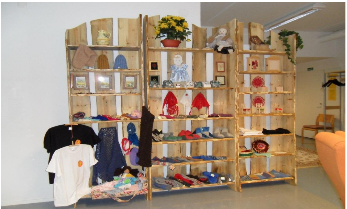
Kuva 6. Helmikamarin Helmikauppa olohuoneessa (Pitkänen 2011)

Helmikammarilla virisi käsitöiden tekemisen into, jonka myötä kammarille rakennettiin kauppa (kuva 6). Helmikauppaan sai lahjoittaa omia käsitöitä tai tehdä seurakunnan hankkimista tarvikkeista käsityö- ja askartelutuotteita. Helmikaupasta saatu tuotto kohdennettiin oman seurakunnan diakoniatyön hyväntekeväisyyteen.