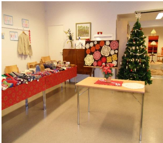
Kuva 11. Joulumyyjäiset (Pitkänen 2010)

Helmikammarin ryhmätoiminnan ohjelma- ja toimintatuokioiden toiminnanohjaaja organisoivat viikko- ja kuukausirytmien, josta synti viikko-ohjelma. Tuokioiden organisointi riippui ohjelman luonteesta sekä käytettävissä olevien vetäjien määrästä ja heidän resursseistaan. Tavoite oli saada jokaiselle ohjelmalle vähintään kaksi vetäjää, yhdessä tehden työ jakaantuisi. Ennen ohjelman kiinnittämistä kammaritoiminnan ohjelmaksi, vetäjän kanssa sovittiin ohjelmaan liittyvästä asioista: teemasta, materiaaleista ja aikatauluista ja niin edelleen. Näin päiväkirja alkoi täyttyä ohjelmista, jotka rytmittyivät kammarin ohjelmistoksi. Ohjelmistoon jätettiin myös tilaa vapaaseen seurusteluun ja kohtaamisen kyläville, vierailijoille ja ryhmille.