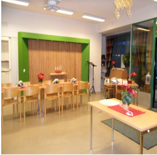
Kuva 2. Helmikammarin sali (Pitkänen 2009)