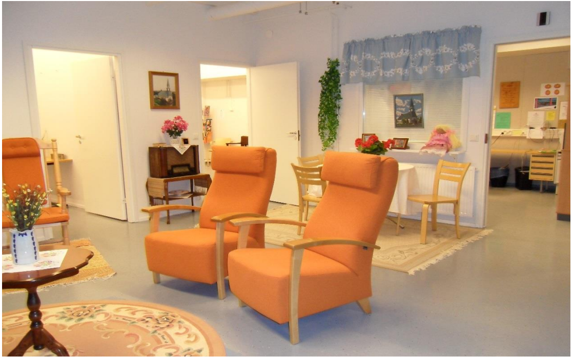
Kuva 5. Helmikamarin olohuone (Pitkänen 2010)

Helmikammarilla virisi käsitöiden tekemisen into, jonka myötä kammarille rakennettiin kauppa (kuva 6). Helmikauppaan sai lahjoittaa omia käsitöitä tai tehdä seurakunnan hankkimista tarvikkeista käsityö- ja askartelutuotteita. Helmikaupasta saatu tuotto kohdennettiin oman seurakunnan diakoniatyön hyväntekeväisyyteen.