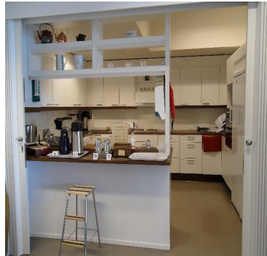
Kuva 3. Helmikammarin keittiö (Pitkänen 2011)

Helmikammaritoiminnan edetessä tilojen sisustaminen ja varustaminen jatkuivat. Kyläpaikkasaliin laitettiin lehtihylly kyläilijöitä varten sekä rakennettiin seinätilaa taulunäyttelyille. Lisääntyvä tietokoneen käyttö innoitti sijoittamaan olohuoneeseen tietokonepöydän kammarilla toimijoiden ja kävijöiden käyttöön (kuva 4).