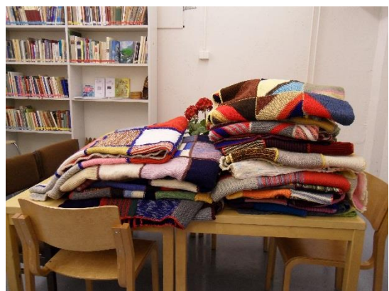
Kuva 10. Äiti Teresan peittoja (Pitkänen 2009)

Valmiina ohjelmatuokiona tarjottiin käsitöistä kiinnostuneille Äiti Teresan peitotalkoita (kuva 10), joka toimi tekijän lahjoittamisen periaatteella. Kammarille kutsuttiin kävijöiden toiveesta eri alojen asiantuntijoita tuomaan tietoa, yleensä