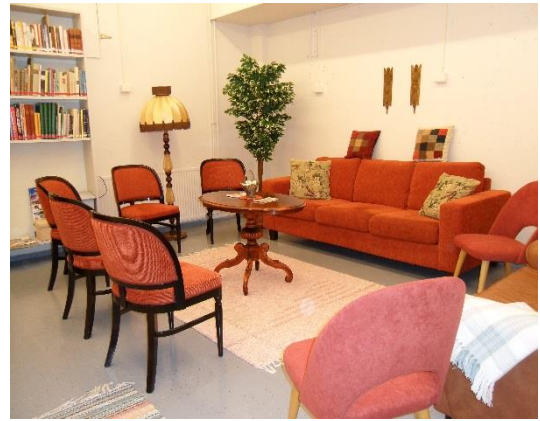
Kuva 8. Ryhmähuone (Pitkänen 2010)

Helmikammaritoimintaan sisältyvä vapaaehtoistoiminta oli käynnistynyt tavoitteiden mukaisesti. Kammarille rekrytoidut vapaaehtoiset osallistuvat toiminnan kehittämiseen ja yhteistyössä toimintaa suunniteltiin, kokeiltiin, arvioitiin ja luotiin erilaisia työ- ja toimintatapoja kammaritoiminnaksi. Puhdistusoppaiden tarve oli vapaaehtoistyön eri rooleihin: keittiötoimintaan, kyläpaikkasaliin ja vetäjille, samoin kuin toiminnanohjaajan työhön. Helmikammaritoiminnasta koottiin myös infokansio kävijöiden käyttöön. Näin alkoi muotoutua Helmikammarin oma toimintakulttuuri.