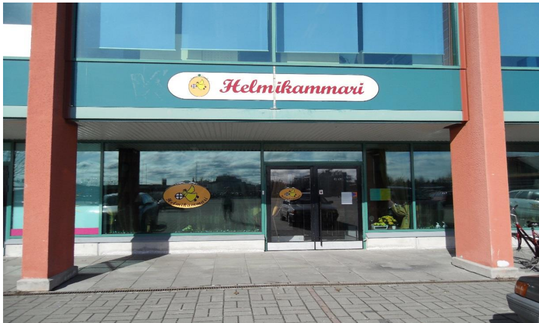
Kuva 1. Helmikammarin sisäänkäynti (Pitkänen 2009)

Helmikammari sisustettiin esteettisesti kodinomaisesti viihtyisäksi sekä turvaliseksi käyttä. Kalustehankintoja tehtiin myös kirpputoreilta, jotta sisustukseen saatiin niin sanottua ajanpatinaa ja vanhanajan sävyisyyttä. Sisustukseen käytettiin lämpimiä värejä tuomaan kodinomaisuutta. Tilojen sisustamisessa huomioitiin myös allergikot materiaalien valinnoissa sekä liikuntaesteiset jättämällä kulkutiloihin väljyyttä. Tilaan asennettiin myös induktiosilmukka.