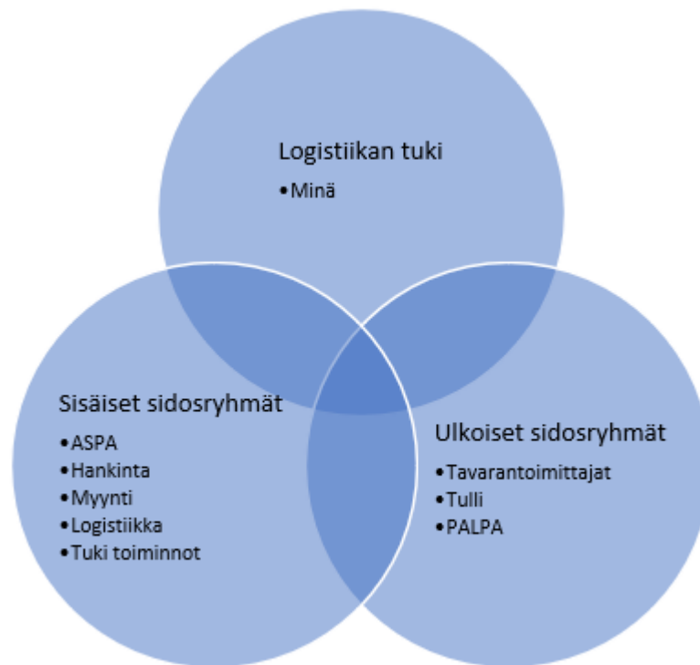
Kuvio 1: Sidosryhmät

Itse omassa työssäni pääpaino sidosryhmien kanssa työskentelyssä on sisäisissä sidosryhmissä. Käytännössä omaa ja osastoni työskentelyä ohjaa saldojen oikeellisuus ja toimitusvarmuus. Toimitusvarmuus on mittarina sellainen, jolla pystymme seuraamaan oman osastoni onnistumista ja yleisesti koko toimitustukun onnistumista.