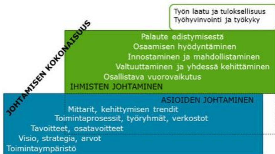
Kuvio 5: Johtamisen kokonaisuus (Työturvallisuuskeskus 2022).

Työturvallisuuskeskus on mielestäni hyvin kiteyttänyt yhteen kuvioon hyvin sen, että mitä kaikkea esimiestyö sisältää niin asioiden kuin ihmisten johtamisen suhteen.