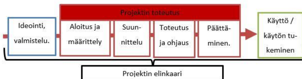
KUVA 1. Projektin elinkaari ja toteutus (mukaiillen Artto ym. 2006, 49)

Kuvassa 1 kuvataan projektin elinkaarta, punaisella pohjalla esitetään yleisimmät projektin toteutuksen vaiheet. Jokaisella osavaiheella on omat tavoitteensa ja vaiheiden tulokset tulee suunnitella selkeästi ennalta. Yksityiskohtaisempi projektikohtainen vaiheistus ja vaiheiden sisältöjen määrittäminen liittyvät työn ositukseen ja tehtävän määrittelyyn. (Artto ym. 2006, 49.)