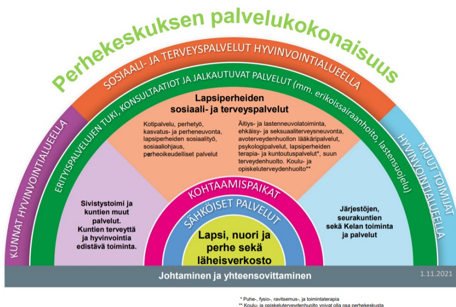
Kuvio 1. Perhekeskuksen palvelukokonaisuus (Terveyden- ja hyvinvoinnin laitos, 2021b-a.)

Perhekeskus sovittaa yhteen ja verkostoi lapsiperheiden eri palveluja. Näitä ovat lapsiperheiden sosiaali- ja terveyspalvelut, järjestöjen ja seurakuntien toiminta ja palvelut, kohtaamispaikat, varhaiskasvatuspalvelut, opiskeluhuolto ja nuorten palvelut, kuntien terveyttä ja hyvinvointia edistävä toiminta, erityis- ja vaativan tason palvelut sekä sähköiset palvelut. Kuviossa 1. on kuvattu perhekeskuksen palvelukokonaisuus.