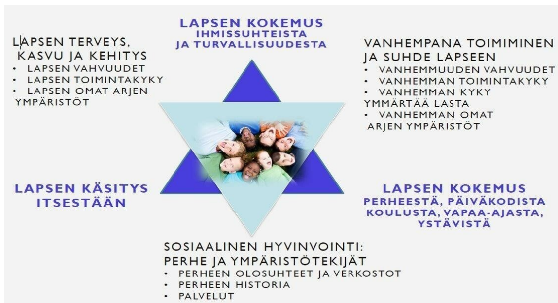
Kuvio 6. Hyvinvoinnin tähti (Peda.net. Yhteinen aika -toimintamalli Kuopiossa, i.a.)

Vanhemmuuden tukeminen ja vanhempien kanssa tehtävän yhteistyön merkitys korostuu, jos lapsella tai perheellä on tuen tarvetta. LAPE-muutosohjelma on tuonut varhaiskasvatukseen tehostetun tuen myös alle esikouluikäisille lapsille ja la- kimuutos siitä tulee voimaan elokuussa 2022. Lain muutoksen mukaan lapsella on oikeus varhaiskasvatuksessa ollessaan saada viipymättä yleistä tukea, joka tukee lapsen oppimista, hyvinvointia ja yksilöllistä kehitystä. Jos tämä tuki ei riitä annetaan tehostettua tai erityistä tukea, jonka toteutumista seurataan ja siitä tehdään aina hallinnollinen päätös. (Opetus- ja kulttuuriministeriö, 2021.) Varhaiskasvatuksen opettajan työtä tehdessä varhaisen tuen merkitys korostuu ja lapsen oikeus saada oikea-aikaista tukea vaatii varhaiskasvatuksen opettajalta tietoa lapsen kehityksestä sekä lapselle annettavista tukitoimista ja palveluista. Sosionomin koulutus vahvistaa perheiden kanssa tehtävää yhteistyötä ja tuo näkyvämmäksi sosiaali- ja terveyspalveluiden verkoston. Varhaiskasvatusryhmän kasvat- tajiin olisi siis hyvä kuulua erilaisella koulutustaustalla olevia ihmisiä.