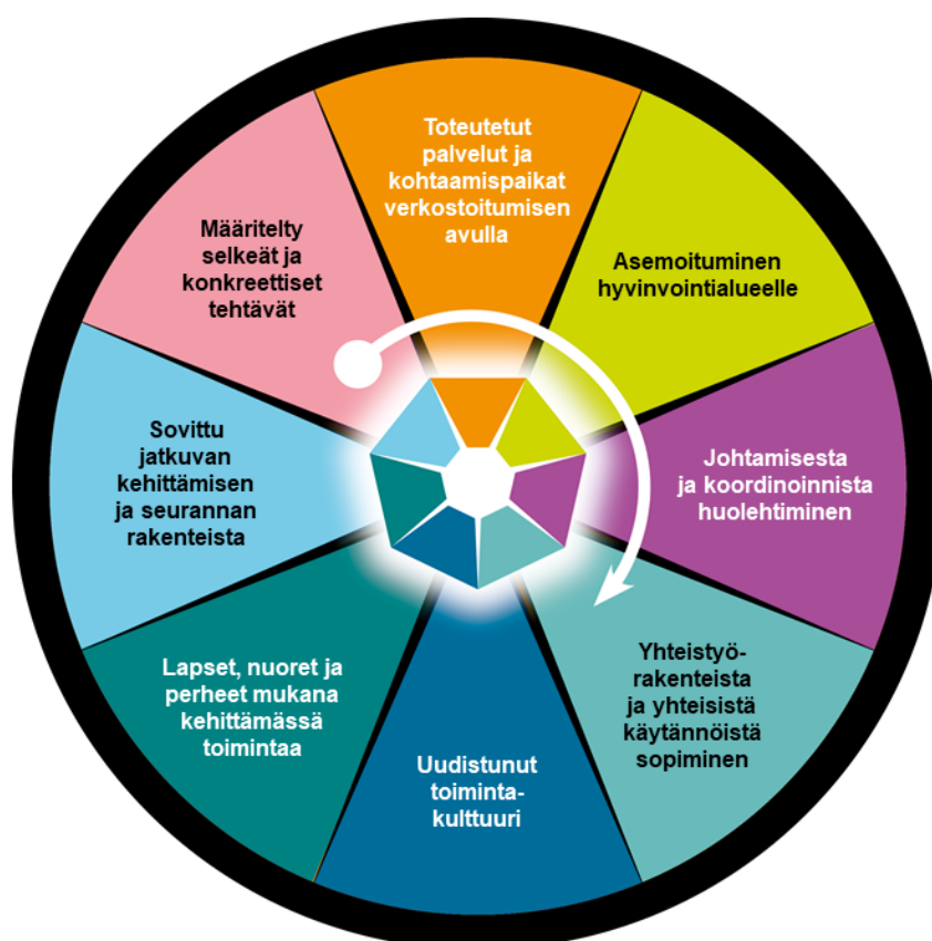
Kuvio 3. Perhekeskustoimintamalli (Terveyden- ja hyvinvoinnin laitos, 2021b-d.)

perhekeskuksen ja arvioida sen toimintaa. Kuviossa 3 on määritetty perhekeskustoimintamallin kahdeksan eri kohtaa ja jokaisen kohdan toteutuessa voidaan puhua perhekeskuksesta. Perhekeskustoimintamalli on kehitetty yhdessä maakunnallisten hankkeiden ja kansallisten toimijoiden kesken Lapsi- ja perhepalvelujen muutosohjelmassa vuosina 2016–2018. (Terveyden- ja hyvinvoinnin laitos, 2021b-d.)