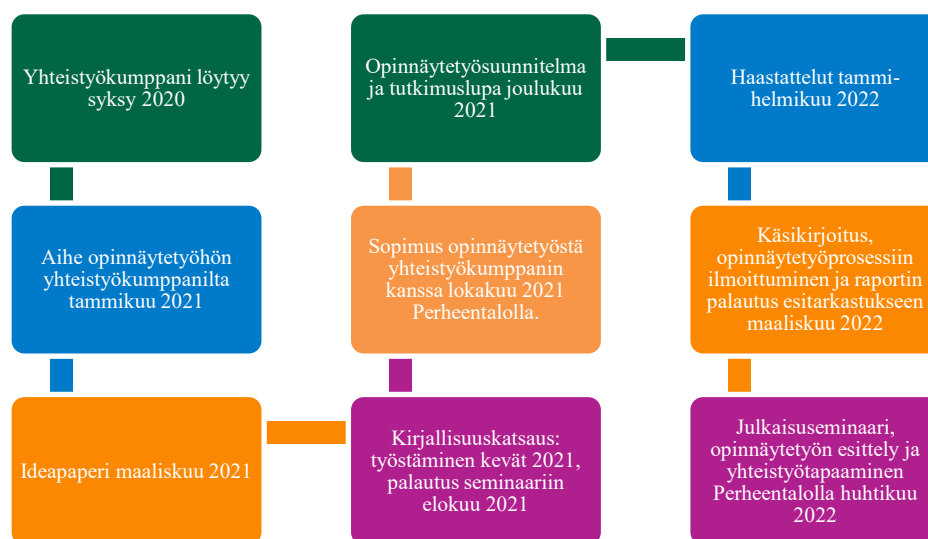
Kuvio 5. Opinnäytetyöprosessin kuvaus