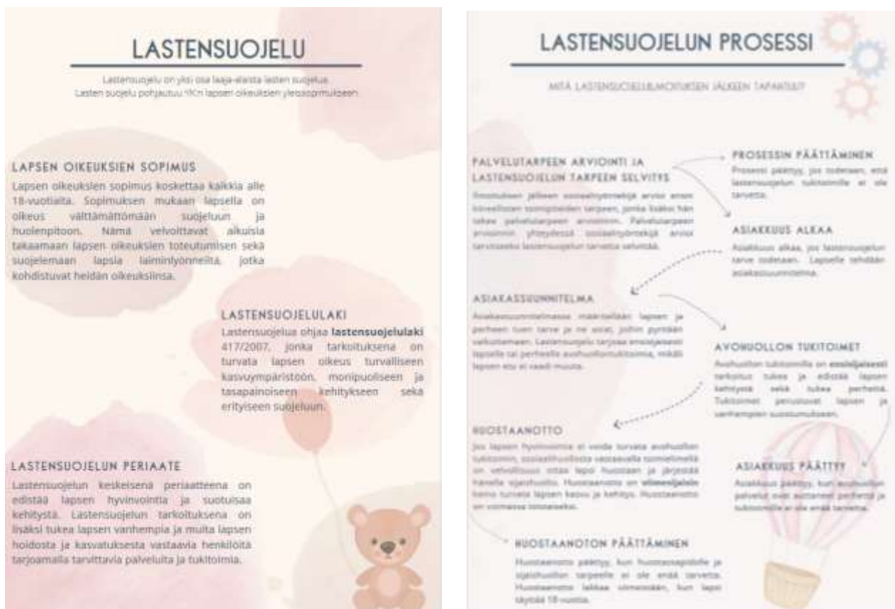
Kuva 1: Kuvia oppaan sisällöstä

Oppaan ulkoasuun haluttiin kiinnittää erityistä huomiota, jotta sitä olisi miellyttävä lukea. Visuaalisen toteutuksen tarkoituksena oli luoda varhaiskasvatustyöskentäjien sopiva teema, joka toisi vaihtelua perinteisiin asiakirjoihin. Teemaksi valikoitui hamepäät vesiväriajäljet sekä eläimet, jotta haastavalta ja raskaalta tuntuva aihe olisi miellyttävämpi lukea (Kuva 1).