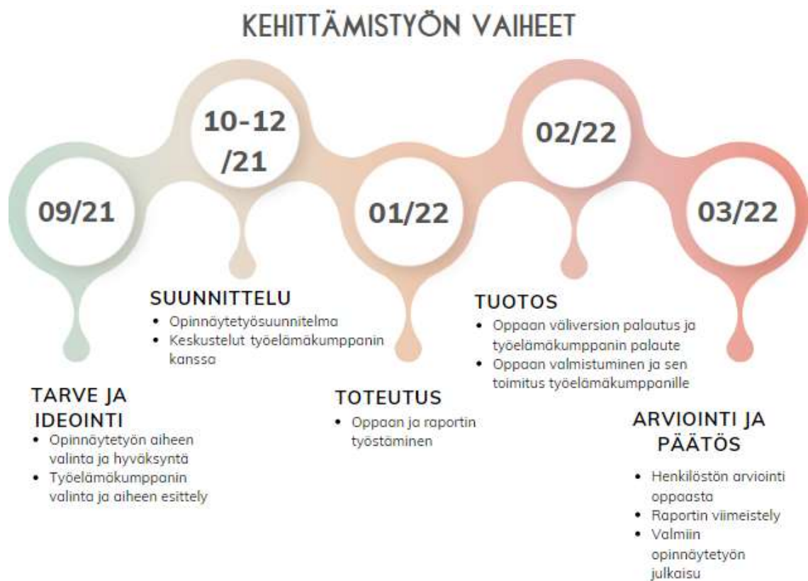
Kuvio 1: Kehittämistyön vaiheet

Kehittämistyön suunnittelu on tärkeää, jotta prosessi pysyy aikataulussa. Salosen ym. (2017, 60) mukaan työskentelyä ei voi kuitenkaan suunnitella yksityiskohtaisesti, sillä kehittämissä työssä voi ilmetä ennalta-arvaamattomia seikkoja. Aikataulusuunnitelma pohjautui kehittämistyön vaiheisiin (Kuvio 1), joka luotiin suunnitelmavaiheessa.