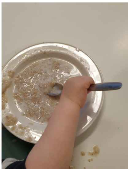
KUVA 5. Lusikalla syöminen (Kallio 2022)

Alle 3- vuotiaiden ryhmässä lapset harjoittelevat omatoimista syömistä ja lusikan käyttöä sekä mukista juomista. Ruokailuvälineiden tulee olla lapselle sopivan kokoisia. Lapsella tulee olla mahdollisuus harjoitella syömistä, vaikka se aiheuttaa vaatteiden likaantumista.