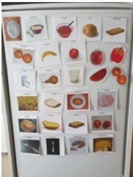
KUVA 3. Ruokailuun liittyviä kuvia (Kallio 2022)

Ruokailutilassa on hyvä olla helposti saatavilla ruokailuun liittyviä kuvia, joita voidaan käyttää puheen tukena ja helpottaa vuorovaikutusta lasten kanssa.