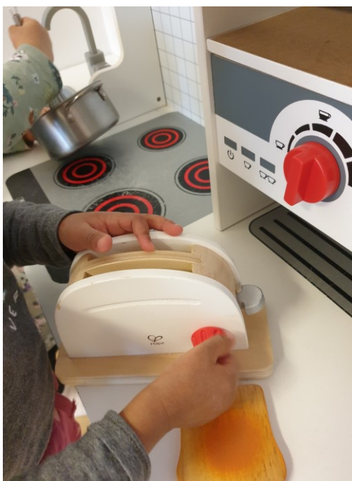
KUVA 10. Kotileikki (Kallio 2022)

Alle 3-vuotiaan lapsen leikki on oppimisen lisäksi tapa hahmottaa maailmaa. Yksi suosituimmista leikeistä pienten ryhmässä on juuri kotileikki. Kotileikissä lapsi saa aikuisen kanssa leikkiessään ilmaista itseään ja aikuisella on mahdollisuus sanoittaa lapsen leikkiä ja nimetä esineitä kotileikissä.