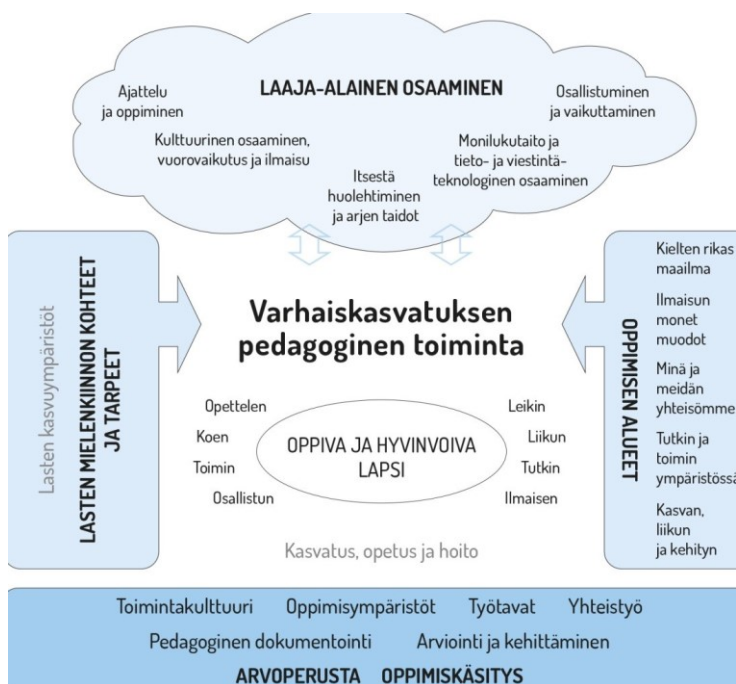
KUVIO 1. Varhaiskasvatuksen pedagogisen toiminnan viitekehys (Varhaiskasvatussuunnitelman perusteet 2018)

Varhaiskasvatussuunnitelman perusteissa määritellään varhaiskasvatuksen olevan suunnitelmista ja tavoitteellista sekä pedagogiikkaa painottavaa hoitoa, kasvatusta ja opetusta. Kuviosta 1 nähdään , millaiseen viitekehukseen ruokakasvatus asettuu päiväkodin toiminnassa. Kaiken toiminnan keskipisteessä on oppiva ja hyvinvoiva lapsi (Varhaiskasvatussuunnitelman perusteet 2018, 36).