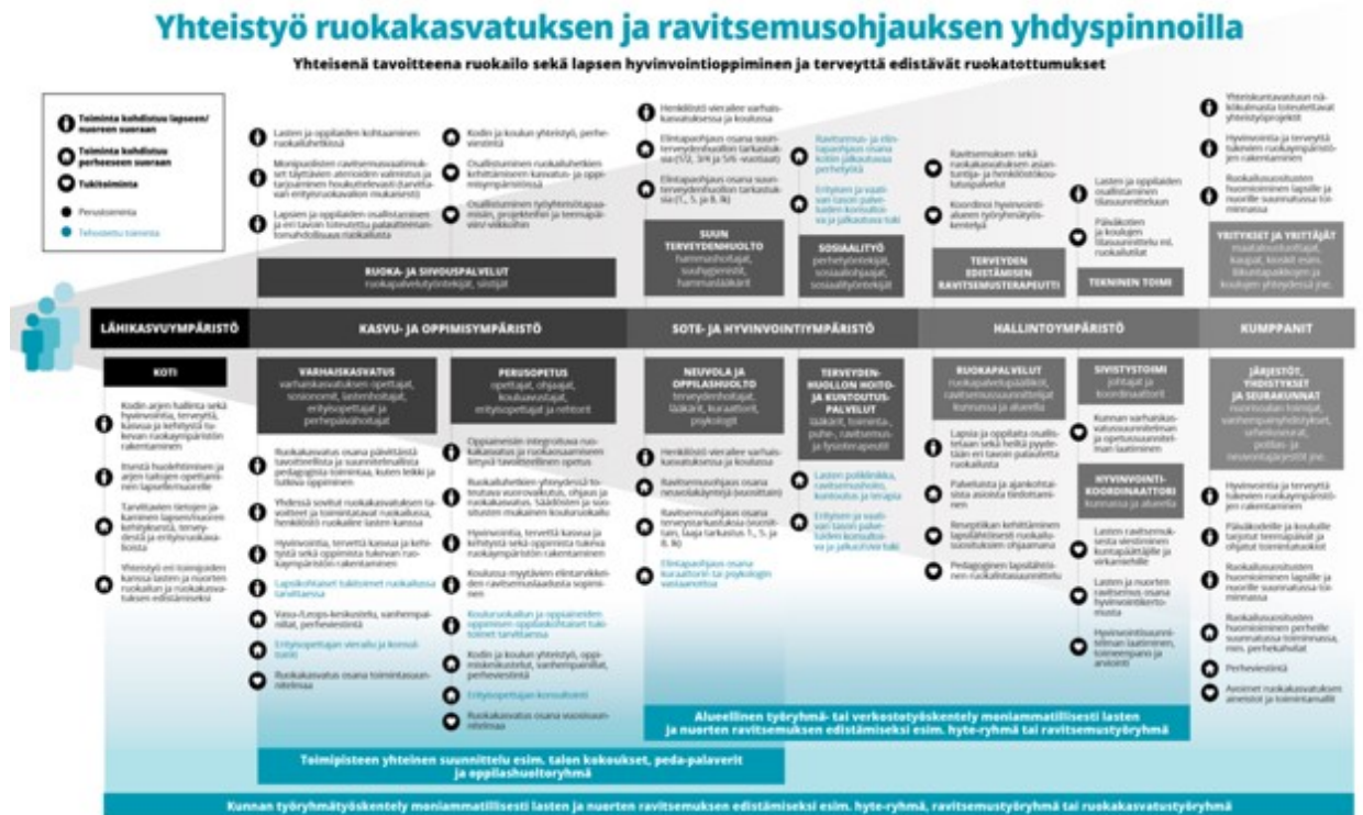
KUVIO 3. Yhteistyö ruokakasvatuksen ja ravitsemusohjauksen yhdyspinoilla (Ruukku ry.)

Alla oleva kaavio auttaa hahmottamaan ruokakasvatuksen eri toimijat ja yhteistyökentän hyvinvointialueiden aloittaessa toiminnan vuoden 2023 alussa. Kuviosta 1. nähdään ruokakasvatuksen ja ravitsemusohjauksen yhdyspinnat. (Ruukku ry, n.d.)