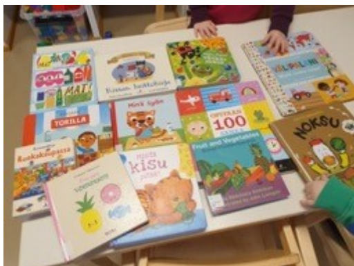
KUVA 9. Ruoka-aiheisia kirjoja (Kallio 2022)

Alle 3-vuotiaiden ryhmässä kielen kehitys on tärkeässä osassa ja kuvien avulla nimetään myös erilaisia ruoka-aineita. Kielenkehityksen tukemiseen toiminnassa käytetään apuna lauluja, loruja ja kirjoja. Ruokaan liittyviä kirjoja on yllättävän vähän saatavilla katselukirjoina. Otin yhteyttä Tampereen kaupunginkirjastoon, josta oli mahdollisuus saada kirjalista avuksi kirjojen etsintään. Sain listan ruokaan liittyvistä kuvakirjoista alle ja yli 3-vuotiaille, tietokirjoista ja erikielisiä kirjoista. Kirjastosta löytyi muutamia alle 3-vuotiaille suunnattuja kovakantisia kirjoja.