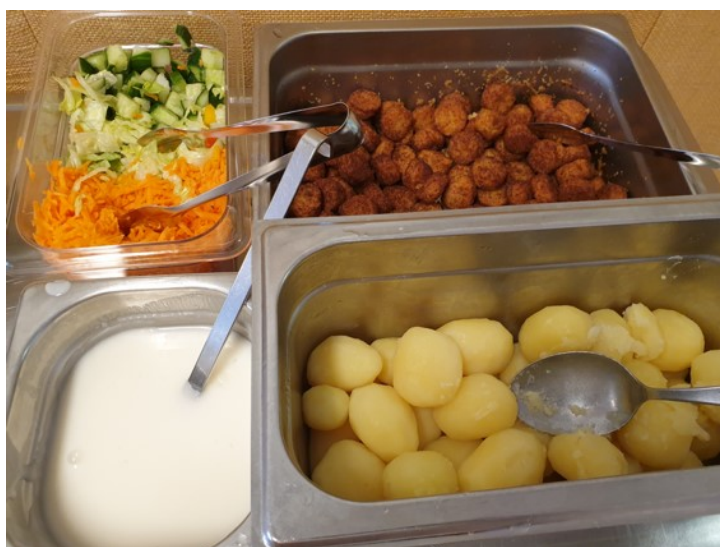
KUVA 1. Päiväkodin lounas (Kallio 2022)

Vuonna 2022 päiväkodin ateria sisältää pääruoan, kasvislisäkkeen, ruokajuo-mana vaihtoehtoina ovat maitoa, vettä, tai piimää sekä näkkileipää ja leipäras-va. Salaatit ovat tarjolla komponentteina, jolloin salaatista on mahdollista tarjota eri raaka-aineet erillään toisistaan , jolloin raaka-aineisiin totuttelu on helpompaa. Päiväkodin henkilökunta annostelee ryhmässä lapsille riittävän ja monipuolisen ateriakokonaisuuden lautaselle.