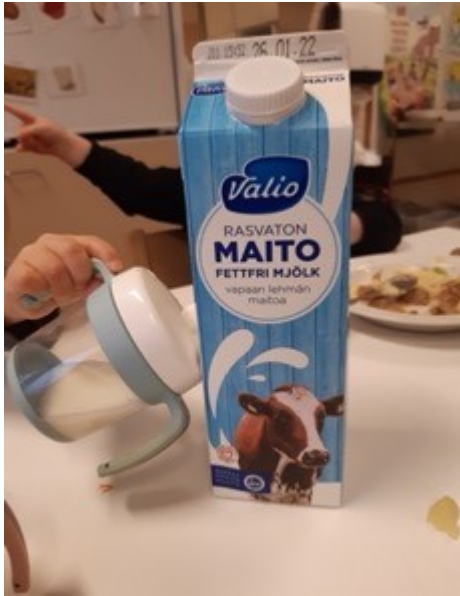
KUVA 11. Yhdessä oppimista (Kallio 2022)

Ruokakasvatus liittyi prosessin aikana suurilta osin ruokailutilanteisiin. Lapsilla oli mahdollisuus kiireettömästi kokea ruokailoa. Kiireetön ruokailu mahdollisti yhdessä oppimisen. Lasten osallisuus ilmeni ruokailutilanteissa yhdessä ihmettelmisenä. Aikuinen mahdollisti ruokailutilanteissa tutkimisen, ihmettelyn ja uuden oivaltamisen. Ihmettely saattoi alkaa yllättäen, vaikka pöydällä olevasta maitopurkista.