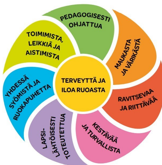
KUVIO 2. Onnistunut ruokailu ja ruokakasvatus (Valtionravitsemus neuvottelukunta 2018, 28).

Valtion ravitsemusneuvottelukunnan Terveyttä ja iloa ruoasta – varhaiskasvatuksen ruokasuositus perustuu valtakunnallisiin varhaiskasvatussuunnitelman perusteisiin. Kuvio 2 nähdään mistä osa-alueista päiväkodin ruokailu ja ruokakasvatus muodostuu. Ruokakasvatus on läsnä päivittäisissä ruokailuhetkissä ja osana päiväkodin pedagogista toimintaa.