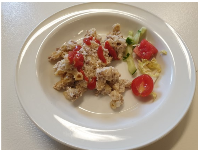
KUVA 2. Lautasmalli päiväkodin lounaalla (Kallio 2022)

Terveyttä edistävä ruoka ehkäisee sairauksia kuten sydän - ja verisuonitautia sekä ylipainon syntymistä. Säännöllisen ateriarhythmin avulla opetellaan suositeltavaa ateriarhythmia, joka on tukena terveellisen ruokavalion omaksumisessa. Alle 3-vuotias lapsi syö pienen määrän ruokaa yhdellä ateriakerralla. Sopiva aterioväli on 3–4 tuntia. Ateriarhythmin lisäksi terveyttä edistävä ruokavalio on koottu lautasmallin mukaisesti eli lautasesta puolet on tuoreita/kypsiä kasviksia, \frac{1}{4} perunaa tai viljalisäkettä ja \frac{1}{4} kalaa, lihaa tai kasviproteiinia. (Terveyden ja hyvinvoinninlaitos 2016, 18–19, 22.)