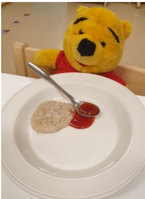
KUVA 6. Pehmolelu aamupalalla.

Lapsen pehmokaverin voi ottaa mukaan ruokailuun antamaan turvaa lapselle. Pienten lasten ruokakasvatuksessa leikillisuus on tärkeässä osassa.