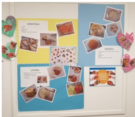
KUVA 7. Ruokakasvatusta infoseinä eteisessä (Kallio 2022)

Eteinen on tila, jossa huoltajat käyvät päivittäin. Eteistilaan laitettavat kuvat tavoittavat huoltajat parhaiten ja kuvien avulla huoltajat näkevät konkreettisesti päiväkodissa tarjottavia ruokia ja ruokakasvatuksen erilaisia teemoja.