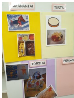
KUVA 8. Päiväkodin toiminta (Kallio 2022)

Päiväkodin eteistilassa voidaan huoltajille kertoa päiväkodin toiminnasta ja samalla laittaa esille päivän aterioita. Alla kuvassa näkyy erään viikon ohjelmaa ja päiväkotiruokia.