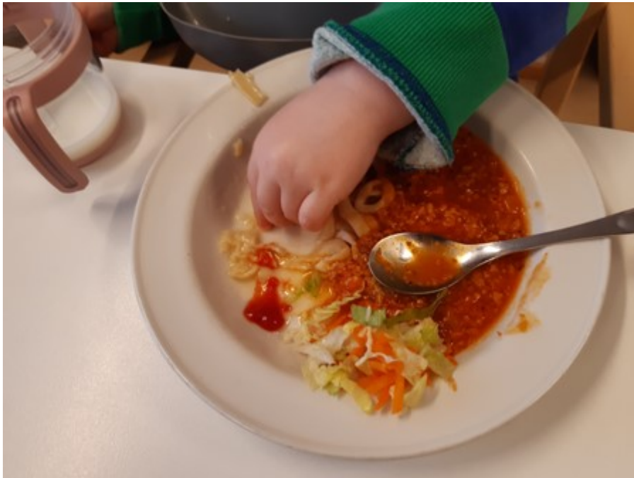
KUVA. 4 Ruokailua sormin.(Kallio 2022)

(Ojansivu, Sandell, Lagström & Lyytikäinen 2014, 3.)