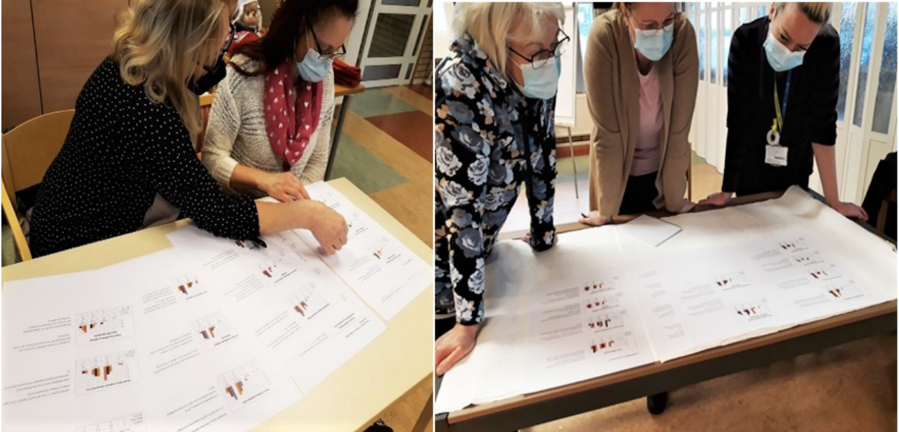
KUVAT 2 ja 3. Tulosten tarkastelua Learning cafe -oppimiskahvilassa.

Learning cafe -oppimiskahvila on toimintamenetelmä, joka sopii yhteiskehittämiseen. Siinä keskustelun, tiedon luomisen ja siirtämisen kautta ideoidaan ja opitaan uutta. [4] Osallistujat nostivat kehitettäväksi niitä osaamisalueita, joihin kokivat tarvitsevansa vahvistamista. Palaute työpajasta oli erittäin myönteistä. Luotettavan lopputuloksen eli hyödyn saamiseksi oli tärkeää, että kehittämistyöhön osallistuivat ne henkilöt, jotka työtä tekevät. Tällainen menetelmä sopi hyvin työyhteisön kehittämisen menetelmäksi. [5]