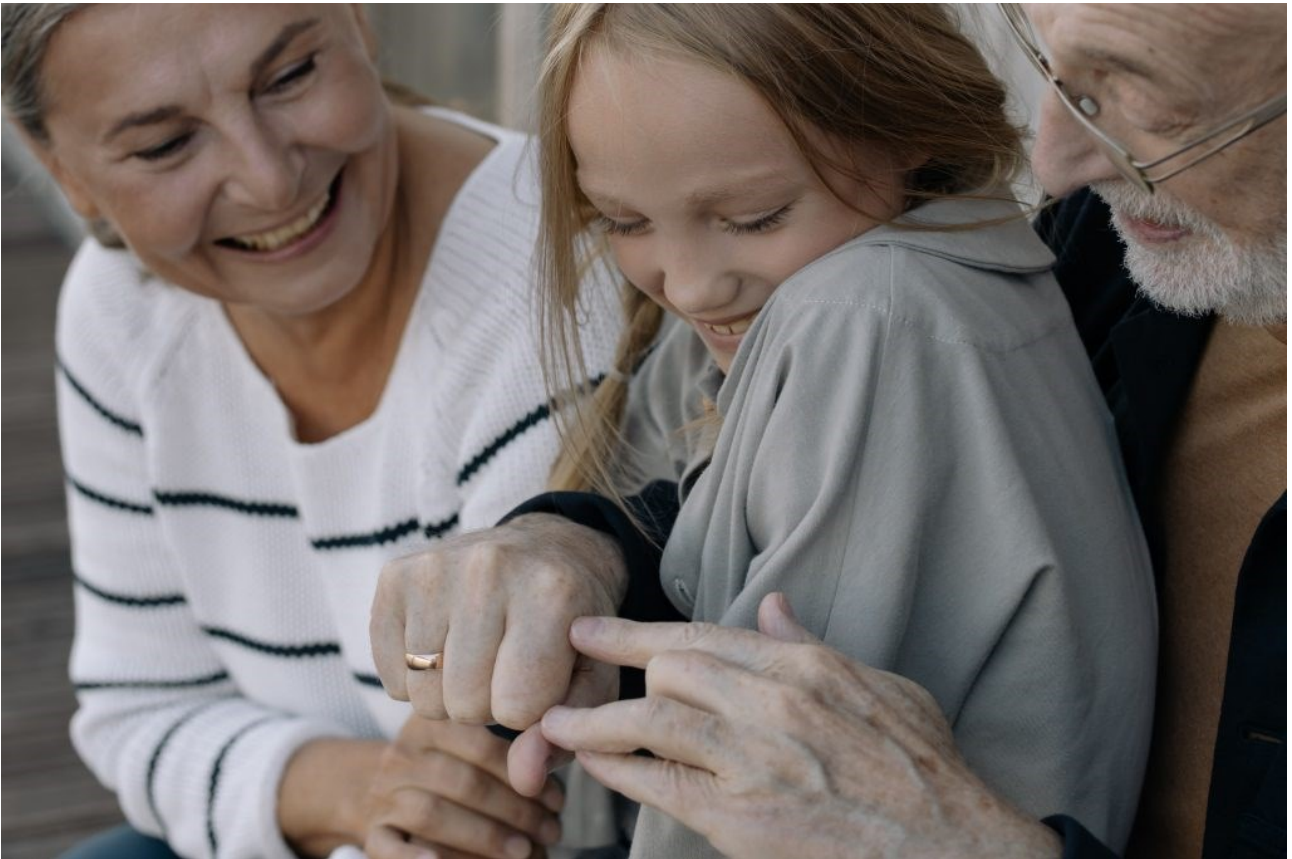
KUVA 1. Asukkaiden läheiset ovat mukana asukkaan arjen suunnittelussa ja toteutuksessa.

Hoitajan työnkuva on monipuolinen ja vaihtelee työvuoroissa. Hoitajan tehtäviin kuuluu huolehtia niin sairauksien ennaltaehkäisystä, perushoidosta, sairaanhoidosta kuin elämän loppuvaiheen hoidostakin. Kliinisen hoitotyön monipuolista osaamista tarvitaan. Kaikesta huolimatta tulisi korostaa, että ensisijaisesti hoitokoti on asukkaan koti eikä terveydenhuoltolaitos. Hoitajan tulisikin muistaa, että ”nämä ihmiset eivät asu minun työpaikallani, vaan minä työskentelen heidän kotonaan”. Hoitajan työhön voi sisältyä erilaisia tehtäviä asukkaan tarpeista lähtien. Palveluasumisen hoitokodeissa tavoitteena on mahdollistaa asukkaalle hyvä elämä ja kokonaisvaltainen hyvinvointi laadukkaan perus- ja sairaanhoidon lisäksi. [2]