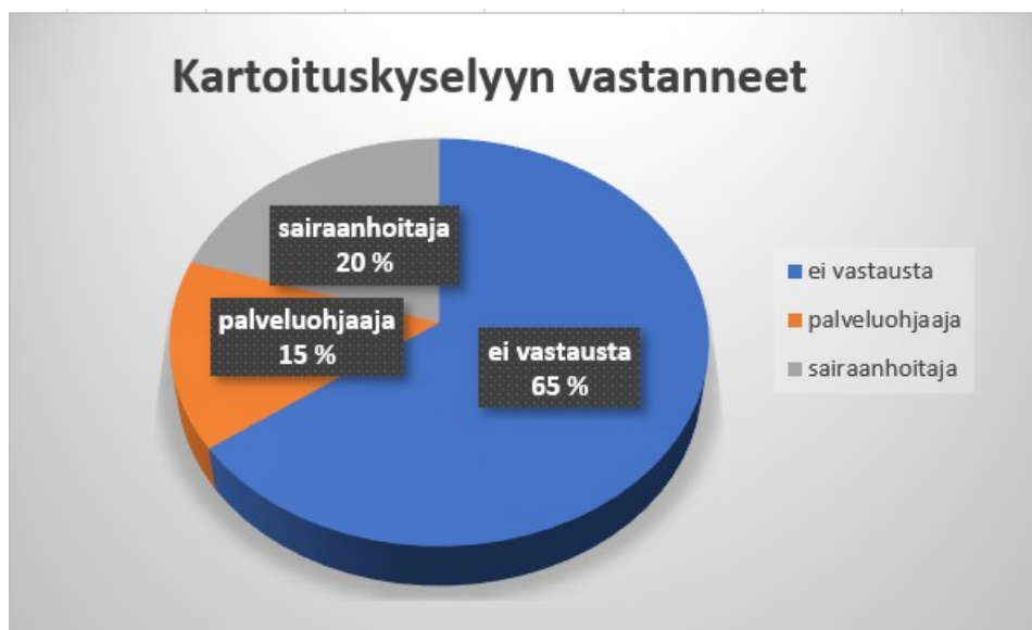
KUVA 1. Kartoituskyselyn vastausprosentit (n=20)