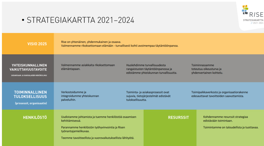
Kuvio 2: Rikosseuraamuslaitoksen strategiakartta (Rikosseuraamuslaitos 2020c)

Rikosseuraamuslaitoksen toimintaa ohjaavia arvoja ovat turvallisuus, oikeudenmukaisuus, ihmisarvon kunnioittaminen ja usko ihmisen kykyyn muuttua. Rikosseuraamuslaitoksen arvoja ja strategiaa ohjaavat kansainväliset sopimukset, kuten Yhdistyneiden kansakuntien vankeinhoidon vähimmäissäännöt, jotka on kansainvälisesti tunnustettu yleismaailmallisiksi vankien vapauden menetystä koskeviksi vähimmäisvaatimuksiksi. Toinen keskeinen Rikosseuraamuslaitoksen arvoja ja strategiaa ohjaava arvoperusta on eurooppalaiset vankeinhoitosäännöt. Vähimmäissäännöissä korostuu mm. kunnioituksen vaatimus vangin ihmisarvoa kohtaan, sekä vankilan rooli valmentaa ihmistä sopeutumaan takaisin yhteiskuntaan. (Rikosseuraamuslaitos 2020c.)