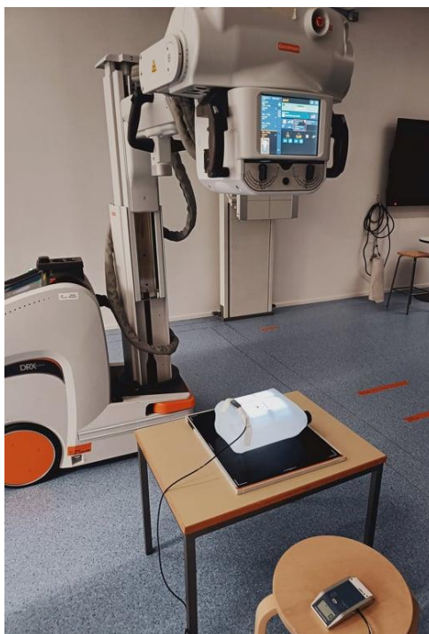
Kuva 4. Kuvassa Carestream osastokone, fantomi sekä säteilymittari. Tässä kuvasimme fantomia ilman säteilysuojaa

Dokumentoimme tutkimuksen vaiheet ja käytetyt menetelmät ottamalla valokuvia tutkimuksen eri vaiheista sekä kirjaamalla tutkimuksen tulokset sekä kuvausparametrit käsin vihkoon ja tietokoneelle valmiiseen Excel-taulukkoon. Tupla varmistimme kirjatut tulokset ja liitimme tarkastetun taulukon opinnäytetyöhön (ks. kuva 6).