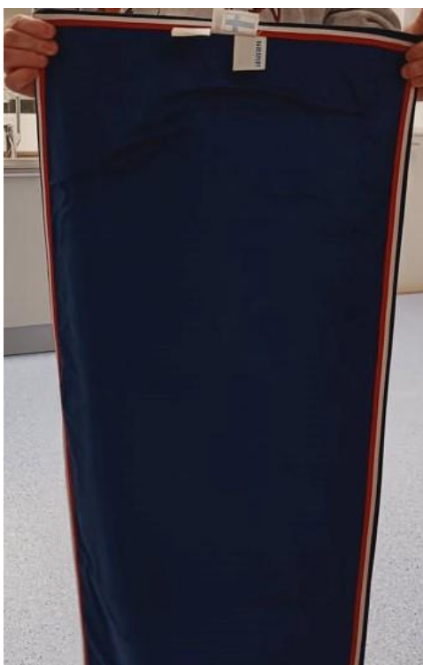
Kuva 3. Kuvassa sädesuojapeitto, joka oli materiaaliltaan lyijyä ja sen paksuus säteily-suojassa 0,5 mm

Kuvasohjelmana käytimme pienikokoisen potilaan thorax AP-projektiota (AP Thx) ja potilaan asento oli maaten. Putkijännite (kVp) oli kaikissa mittauksissa 71, putkivirran ja kuvausajan tulo (mAs) 0.5 ja annoksen ja pinta-alan tulo (DAP) 0.01.