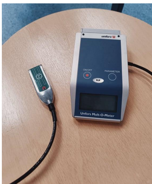
Kuva 1. Kuvassa käyttämämme säteilymittari Unfors Mult-O-Meter

Teimme mittaustutkimuksemme Metropolian Ammattikorkeakoululla. Röntgenlaitteena käytimme Carestream osastokonetta. Vauvaikäistä potilasta kuvastavana fantomina toimi fyysikon valmistama 5 litran kanisteri, joka oli täytetty vedellä. Fantomi sijoitettiin kuvareseptorin päälle. Kuvareseptorina käytimme 35 cm x 43 cm kokoista digitaalista irtoreseptoria. Säteilysuojana käytimme lyijytäytteistä sädesuojapeittoa, jonka lyijyn paksuus on 0,5 mm. Säteilymittarinamme oli Unfors Mult-O-Meter, joka mittasi kuvakentän reunalta fantomin saaman pinta-annoksen, eli ESD:n.