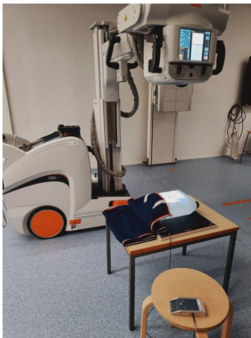
Kuva 5. Tässä kuvassa sama asettelu kuin viime kuvassa, mutta lisätynä sädesuoja- peitto. Havainnollistaa siis tilannetta, jossa kuvasimme annoksia säteilysuojan kanssa