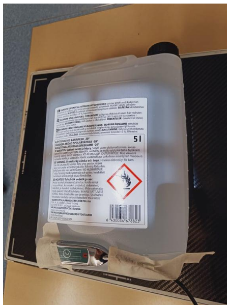
Kuva 2. Kuvassa kanisteri, jota käytimme fantomina kuvastamaan vauvaikäistä potilasta