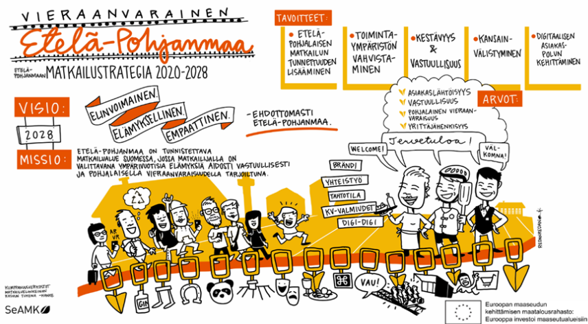
Kuva 1. Matkailustrategian tiivistelmä [Järvinen, Jyllilä & Janhunen 2020].

Vieraanvarainen Etelä-Pohjanmaa - Etelä-Pohjanmaan matkailustrategia 2020–2028 ja toimenpide-ehdotukset 2020–2025 julkaistiin loppuvuodesta 2020. Kestävä matkailu ja vastuullinen toiminta sekä siihen liittyvät toimenpide-ehdotukset on huomioitu strategian yhtenä keskeisenä tavoitteena.