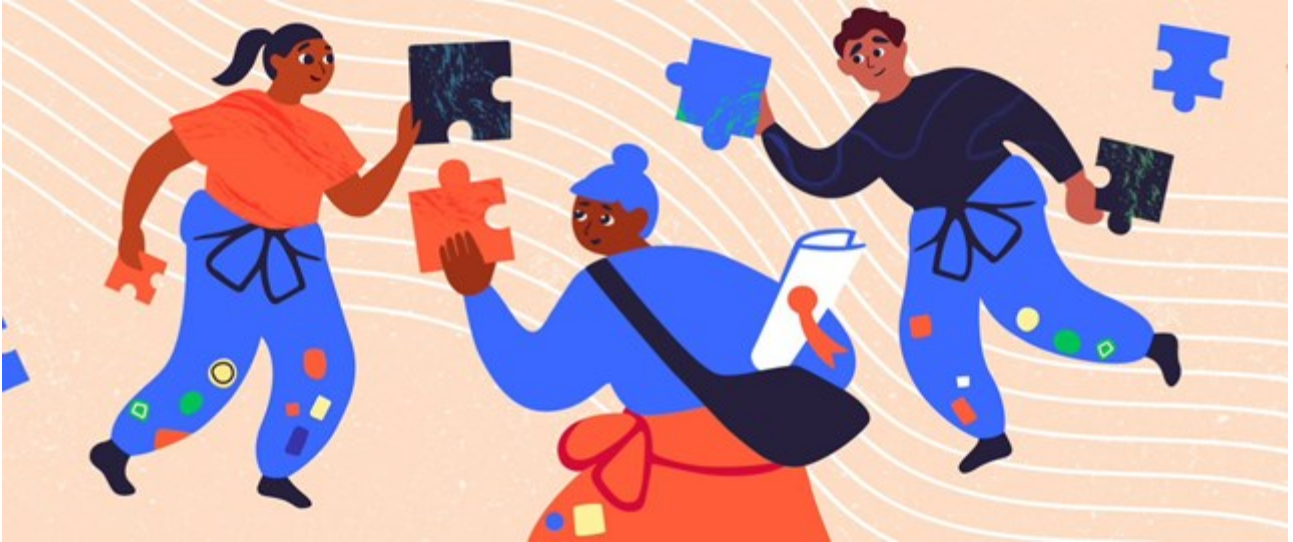
KUVIO 2. Yhteisöllisyyttä verkossa.