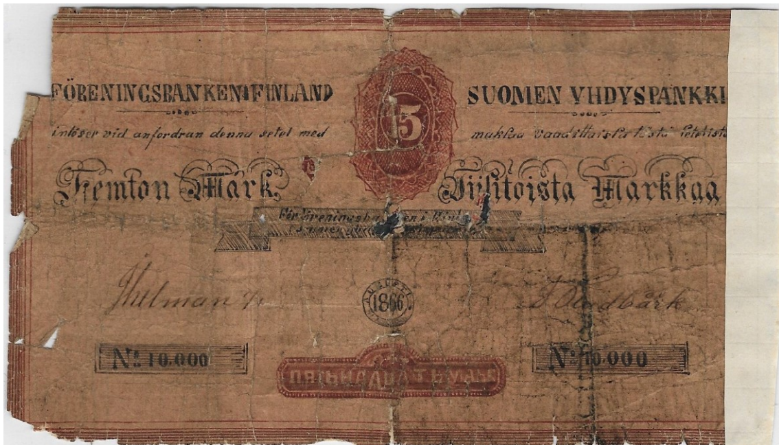
Kuva 4. Väärennetyn Suomen Yhdyspankin 15 markan setelin etupuoli. Huomaa käsin piirretyn väärennöksen selvä kotikutoisuus. Kuvan seteli ei liity uutiseen.

että ilmeisesti imagon kohottamiseksi tarkoitettu osoitus Suomen Yhdyspankin kansainvälisyydestä.