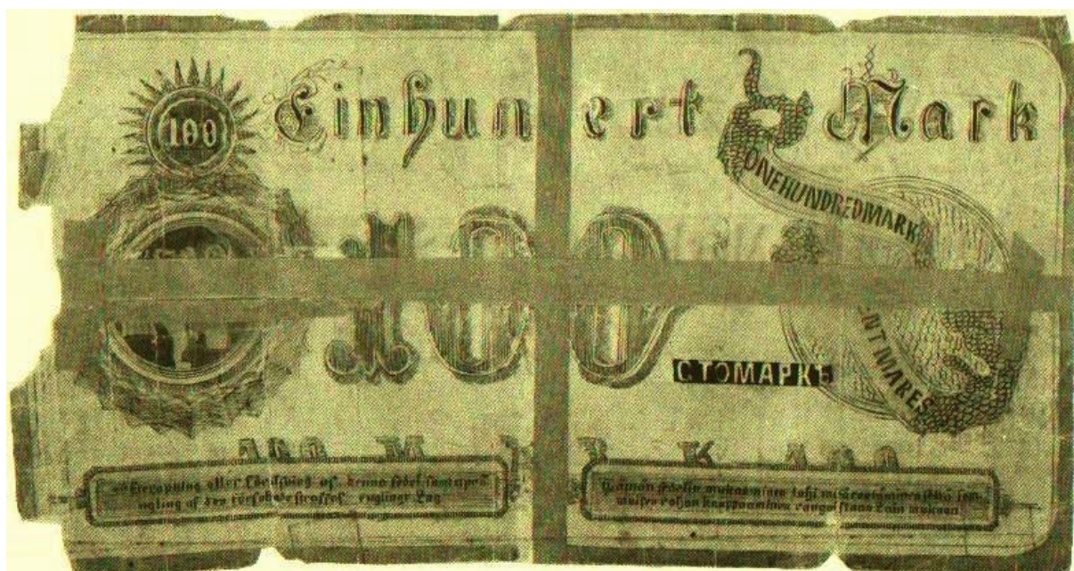
Kuva 15. Erkki Borgin kirjassa Suomessa käytetyt rahat (2. painos 1976 sivu 461) kuvatun väärennetyn Suomen Yhdyspankin 100 markan setelin taustapuoli. Huomaa tämänkin käsin piirretyn väärennöksen selvä kotikutoisuus Kuvan 10 setelissä esiintynyt ranskankielisen tekstin virhe MARES esiintyy tässäkin setelissä – ilmeisesti molemmat ovat saman taiteilijan kynästä