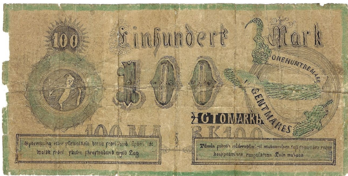
Kuva 14. Väärennetyn Suomen Yhdyspankin 100 markan setelin etupuoli. Kuva Pentti Sunin kokoelmista. Huomaa tämänkin käsin piirretyn väärennöksen selvä kotikutoisuus. Virheiltäkään ei ole välttytty, englanninkielinen teksti on kirjoitettu ONE HUNTRE MARK ja ranskankielisen tekstin CENT MARCS on saanut muodon GENT MARES. Tässä näemme vieraskielisen tekstin edut väärennösten torjunnassa! Myös vasemman reunan medaljongin ”haamu” on hauska. Kuva: Petri Virolainen. Kuvan muokkaus Jorma Impola SeAMK.