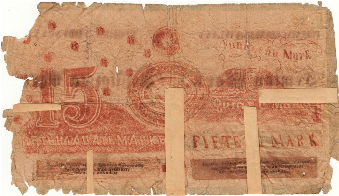
Kuva 10. Toisen väärennetyn Suomen Yhdyspankin 15 markan setelin taustapuoli. Huomaa tämänkin käsin piirretyn väärennöksen selvä kotikutoisuus. Ilmeisesti eri tekijän kynästä kuin Kuvan 3. väärennös.

Seuraavana vuonna 1879 meno se jatkui hurjana Kiuruweden Pankin seteleillä.