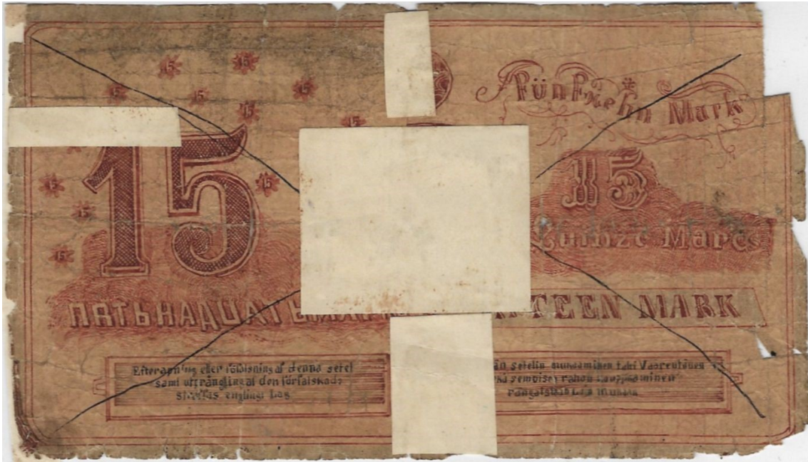
Kuva 8. Väärennetyn Suomen Yhdyspankin 15 markan setelin taustapuoli. Huomaa taustapuolenkin selvä kotikutoisuus. Kuvan muokkaus Jorma Impola SeAMK.