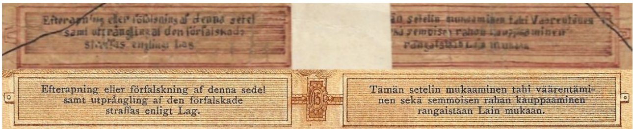
Kuva 9. Väärennetyn Suomen Yhdyspankin 15 markan setelin taustapuolen pienen väärentämisen rangaistavuudesta kertovan varoitustekstin vertailua. Väärennökseen teksti ylinnä, aidon alinna. Väärennökseen käsityön leima on ilmeinen. Hauska yksityiskohta on vasemman puolisen tekstilaatikon ylärivin viimeinen sana ”sedel”, joka on väärennökseessä tullut muotoon ”setel”.