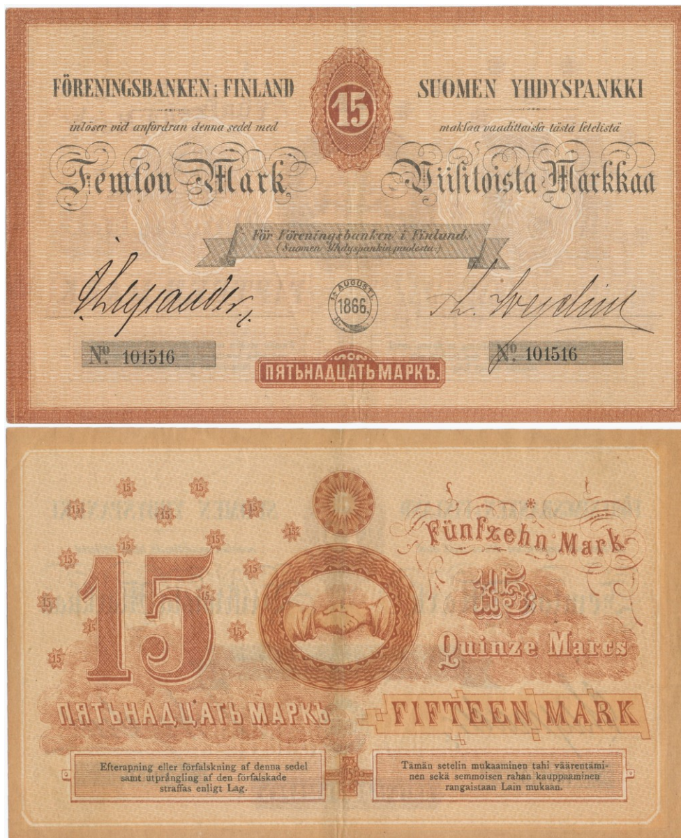
Kuva 3. Aito Suomen Yhdyspankin 15 markan seteli mallia 1866. Allekirjoittajina Johan Jakob Lupander ja Theodor Wegelius. Mielenkiintoisena yksityiskohtana setelin arvomerkinä peräti kuudella eri kielellä! Tämä oli sekä turvallisuustekijä

Seteleitä tosiaankin rupesi löytymään erityisesti markkinoilta ympäri Suomea, ja kansan tuli todellakin olla tarkkana Yhdyspankin seteleiden kanssa.