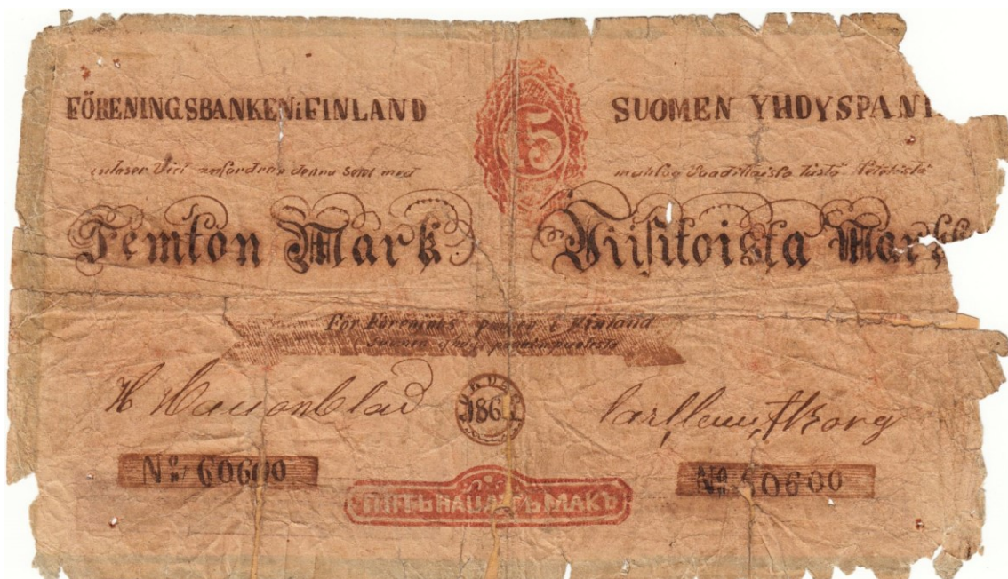
Kuva 5. Toisen väärennetyn Suomen Yhdyspankin 15 markan setelin etupuoli. Huomaa tämänkin käsin piirretyn väärennöksen selvä kotikutoisuus. Ilmeisesti eri tekijän kynästä kuin Kuvan 2.