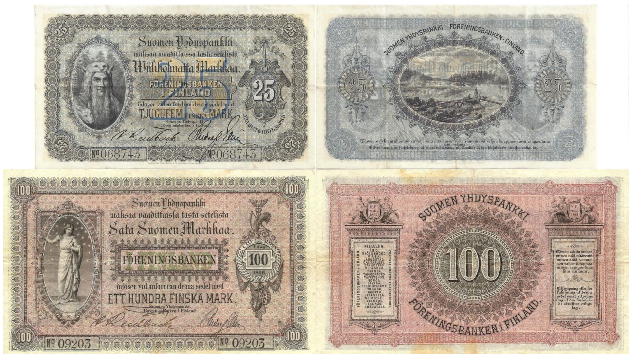
Kuva 16. Suomen Yhdyspankin 25 sekä 100 markan (molemmissa allekirjoittajat Anders Johan Rudbäck ja Rudolf Elving) setelit mallia 1882. 25-markkaisen kuva Michael Wideniuksen kokoelmista. Kuvien yhdistely ja muokkaus Jorma Impola SeAMK.

Toisessa mallin 1882 tyyppissä tunnetaan 9 erilaista allekirjoitusparia: vTö/Hje, Lup/???, Lup/Rud Rud/Elv, Rud/Lup, Rud/Sjö, Rud/vTö, Rud/Weg, Weg/Rud, allekirjoitusten kuvat ovat aiemmassa Kuvassa 2.