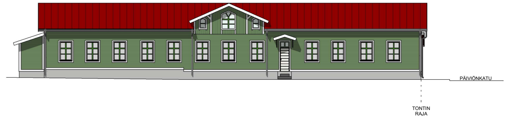
JULKISIVU LÄNTEEN 1:100