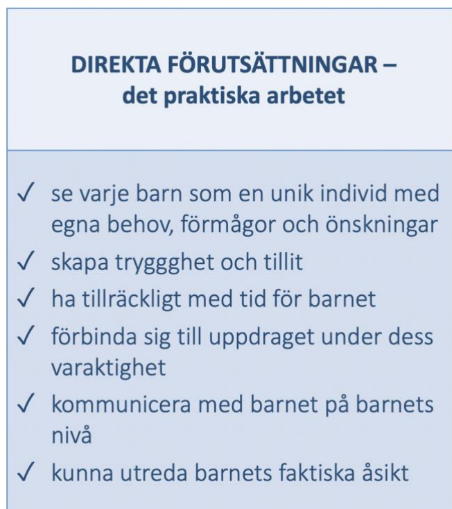
Figur 3 Direkta förutsättningar

Direkta förutsättningar presenteras i form av en figur (se figur 3) och varje punkt i figuren förklaras mera ingående i den löpande texten. Till direkta förutsättningar hör; att kunna bemöta barn som unika individer, skapa trygghet och tillit, ha tillräckligt med tid för barnet, förbinda sig till uppdraget under hela dess varaktighet, kommunicera med barnet på barnets nivå och kunna utreda barnets faktiska åsikt.