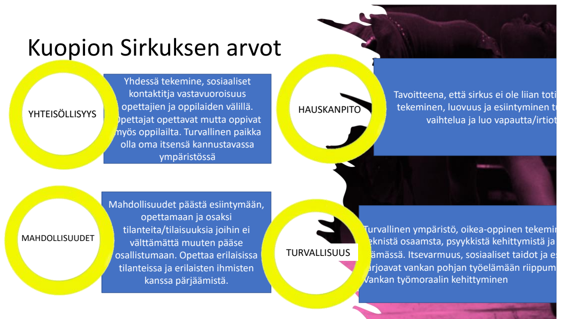
Kuva 1. Arvot.

Strategiapäivän työskentelyn yksi tarkoitus oli kirkastaa ja selventää Kuopion sirkuksen arvot. Arvojen auki kirjoittaminen vaikuttaa kaikkeen työhön työyhteisössä ja toimii sitouttavana tekijänä yhteiseen tekemiseen. Arvot luovat pohjan opetussuunnitelman lähtökohdille. (Hilvo 2015, 61.) Näiden arvojen mukaan toimintaa oli toteutettu jo useamman vuoden ajan ja tämä huomattiin niitä auki kirjoitettaessa. Strategiapäivän työskentelyssä Kuopion Sirkuksen työntekijät kirjasivat ylös sirkuksen arvot, joiksi valikoituivat yhteisöllisyys, hauskanpito, turvallisuus ja mahdollisuudet (kuva 1).