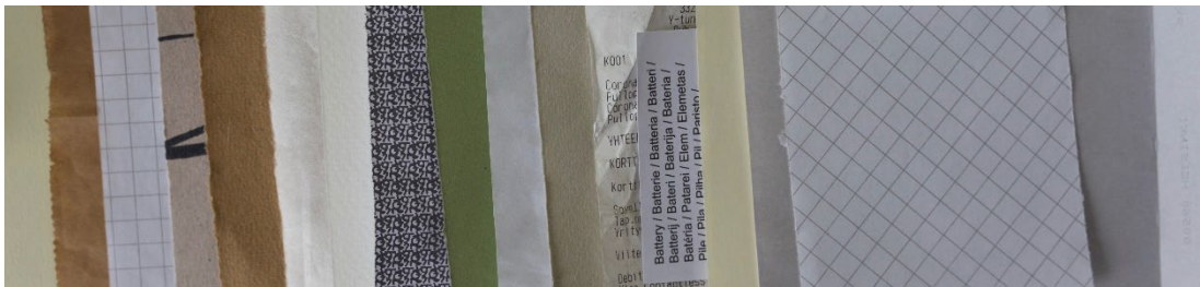
Kuva 6 Esimerkkejä käyttämästäni papereista.

Opinnäytetyöni teososa koostuu 24. pienikokoisesta kuvasta. Kuvat on tehty vaihtelevilla välineillä, erilaisille papereille ja pahveille. Pohjamateriaalit ovat hylkytavaraa muista teoksista, jätöpapereita ja maasta löydettyjä lappusia (Kuva 6) Minusta on kaunis ajatus että teknisen harjoittelun, tutkimisen ja ajatustyön avulla tehdä noinkin vaatimattomasta esineestä jotenkin merkityksellisen. Arkielämän ylijäämänä ympäri nurkia pyörivät kuitit, laskujen kuoret, ostoslistat ja muistilaput ovat kaikille tuttuja, ja ajattelen että se tuttuus tekee teoksistani helposti lähestyttäviä kenelle tahansa.