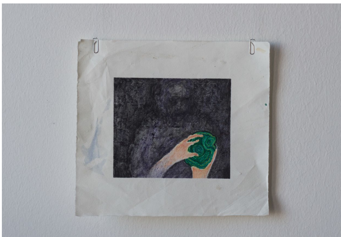
Kuva 3 Malakiitti, 2021. Ensimmäinen valmis teos uuteen opinnäytetyöhöni.

En heittänyt sitä teosta roskalavalle, se on edelleen tallessa, mahdollisesti menossa, joskus johonkin näyttelyyn. Loppujen lopuksi on selvää, että ensimmäinen opinnäyte-työni oli yhtä tarpeellinen kuin lopullinen työ. Se oli tarvittava konkreettinen todistus siitä, mitkä asiat taiteen tekemisessä ja katsomisessa eivät sovi minulle. Se toimi alkupisteenä, josta lähdin tarkentamaan oman itseilmaisuni aitoja ja luonnollisia piirteitä ja niiden saattamista oikeaan muotoonsa. Muutama päivä ennen joulua 2021 aloitin uuden opinnäytetyn teososuuden. Piirsin "Malakiitti"- teoksen, ja lähdin hatarin aske- lin uutta teoskokonaisuutta kohti. (Kuva 3)