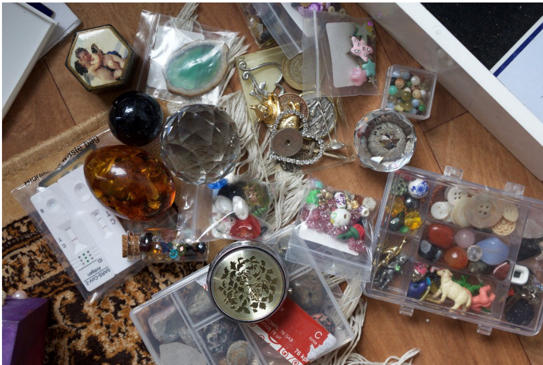
Kuva 4 Aarteita lajiteltuina erilaisiin rasioihin ja pusseihin.

Voi kuulostaa vähän hassulta tällainen omien harrastusten avaaminen opinnäytetyössä, mutta niin kuin edellisessä kappaleessa totesin, näen että harrastukset ovat itseilmaisua ja vaikuttavat näin suoraan taiteelliseen työskentelyyni. Kerään asioita niiden kauneuden ja merkityksen takia ja nuo samat elementit olen aina kokenut hyvin tärkeiksi liittää teoksiini. Myös esineiden yksityiskohtainen tarkastelu ja niistä viehättyminen, on suoraan vaikuttanut haluuni tehdä nimenomaisesti esittäviä kuvia. Esittävässä kuvassa voin ilmaista aineellisia asioita, joita voin kuvitella tutkivani aarteiden tapaan.