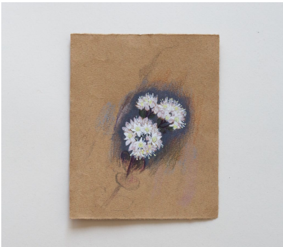
Kuva 9 Muisto isomaksaruohosta, 2022

enemmän luonnon kokemista kuin ihmislähtöisen itseilmaisun kokemista. Monumentaaliset veistokset herättävät herkemmin samoja ajatuksia kuin siirtolohkareet tai valtavat puut, eivätkä tunnu verrannollisilta vaikkapa pienen taulun kanssa. Suuret installaatiot ja niiden kokeminen on kiinnostavaa juuri siksi että vaikka ne tuntuvat samalta kuin luonnon kauneus tai arkkitehtuuri, ne saattavat silti ilmaista jotain yhtä inhimillistä ja lähestyttävää kuin pieni vesivärimaalaus. Tästä herää kiinnostava ajatus siitä voisiko todella pieni kaksiulotteinen teos koskaan tuntua luonnonkauneuden katsomiselta? Onhan luonnossa myös pienikokoisia kohteita kukkia, eläimiä ja pikkukiviä. Niiden kuvaamisessa taiteessa, teoksen tyydyttävyys liittyy osin myös säilyvyyteen, johon olen pyrkinyt teoksessa ”Muisto isomaksaruohosta” (Kuva 9). Luonnossa pienet asiat ovat katoavaisia ja muuttuvia, ja taide teos voi mahdollistaa niiden kauneuden kokemisen milloin vain vuodenajasta tai säästä riippumatta. Ehkä taideteos kukasta ei tunnu samalta kuin kukan katsominen, mutta ainakin siinä voi olla jotain samoja ihmisilmälle merkittäviä osasia ja eloisuutta.