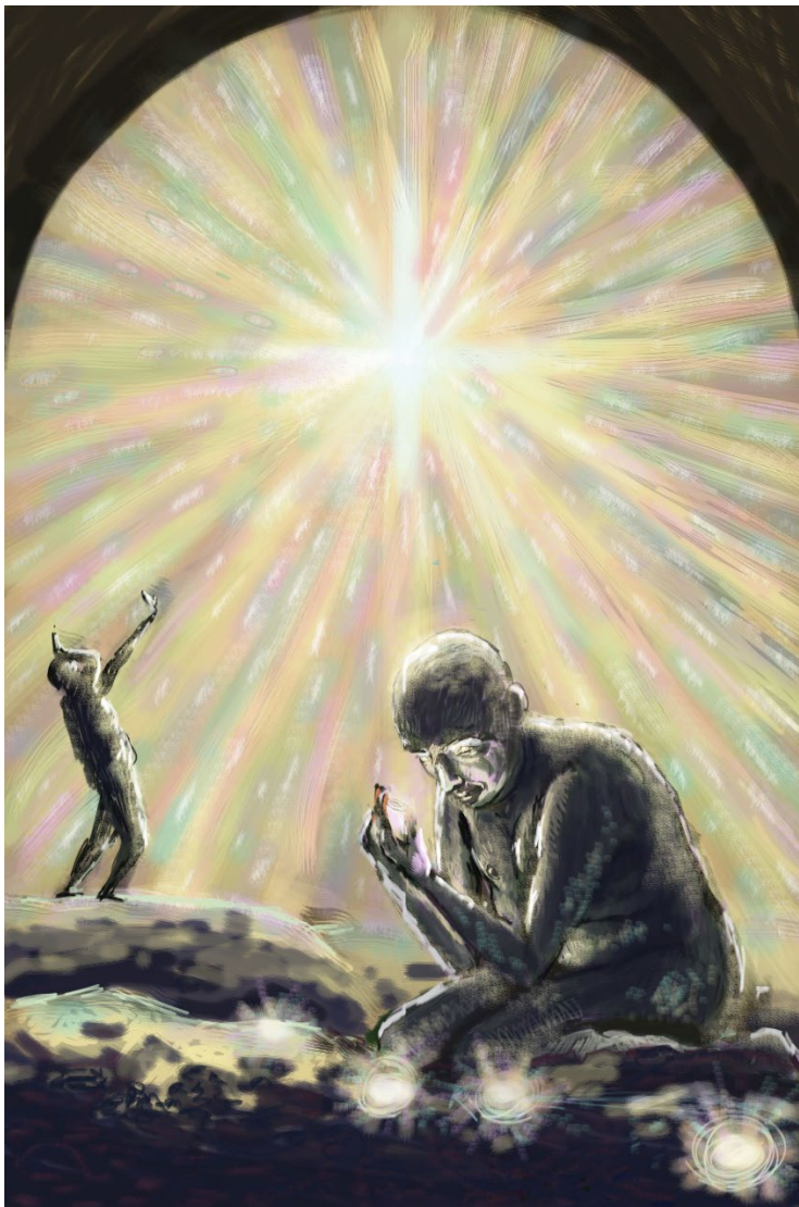
Kuva 1 Luonnon ensimmäisen opinnäytetyön teososuuden maalauksesta.

neella, kunnes värit ja sommitelma alkoivat käydä selviksi.(Kuva 1)