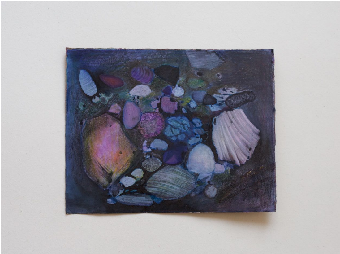
Kuva 8 Oortin pilvi, 2022

Teosteni kuva-aiheet voivat ensisilmäyksellä vaikuttaa hyvin satunnaisilta, ja sitä ne tiettyyn pisteeseen asti ovatkin. Suurin osa teoksistani on esittäviä kuvia, vaikka harvoin aloittaessani tiedän mitä kuvaan on tulossa. Esittävyys on minusta tarpeellinen elementti kuvissa joita teen. Selkeä liitos olemassa olevaan maailmaan ja sen materiaan tekee kuvasta helposti lähestyttävän ja arkisen, abstraktiin teokseen verrattuna. Itse kuva-aiheista voisi poimia usein toistuvina ainakin ihmisen, pienet esineet ja luonnon. Esimerkki pienesine aiheesta toimii teokseni ”Oortin pilvi”. (Kuva 8)