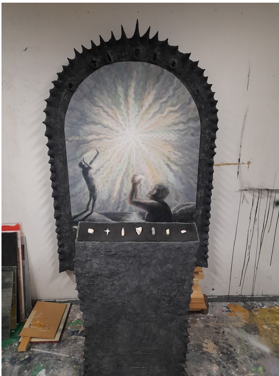
Kuva 2 Ensimmäinen opinnäytetyön teososuus valmiina.

vyyn, jonka päälle laittaisin vielä kipsikerroksen ja kipsikoristeet. Täysin uuden tekniikan haltuunotto oli jännittävää ja kehyksiä rakentaessa tein selkeästi eniten virheitä. Moniin muihin veiston tekniikoihin verraten tällainen eristyslevyn ja kipsin kanssa työskenteleminen oli kuitenkin hyvin vaivatonta ja monien ongelmien ratkaisut olivat minunkin, veistoa suhteellisen vähän harrastaneen, löydettävissä. Kehysten kanssa opeteltua tekniikkaa käytin myös pienten veistosten jalustan rakentamisessa. Joulukuun 2021 alussa lopputyöni oli valmis. (Kuva 2)