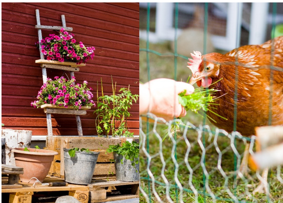
KUVA 1 & 2. Setlementti Ukonhattu ry:n kesän aikaista Green care- toimintaa (Suomalainen 2021).

Asumispalveluihin sovellettavat Green care- toimintamenetelmät liittyvät asiakkaiden hyvinvoinnin ja toimintakyvyn edistämiseen sekä ylläpitämiseen. Green care- toiminta asumispalveluita käyttäville asiakkaille voi olla osa yksilön hoivaan ja hoitoon liittyvää palvelua, osa asiakkaan kuntoutussuunnitelman tai sosiaalisen vahvistamisen mukaista prosessia. Keskeistä Green care- toimintaan pohjautuvassa kuntoutumisprosessissa on, että se etenee asiakkaan omilla ehdoilla ja työntekijän tarjoaman tuen sekä luontolähtöisten menetelmien avulla. (Tolvanen 2017, 21.)