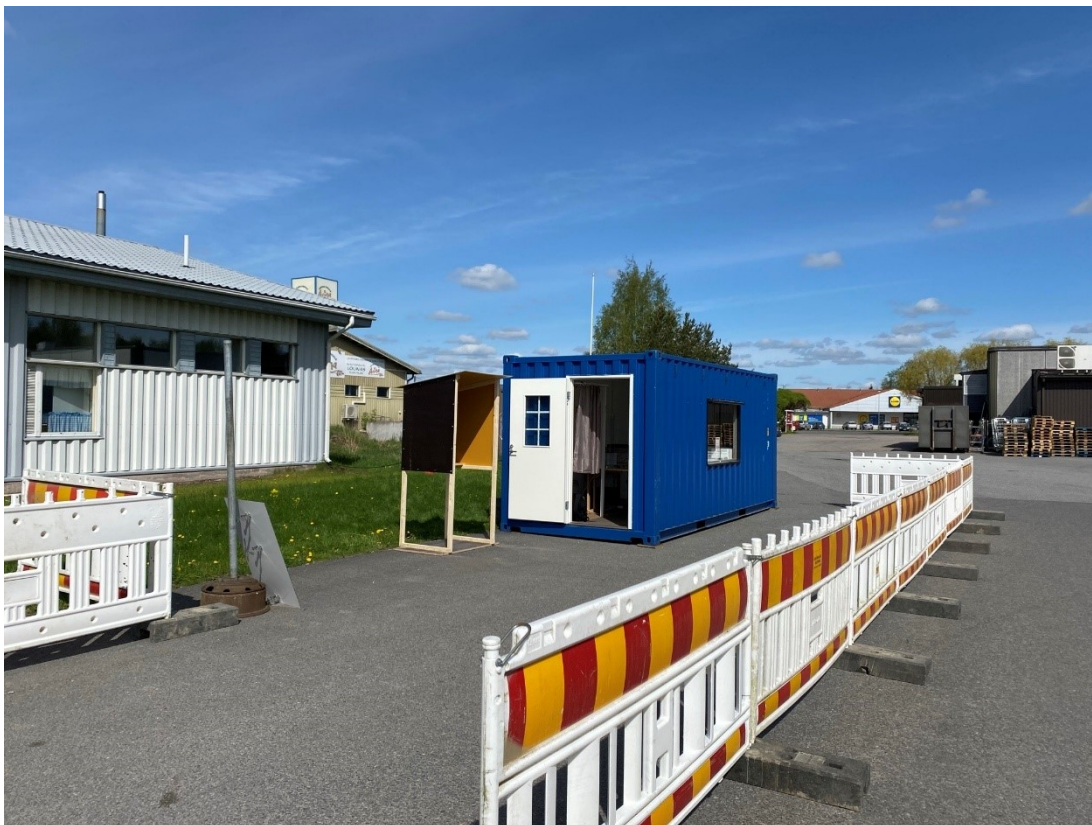
Kuva 1. Sastamalan kaupungin drive-in äänestyspaikka kuntavaaleissa 2021.