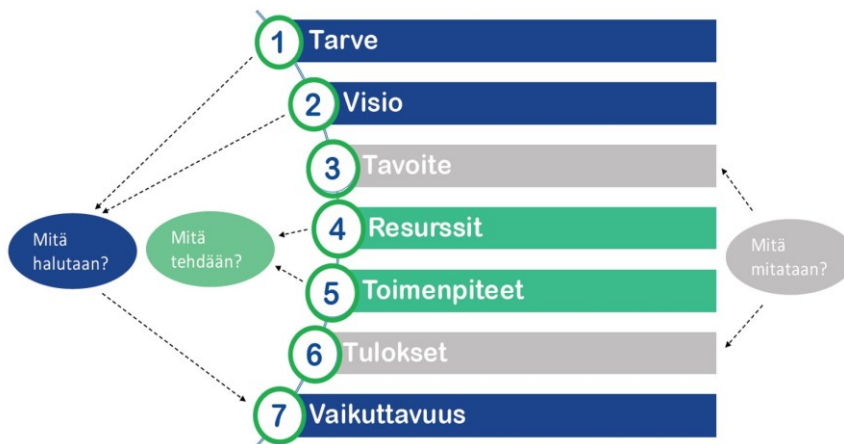
Kuvio 1: Hyvän mitta –hankkeen vaikuttavuusketju (Hyvän Mitta 2022b).

Hyvän Mitta –hankkeen vaikuttavuusketju koostuu seitsemästä vaiheesta: tarpeesta, visiosta, tavoitteesta, resursseista, toimenpiteistä, tuloksista ja vaikuttavuudesta. Ensimmäisenä vaiheena on tunnistaa mistä yhteiskunnallisesta ilmiöstä, haasteesta tai ongelmasta ollaan kiinnostuneita. Tarvetta määriteltäessä tulee toteuttaa perusteellinen toimintaympäristön analyysi ja arvioida miten käsiteltävä ongelma kohdistuu valittuun kohderyhmään. Toisessa vaiheessa määritetään visio, eli tulevaisuuteen kurottava ajatus siitä, mitä ongelman osalta halutaan saavuttaa pitkällä aikavälillä. Kolmannessa vaiheessa määritellään, mitä konkreettisia tuloksia on synnyttävä, jotta vision toteutuminen on mahdollista. Ketjun neljäntenä vaiheena määritellään, mitä resursseja vision toteuttamiseen valitun kohderyhmän osalta tarvitaan. Viidentenä vaiheena on määrittää, mitä toimenpiteitä käytössä olevilla resursseilla toteutetaan. Vaikuttavuusketjun kuudentena vaiheena määritellään miten ja millä aikavälillä tuloksia syntyy ja miten niitä seurataan. Viimeisenä eli seitsemäntenä vaiheena on määrittää mitä vaikutuksia tulosten saavuttamisesta seuraa pitkällä aikavälillä suhteessa alkuperäiseen tarpeeseen. Vaikuttavuuden analysoiminen tuottaa tietoa siitä kuinka merkittävästi valitulla toimintamallilla pystytään tuottamaan taloudellisia ja inhimillisiä hyötyjä yhteiskunnalle. (Hyvän Mitta 2022b.)