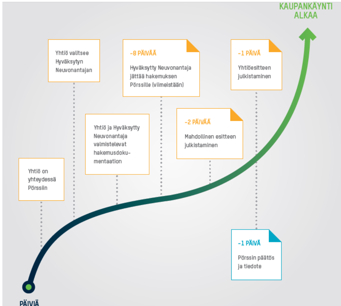
Kuva 2. Listautumisprosessi (Nasdaq OMX).

vaiheesta kaupankäynnin kohteena olon aikana. Neuvonantaja toimii usein yhtiön eräänlaisena tukihenkilönä listautumisen jälkeenkin. Pörssi valvoo myös, että Hyväksytyt Neuvonantajat noudattavat tehtäviään.