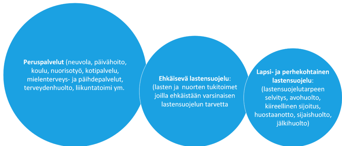
Kuvio 1. Lastensuojelun kokonaisuus (Taskinen, 2007, s. 13).

Suomessa nuorten hyvinvointi kuuluu kaikille yhteiskunnanjäsenille. Nuorten hyvinvoinnista huolehtimisen tulisi olla naapurin, tuttavan, opettajan ja vanhemman yhteinen tehtävä. Lastensuojelu toimii yhtenä silmukkana laaja-alaisessa verkostossa nuorten turvaksi.