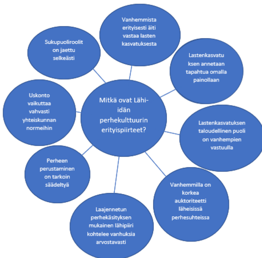
KUVIO 3. Toisen tutkimuskysymyksen sisällönanalyysin tulokset.

Kuviossa 3. on tuotu esille toisen tutkimuskysymyksen sisällönanalyysin tulokset. Haastateltavat toivat esille äidin korkean arvon perheessä. Vanhemmista erityisesti äiti vastaa lastenkasvatuksesta. Äiti hoitaa kodin ja lapset, isä perheen asiat kodin ulkopuolella. Äitien tekemää tuoretta kotiruokaa arvostetaan. Naisen arvostus lisääntyy huomattavasti äidiksi tulon jälkeen.