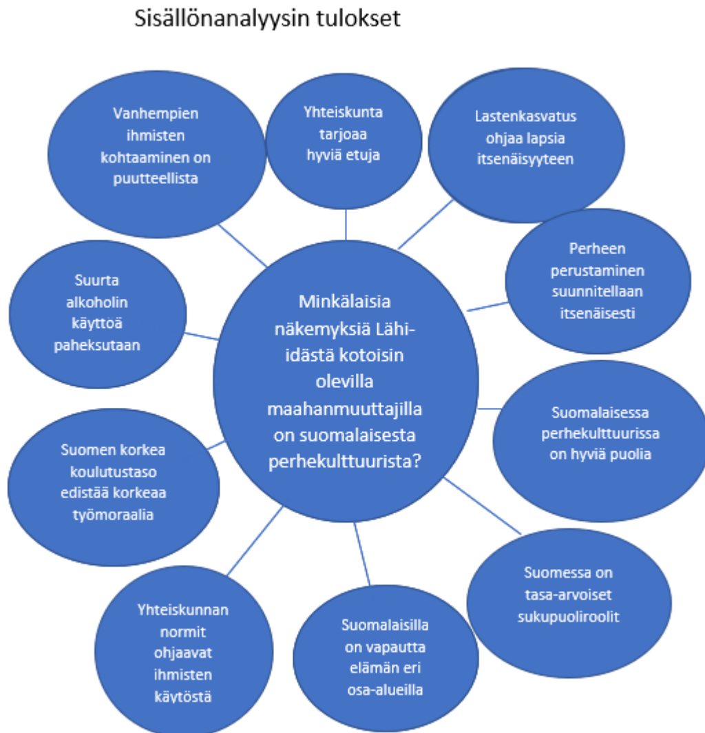
KUVIO 2. Ensimmäisen tutkimuskysymyksen sisällönanalyysin tulokset.

Kuviossa 2. on tuotu esille ensimmäisen tutkimuskysymyksen sisällönanalyysin tulokset. Haastateltavat toivat esille, että suomalainen yhteiskunta tarjoaa hyviä etuja eri elämänvaiheissa. Lapsiperheille tarjotaan äitiyspakkaus, vanhempainrahat ja -vapaat sekä varhaiskasvatus, vanhuksille eläkkeet ja vanhustenhoito, jota toteutetaan tyypillisesti kotihoidolla ja palvelutaloissa yhteiskunnan tarjoamana.