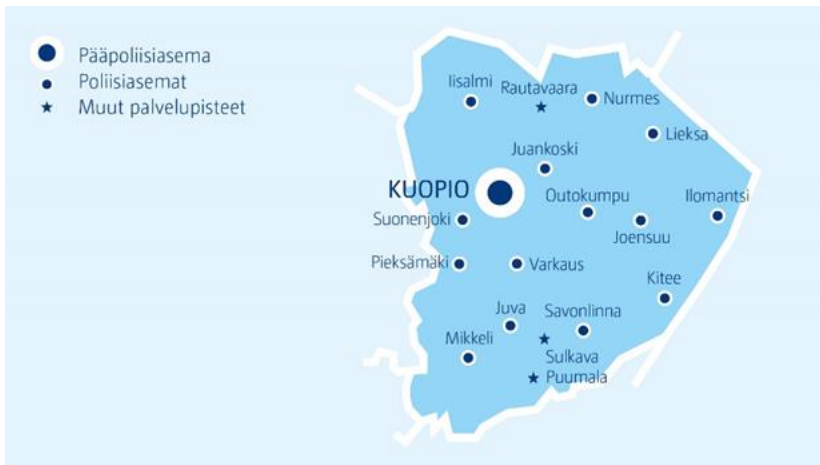
Kuva 6. Itä-Suomen poliisilaitos (Poliisin verkkosivut)

Kuopio sijaitsee Pohjois-Savossa Kallaveden rannalla. Kallavesi ulottuu Pohjois-Savossa Siilinjärven, Kuopion ja Leppävirran alueelle. Kallavesi on Suomen kymmenenneksi suurin järvi. Kallaveden pinta-ala on 478 neliökilometriä. Kallaveden keskisyvyys on noin 9,7 metriä sekä suurin mitattu syvyys 75 metriä. Näkösyvyys Kallavedellä vaihtelee puolestatoista metristä noin neljään metriin. (Järvi & Meriwiki 2021.)