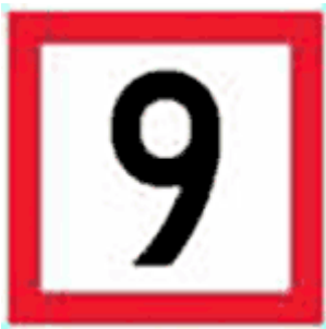
Kuva 7. Nopeusrajoitus (Finlex)

Haastateltava B kertoi, että molemmissa vesijeteissä niin Seadoossa kuin Yamahassa on navigaattori navigoinnin helpottamiseksi. Hän kertoi yrittäneensä hankkia myös hälytyslaitteita uudempaan vesijettiin, mutta niitä ei ole vielä saatu. Haastateltava kertoi, että hälytyslaitteista olisi hyötyä tilanteissa, joissa joudutaan poikkeamaan vallitsevista nopeusrajoituksista esimerkiksi Leppävirralla, joissa on 9 km/h nopeusrajoitus kuuden kilometrin matkalla (kuva 7).