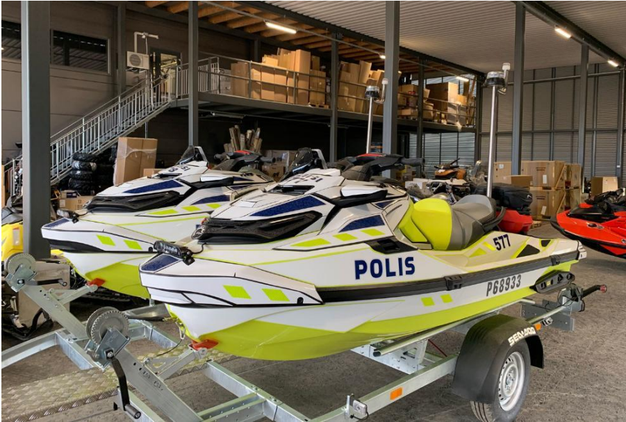
Kuva 4. Seadoo RXT300 trailerilla (Poliisin verkkosivut, ajoneuvot 2020)