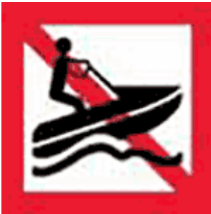
Kuva 2. Vesiskootterilla ajo kielletty

Vesiliikennelain 75 §:ssä tuodaan esille kieltomerkki (kuva 2), joka kieltää vesiskootterilla tai muulla vastaavan tyyppisellä vesikulkuneuvoksi laskettavalla kulkuneuvolla ajamisen. Kieltomerkin vaikutus-alue voidaan tarvittaessa tarkentaa apumerkillä.