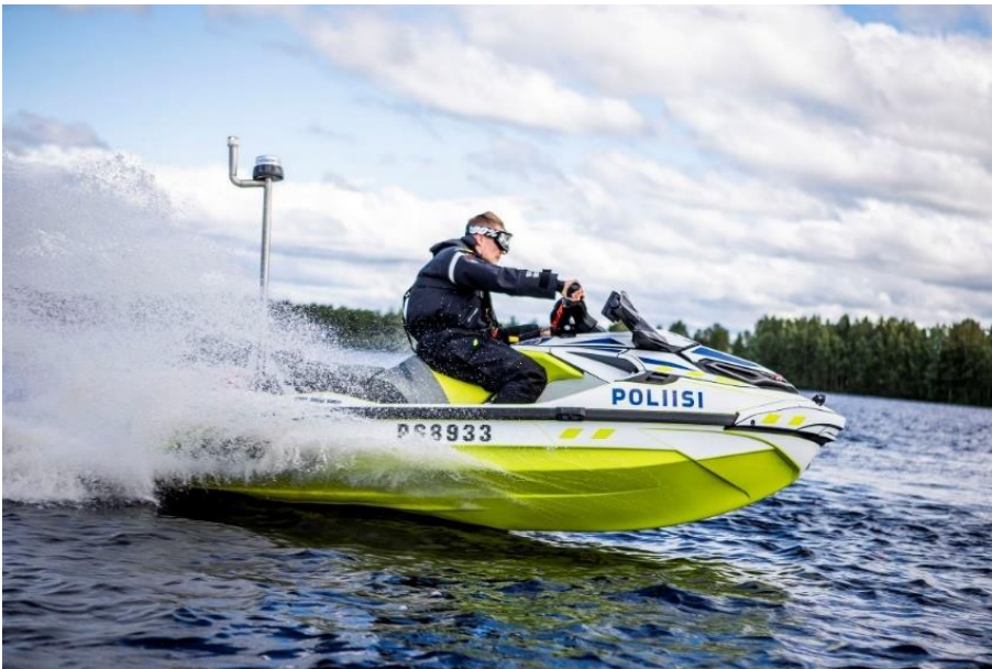
Kuva 5. Kuljettajan kuivapuku

Vesijetin kuljettaja ei ole säältä millään tavoin suojassa. Varsinkin kylmillä ilmoilla tai kun veden lämpötila on alhainen, käytetään vesijetillä ajettaessa muun muassa kuivapukua (kuva 5). Näin vesiroiskeet ja ajettaessa kuljettajaan kohdistuva ilmavirta ei kylmetä kuljettajaa. Lisäksi vesijetin kaatuessa, voi vesijetin kuljettaja kylmettyä helposti joutuessaan veden varaan, mikäli kuljettajalla ei ole kuivapukua.