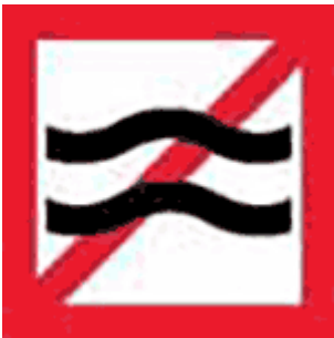
Kuva 3. Aallokon aiheuttamisen kieltö (Finlex)

Poliisi valvoo vesiliikennelaisissa määriteltyjen sääntöjen noudattamista myös esimerkiksi satamissa. Satama-alueella on usein aallokon aiheuttamisen kieltö (kuva 3) ja tätä ihmiset eivät aina noudata. Satama-alueella vesikulkuneuvon kuljettajan on pääasiassa edettävä siten, ettei aaltoja synny. Nopeus on kuitenkin sovittava sellaiseksi, että vesikulkuneuvon ohjattavuus säilyy. (Vesiliikennelaki 4:71:1.) Aallot keinuttavat laituriin olevia veneitä ja voivat aiheuttaa niihin vahinkoa. Lisäksi tarpeettomat aallot vaikeuttavat muiden veneiden laituriin saapumista sekä laiturista lähtemistä.