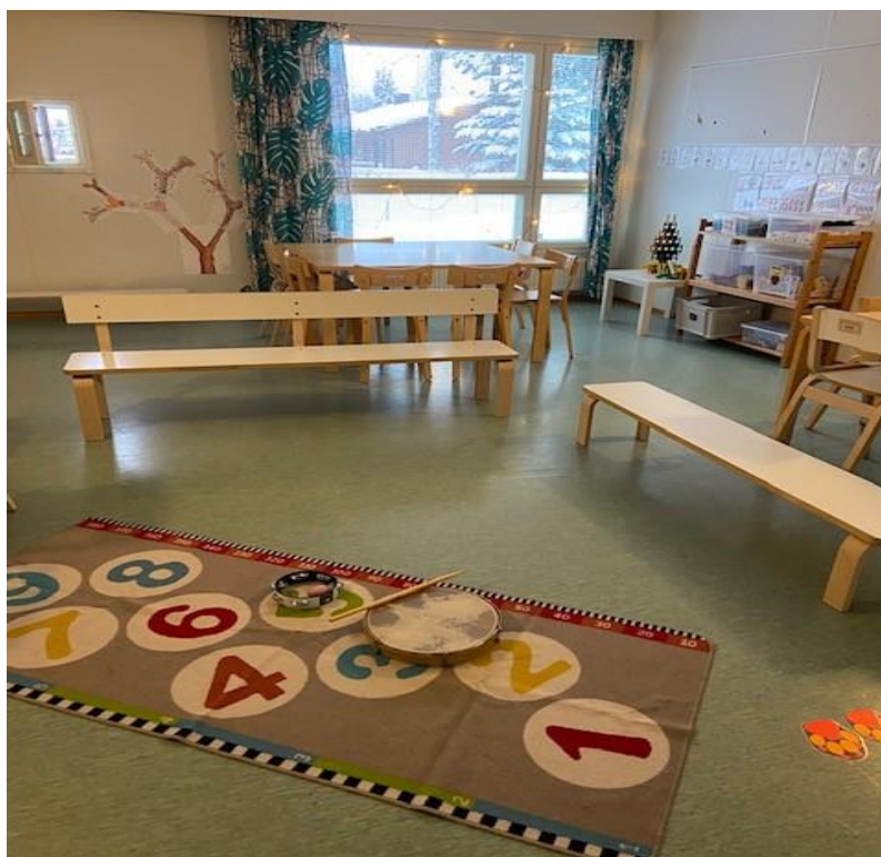
Kuva 4. Kolmannen tuokion penkkimuodostelma (Kinnunen, Anni 2022).

Aloitimme harjoitteet kysymällä lapsilta, mikä on heidän tämänhetkinen tunnetila ja sen jälkeen soitimme yhdessä miltä lasten mainitsemat tunteen kuulostavat. Jokainen sai siis soittaa juuri sillä tavalla, kun itse halusi. Painotimme koko tuokion ajan lapsille, että tässä tehtävässä ei ole oikeita ja vääriä vastauksia, vaan jokainen saa tulkita itse kokeamallaan tavalla. Seuraavaksi jatkoimme tunteiden soittamisella, mutta tällä kertaa me sanoimme jonkun tunteen, esimerkiksi ilo tai suru ja soitimme kaikki yhtä aikaa miltä tunne kuulostaa. Seuraavaksi pyysimme lapsia laittamaan soittimet hetkeksi sivuun ja näytimme heille Youtubesta valitun kiusaamista käsittelevän musiikkivideon “voisitko lopettaa”. Ohjeistimme ennen videota lapsia kuuntelemaan ja katsomaan tarkasti, sillä tulimme videon katsomisen jälkeen keskustelemaan, mitä lapsille jäi siitä mieleen. Keskustelun jälkeen soitimme Mieli ry:n Tunnelaulu –kappaleen, jonka aikana lapset saivat halutessaan tanssia ja näytellä laulun sanojen mukana.