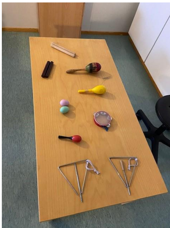
Kuva 3. Kolmannen tuokion soittimet (Kinnunen, Anni 2022).

Kolmannella ohjaukerralla aiheena oli tunnekasvatus musiikin avulla. Paikalla oli puolet ryhmästä kerrallaan. Molemmissa ryhmissä paikalla oli kuusi lasta. Tuokion kesto oli noin 45 minuuttia per ryhmä. Aloitimme tuokion esittäytymällä ja kerroimme lapsille mitä tällä tuokiolla on tarkoitus tehdä. Esittelimme lapsille mukanaamme olevan rummun, joka toimi äänimerkkinä siihen, että lasten tuli lopettaa toiminta ja pysähtyä kuuntelemaan meiltä tulevia ohjeita. Tämä oli meillä apuna siksi, ettei meidän tarvinnut huutamalla hiljentää lapsia ja soittimia. Tämän jälkeen ohjeistimme lapsia hakemaan vuorotellen pöydällä olevista soittimista, jotka olimme laittaneet valmiiksi ennen tuokiota, itselle mieluisan soittimen.