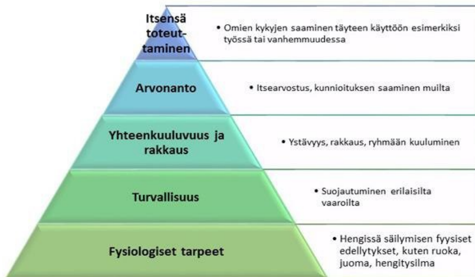
Kuvio 1: Maslow'n tarvehierarkia Annikki Peren (2016) mukaan.

Sininauhaliitto on jaotellut päiväkeskukset Maslow'n tarvehierarkian mukaan punaisiin, keltaisiin ja vihreisiin päiväkeskuksiin. Kun ihminen ei enää kykene täyttämään perustarpeitaan ilmenee se usein syrjäytymisenä. Punainen päiväkeskus, johon Toivontalokin lukeutuu, tarjoaa toimintoja, jotka täyttävät välttämättömät fyysiset tarpeet. Punaisissa päiväkeskuksissa on tarjolla muun muassa ruokaa, ruuan jakoa, peseytymismahdollisuus sekä akuutteihin asioihin liittyvää ohjausta ja neuvontaa. Punaisissa päiväkeskuksissa asiakkailla on usein akuutti päihde-, tai muu arkea rajoittava ongelma. Tässä vaiheessa keskitytään enemmän luottamussuhteen rakentamiseen kuin esimerkiksi ryhmätoimintoihin innostamiseen. Ajatuksen tarvehierarkiassa on, ettei ylemmät tarpeet tule tyydyttyiksi, ennen alempien toteutumista. Keltaiset päiväkeskukset keskittyvät puolestaan vahvemmin yksinäisyyden ehkäisyyn ja vihreät toimintaan aktivoimiseen. (Tepponen ym. 2015, 131–132.)