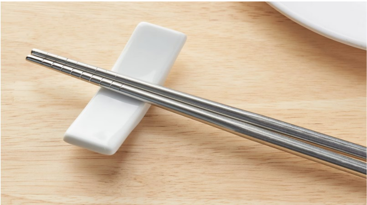
Kuva 3. Syömäpuikkoteline (Ikea 2022)

Etelä-Korealaisessa kulttuurissa on isossa osassa yhdessä syöminen. Siksi onkin tavallista lähteä yhdessä syömään tulevien liikeyhteisöjen kanssa. Yhdessä syöminen on myös hyvä tapa tutustua toisiinsa. Yhdessä syöminen on myös oiva tapa selvittää mahdollisen liikeyhteisön luotettavuutta. Siksi kannattaakin aina suostua, jos korealainen mahdollinen liikeyhteisö kutsuu sinut syömään. Etelä-Koreassa päivällinen on päivän isoin ateria ja se usein syödään kello seitsemän ja yhdeksän välillä. Etelä-Koreassa syödään usein puikoilla ja lusikalla. Siksi onkin hyvä muistaa, että puikkoja ei saa koskaan jättää kulhoon sojottamaan edes siksi aikaa, kun juo vettä. Sitä pidetään epäkunnioittavana. Syömäpuikot laitetaan aina niille tarkoitettulle telineelle lepäämään siksi aikaa. Alla esimerkki syömäpuikkotelineestä.