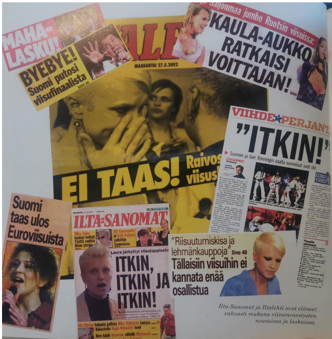
KUVA 1. Iltalehden ja Ilta-Sanomien euroviisu-utisointia 2000-luvulta (Muurinen 2007)

Myös Mari Pajalan (2006, 318) mukaan laulukilpailua käsitellään usein mediassa varsin tunteikkaasti. Yleisesti Suomessa keskustelussa on korostunut kansallinen häpeä sekä toistuva pettymys (Pajala 2006, 319). Media on osaltaan luonut vuosien varrella kilpailusta yleisölle tietynlaisen kuvan, jossa Suomi ei koskaan pärjää, koska suomen kieli, naapureiden suosiminen, epäonnistunut edustuskappaleen valinta tai suomalaisen populaarimusiikin omalaatuisuus estävät menestyksen. Suomalaisten nähdään odottavan aina menestystä, vaikka ennalta on selvää, ettei sitä tule. (Pajala 2006, 15.)