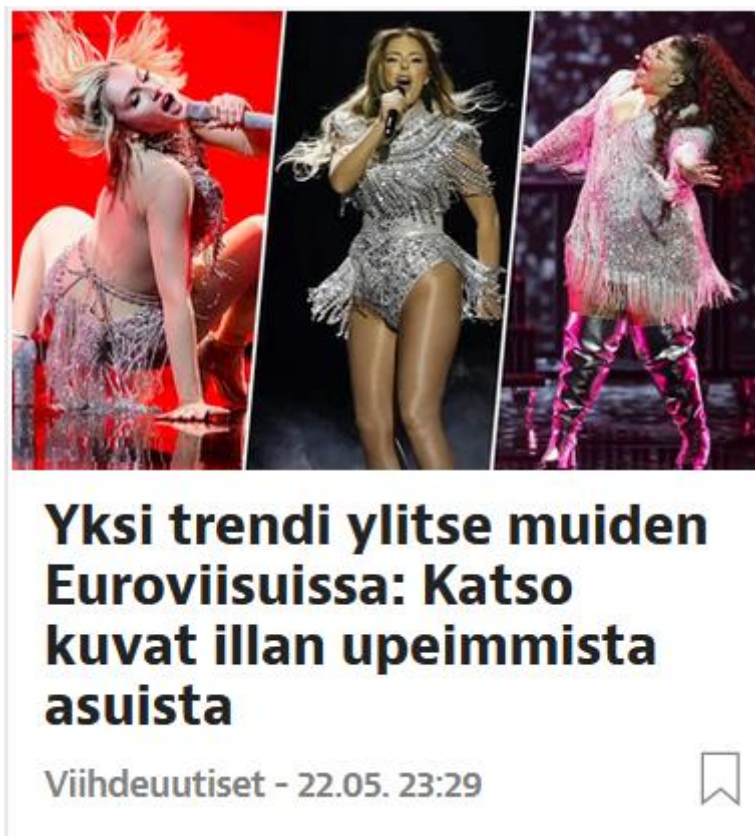
KUVA 3. Otsikko ja pääkuva Iltalehdessä (Mettänen & Pudas 2021)

Iltalehti uutisoi myös muodin merkityksestä Euroviisuissa. Muotiin liittyvän uutisoinnin aiheena ovat esimerkiksi kisojen juontajan Edsilia Rombleyn päällä ollut suomalaisen muotisuunnittelijan suunnittelema mekko sekä esiintyneiden artistien glitterimekot jutussa Yksi trendi ylitse muiden Euroviisuissa: Katso kuvat illan upeimmista asuista (kuva 3).