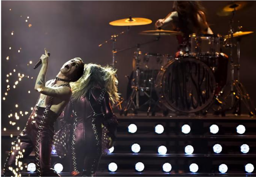
Italian Måneskin-yhtyeen solisti Damiano David (vas.) menee vapaaehtoiseen huumeetestiin Italiassa.

Spekulaatiot Italian solistin väitetystä huumeidenkäytöstä viisufinaalissa ovat yltyneet niin voimakkaiksi, että laulaja menee vapaaehtoiseen huumeetestiin palattuaan Italiaan. Viisufinaalista on levinnyt video, jossa laulaja näyttää nuuhkaisevan pöydältä jotain nenäänsä.