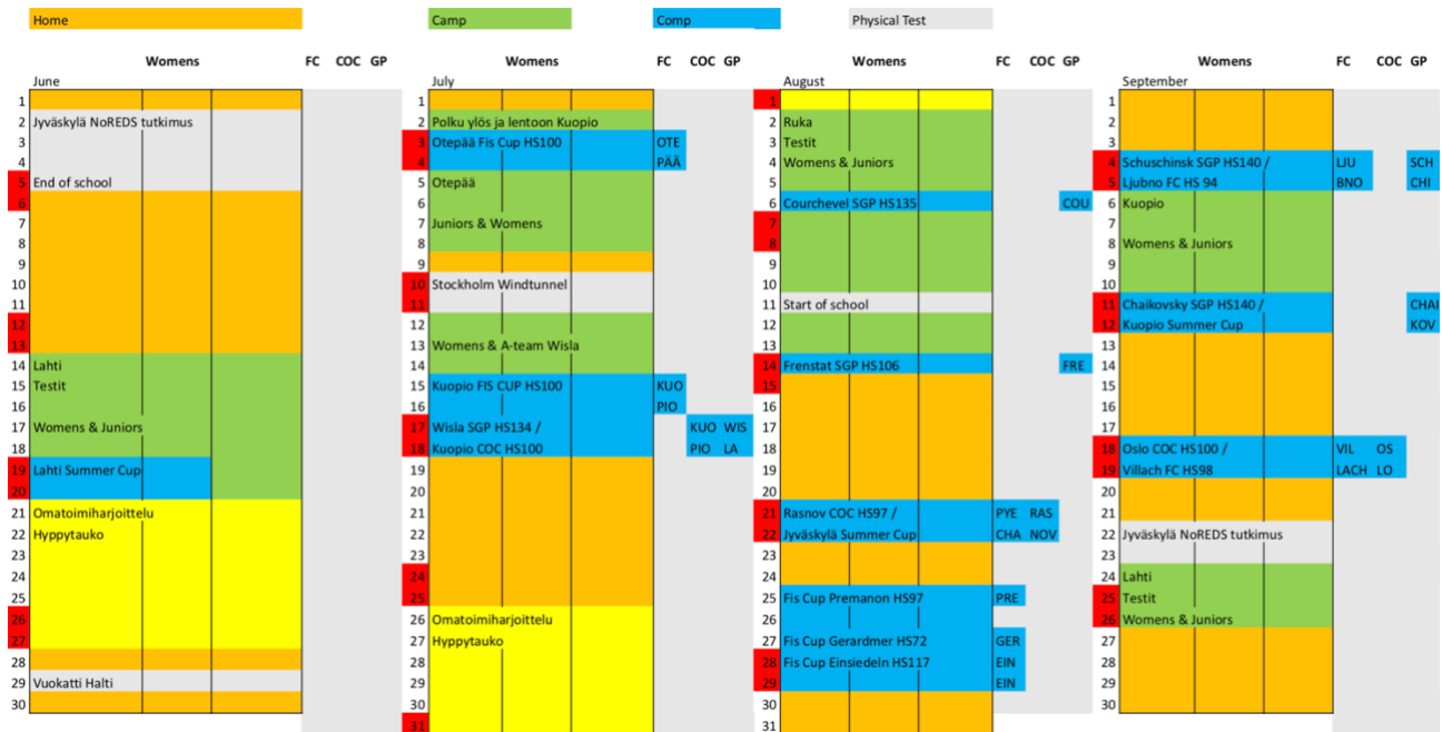
Kuva 4. Neljän kuukauden otanta naisten maajoukkueen kesän 2021 kausilakanasta.

niitä ei tarvinnut lähettää joukkueen jokaiselle jäsenelle erikseen, vaan kaikki näkivät päivitykset reaaliajassa. Jaetuilla tiedostoilla avoimuus ja tietoisuus toiminnasta kasvoivat.