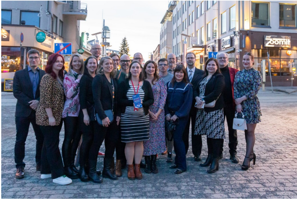
Kuva 1. Perustajajäsenet juhlistamassa Rovaniemen elävä kaupunkikeskusta ry:tä

Tarkasteltaessa kaupunkikeskustaa ja sen elinvoiman kehittämistä, vastuu tehtävästä jakautuu monelle eri toimijalle ja verkostoille. Näin ollen eri sidosryhmien osallistaminen ja osallistuminen koettiin tärkeäksi heti kehittämistyön alkumetreiltä. Kehittämishanke sai myönteisen rahoituspäätöksen kolme viikkoa koronapandemian sulun alettua, joten kehittämistyö käynnistettiin verkossa pidetyillä kehittämiskahveilla. Kuukausittaiset kehittämiskahvit ovat myös mahdollistaneet eri toimijoille kohtaamispaikan keskustan kehittämiseen liittyvien keskusteluiden äärelle. Vuoropuhelun mahdollistaminen niin kaupunkiorganisaation, yrittäjien ja asukkaiden välillä on koettu konkreettisenä tekijänä yhteistyön lisäämisessä.