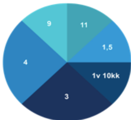
Kuva 4: Kuinka monta vuotta haastateltavat ovat olleet haastatteluhetkellä mukana KRIS Tampere ry:n toiminnassa.

Kuva 4 kuvastaa sitä, kuinka monta vuotta haastateltavat ovat olleet mukana KRIS Tampere ry:n toiminnassa ja havainnollistaa hajontaa haastateltavien välillä. Haastateltavista yksi oli ollut mukana toiminnassa jo 11 vuotta ja toinen vasta vajaa kaksi vuotta.