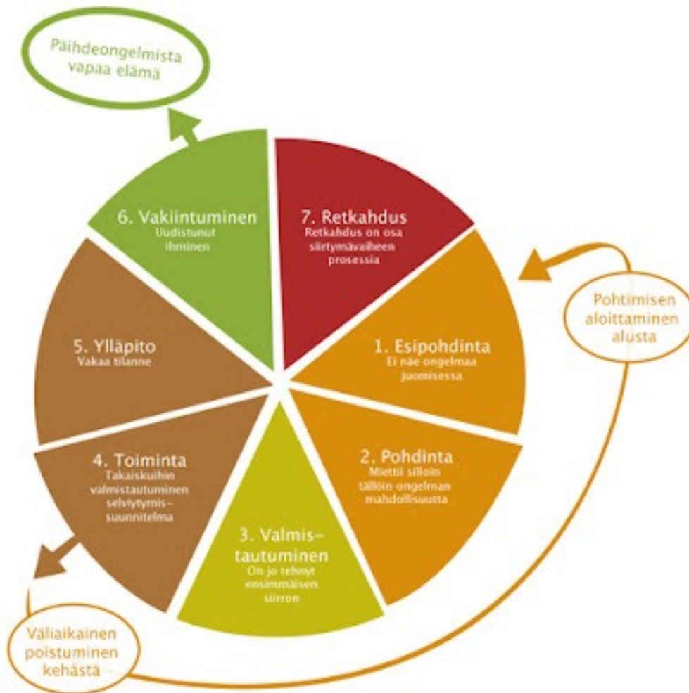
Kuva 1. Muutosprosessin vaihemalli. (Päihdelinkki)

kertaan samaan vaiheeseen, jumittua johonkin vaiheeseen tai vaihdella eri vaiheiden välillä. Muutos voi silti tapahtua, vaikka näitä takapakkeja tai jumittumisia tapahtuu. Tärkeää on eri muutosprosessin vaiheessa hyödyntää etenemiseen eri tekniikoita. Transteoreettinen muutosprosessin vaihemalli myös havainnollistaa myös sen, että muutos voi olla jo käynnissä ennen kuin se näkyy henkilön toiminnassa. (Kähkönen ym. 2008, 298–301.)