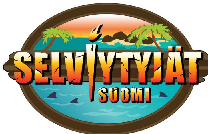
Kuva 4. Selviytyjät Suomi -tunnus.

Selviytyjät perustuu Strix-tuotantoyhtiön Robinson -formaatiin, mutta josta televisio tuottaja Mark Burnett on tehnyt huippusuositun tosi-tv-sarjan Survivors . Sarjassa roolitettuja jaetaan kahteen heimoon ja lähetetään selviytymään asumattomalle saarelle 39 päiväksi. Tavoitteena selviytyä ja kilpailla toisiaan vastaan ( Selviytyjät , Wikipedia 2014.)