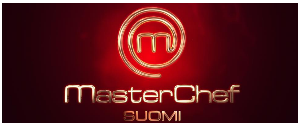
Kuva 3: MasterChef Suomi tumus (shinefinland)

MasterChef on ruoanlaittoon perustuva tv-ohjelma, jossa kilpailijat eivät ole kokkauksen ammattilaisia, mutta joille ruoanlaitto on intohimo. Ohjelmassa kilpailijoille annetaan ruoanlaittoon liittyviä haasteita ja tehtäviä, joissa heidän tulee loihkia herkullisia annoksia annettujen resurssien lomassa. Tuomareina toimii kolme ruoanlaiton ammattilaista, jotka ovat kriittisiä hyvän ruoan suhteen.