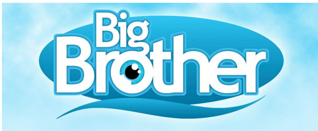
Kuva 1: Big Brotherin tunnus (wikipedia: Big Brother 2012 logo)

Big Brotherin omistaja yhtiö, hollantilainen Endemol, kuvailee Big Brotherin perusideaa verkkosivuillaan seuraavasti: