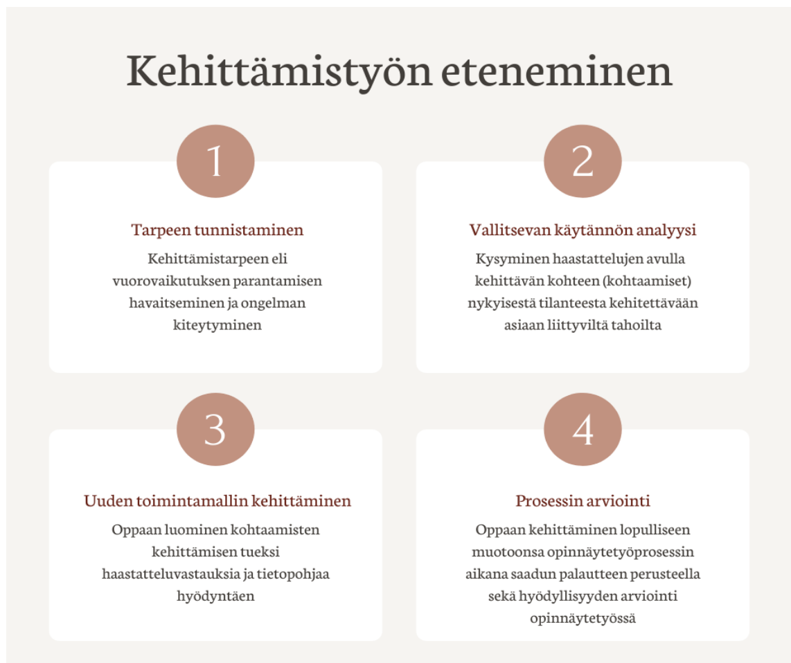
Kuvio 1: Kehittämistyön eteneminen

Tarve kehittämistyölle tuli ilmi työn tilaajan kanssa opinnäytetyön aiheen valinnasta keskustellessa. Asiaa kartoitettiin laajemmin päihteitä käyttäville henkilöille ja järjestyksenvalvojille suunnatuissa haastatteluissa. Haastatteluvastaukset auttoivat täsmentämään ongelmaa ja hahmottamaan kehittämistarvetta. Kehittämistyönä tehty opas muotoutui lopulliseen muotoonsa opinnäytetyön eri vaiheiden palautuksen yhteydessä, arvioivassa seminaarissa sekä tilaajalta saadun palautteen perusteella. (Salonen, Eloranta, Hautala & Kinos 2017, 47).