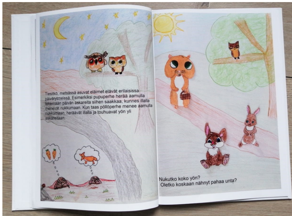
Kuva 1: Aukeama kirjasta

Tarinan kysymyksiin voi esittää jatkokysymyksiä, varsinkin jos vaikuttaa, että lapsi haluaa kertoa itsestään tai muuten vaan jutella.