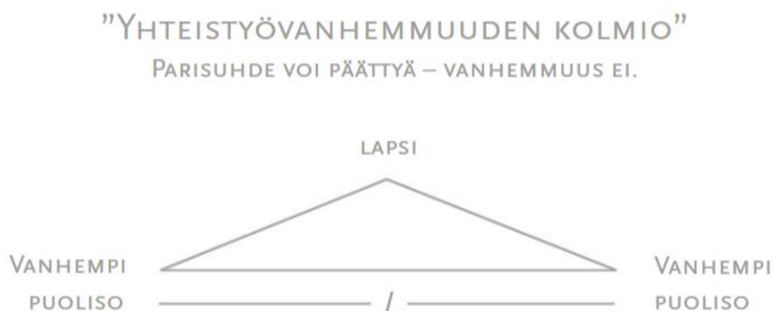
Kuva 2. Yhteistyövanhemmuuden kolmio (Vanhemman opas 2020, 26.)

Aina ero ei ole negatiivinen asia, vaan voi tuoda lapselle myös helpotuksen tunteen (Public Health Agency of Canada 2016, 28; Pruuki & Sinkkonen 2017, 8; Vanhemman opas 2020, 22). Konfliktit ja toisen vanhemman negatiivinen arvostelu heikentävät lapsen luottamusta kumpaankin vanhempaan. Vanhempien kyvyttömyys toimia yhteistyössä hoitaessaan lapsen asioita, voivat aiheuttaa lapselle turvattomuuden lisäksi syyllisyyttä ja häpeää. (Ensi- ja turvakotien liitto 2019.) Tällöin yhteistyövanhemmuus ei välttämättä ole lapsen etu. Mikäli eroriidat jatkuvat pitkään, rinnakkaisvanhemmuus ja yhteistyön vähentäminen voi olla välttämätöntä lapsen suojelemiseksi ristiriidoilta. Rinnakkaisvanhemmuudessa kumpikin vanhempi voi olla lapselle hyvä vanhempi tahollaan. Vanhemmuuden tukena toimivat sopimukset, joita tulee noudattaa tarkoin. Vanhemmilla on kuitenkin oikeus joustaa ja sopia keskenään muutoksista niin halutessaan. Rinnakkaisvanhemmuus voi myös vahvistaa lapsen resilienssiä. (Mikkola 2021, 121–122.) Varsinkin perheissä, joissa väkivalta tai sen uhka on ollut ilmeistä, erotilanne helpottaa lapsen stressiä (Pruuki & Sinkkonen 2017, 35).