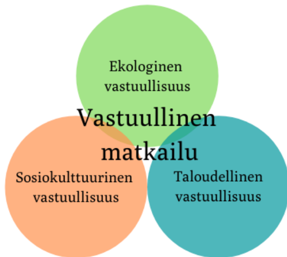
Kuvio 1. Vastuullinen matkailu

Vastuullinen matkailu ja kestävä matkailu eivät ole sama asia. Kestävä matkailu tarkoittaa koko matkailualan yhteistä tavoitetta kehittää matkailua niin, että se täyttää nykyajan ihmisten tarpeet vaarantamatta tulevien sukupolvien tarpeita ja mahdollisuuksia. Vastuullinen matkailu painottuu siihen, mitä yksilöt, yhteisöt ja yritykset voivat tehdä minimoidakseen matkailun negatiivisia vaikutuksia. Näitä tekoja ovat esimerkiksi paikallisten palveluiden tukeminen, kulttuurien ja tapojen kunnioittaminen, jätteiden minimointi, luonnonsuojelu, paikallisten työllistäminen ja alkuperäiskansojen kulttuurin korostaminen matkailuliiketoiminnassa. (Angelina 2020.)