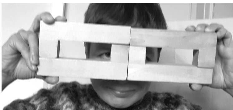
Kuva 5: Silmälasit. Uimalasit. Kekkonen.