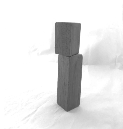
Kuva 2: Palikkatorni. Ihminen. Puu.

Tässä artikkelissa kirjoitan hieman myöhemmin mimesiksestä suhteessa taiteen kokijan aktiivisuuteen ja nykyteatteriin, mutta jo platonilaisuus tuo esille neutraalien puupalikoiden, abstraktin muodon mahdollisuuden monikerroksiseen jäljittelyyn. Puupalikan kohdalla voimme ajatella vastaavasti 1. ideaa puupalikan olemuksesta, 2. konkreettista muotoon veistettyä puupalikkaa, 3. piirrosta puupalikasta ja lisätä ajatteluamme neljännen kategorian, kun kokija tulkitsee mielikuvituksessaan muotoon veistetyn puupalikan jäljittelevän jotain itselleen tuttua: 4. kokijan tulkinnan heijastava puupalikka (kuva 1, kuva 2). Mimesiksen tukemana palikoilla leikkijä tai palikkateatterin kokija astuu taiteilijan rooliin ja ”veistää” palikan aineettomasti,