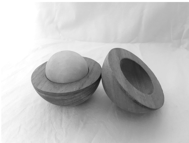
Kuva 3: Pallo. Kananmuna. Avokado. “Valkuainen kääpiö”.

Palikkateatteria-esityksessä kuvassa (kuva 3) näkyvää palikkakokonaisuutta heitellään ensin kokonaisena pallona, kunnes se avautuu, ja alkaa kuulua kanojen kotkotusta. Yleisöstä kuuluu usein “kananmuna!” ja joskus “avokado!”. Vaikuttaa siltä, että vegaanisen ruokavalion lisääntyessä joillekin lapsille avokado saattaa olla kananmunaa tutumpi asia. Tämä palikkapallo on esityksen lopussa tulkittu ihmisen pääksi, jonka sisällä on “aivot” tai “mieli”. Sama palikkakokonaisuus on saanut myös kuolevan tähden roolin, kun kerran eräs nuori esitti työpajassa tähden paisuvan jättiläiseksi ja kutistuvan sitten “valkuaiseksi kääpiöksi”, valkoiseksi kääpiöksi. (Halme & Susi 2020, 24.) Palikkateatterissa on mahdollisuus kokea aristoteelisen mimesiksen nautintoa. Kokemukset, joita palikkateatterityön tekeminen vuorovaikutuksessa yleisön ja osallistujien kanssa on synnyttänyt, todistavat miten nautinnollisena ja oivaltamisen elämyksiä jakavana tapahtumana palikkateatteriesityksen tai -työpajan voi katsoja tai osallistuja kokea.