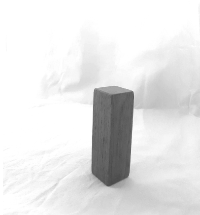
Kuva 1: Palikka. Ihminen. Pilvenpiirtäjä.

Platonin jaottelua soveltaen voidaan jäsentää seuraavasti: Idea puupalikasta on puupalikan tosi olemus itsessään, muuttumattomassa ideoiden maailmassa. Veistetty puupalikka on reaaliolio eli aineellinen puupalikka muuttuvaisessa aisti-ilmioiden maailmassa. Siinä samassa muuttuvaisessa maailmassa kankaalle maalattu kuva puupalikasta on näennäinen puupalikka. Puupalikoilla yhteistä on ”palikkaisuus”, tarkemmin sanottuna ”puupalikkaisuus”, eli ne ovat veistettyjä puisia kappaleita, jotka sisältävät mahdollisuuden rakennettavuuteen tai päällepinnoamiseen. Erityisten puupalikoiden ja puupalikkaisuuden lisäksi on olemassa tosi puupalikka, puupalikan idea. Sellainen reaaliolio, joka on osallinen puupalikan ideasta, omaa puupalikkaisuuden ominaisuuden ja näin ollen on puupalikka. (Ks. Kuisma 1991, 28.)