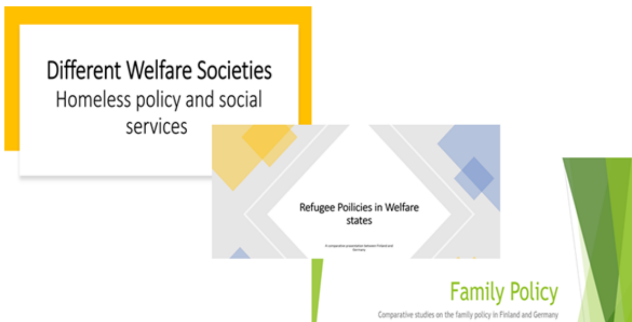
KUVA 2. Samanaikaisesti opiskelua kotona ja maailmalla. Opiskelijoiden ryhmätyön tuotoksia ja aiheita.

Opiskelijat osoittivat oppineisuutensa tekemällä ryhmätyön (kuva 2). Ryhmistä tehtiin tarkoituksellisesti kansainvälisiä, eli niissä oli jäseniä molemmista korkeakouluista. Ryhmätyöskentelyä edesauttoi ryhmäläisten käytännön tieto erilaisten hyvinvointiyhteiskuntien (keskieurooppalaista järjestelmää edustavan Saksan ja pohjoismaita edustavan Suomen) sosiaalipolitiikasta, sosiaalialasta ja palvelujärjestelmistä. Opiskelijat perehtyivät valitsemaansa sosiaalialan teemaan (esimerkiksi maahanmuuttotyöhön) ja vertailivat tältä osin Suomen ja Saksan sosiaalipolitiikkaa, järjestelmää ja palveluita. Opiskelijat olivat keskenään yhteydessä sähköpostitse, Whatsappilla, Zoomilla ja Teamsillä.