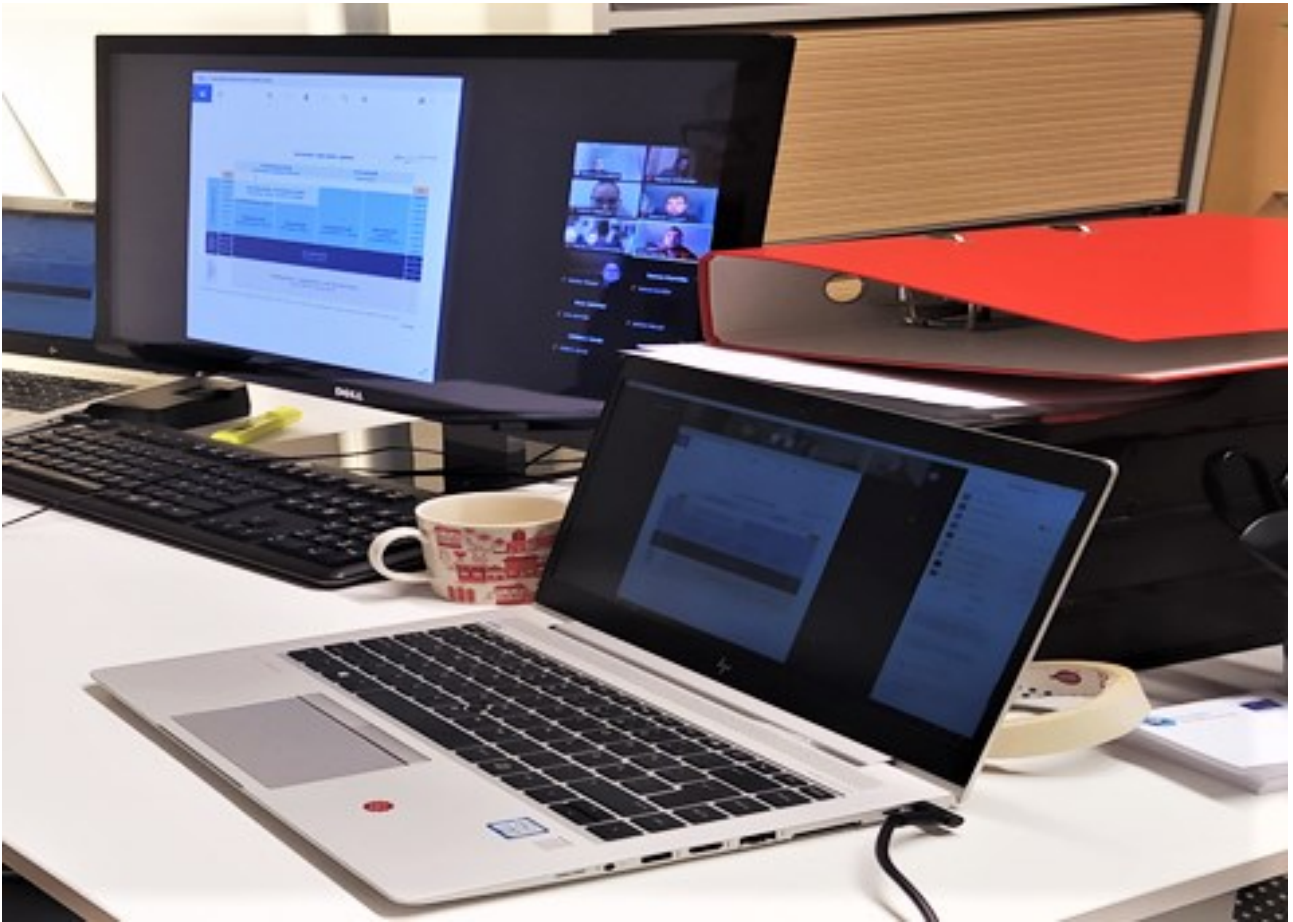
KUVA 1. Kansainvälinen opintojakso verkkototeutuksena.