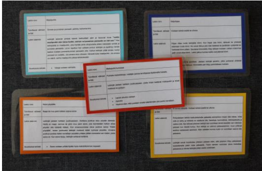
Kuvio 2. Leikkikortin ohje

2) ja toiselle puolelle on liimattu leikkiin virittävä kuva (ks. kuvio 3), joka toimii lapsille myös muistivihjeenä. Kuvat leikkikortteihin on otettu ilmaisista kuvapankeista. Kuvia olemme ottaneet papunetin kuvapankista ja free images -sivustolta. Lisäksi olemme käyttäneet wordin omaa kuvapankkia. (Kuvapankki2014; Freeimages n.d.; ClipArt n.d..) Leikkikortit on laminoitu, jotta ne kestäisivät sekä ulko- että sisäkäyttöä.