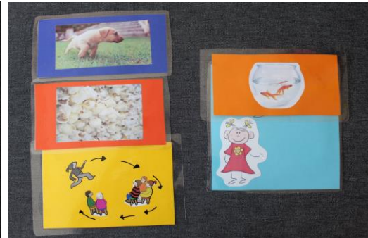
Kuvio 3. Leikkikortin kuva

Kun kansio otetaan käyttöön uudessa ympäristössä ja ensimmäistä kertaa kyseisen ryhmän kanssa, on aikuisen hyvä tehdä valinta leikeistä yhteisiä leikkihetkiä varten. Kun leikit ovat tulleet lapsille tutuiksi, myös he voivat osallistua niiden valintaan. Kortin kuva auttaa lapsia muistelemaan ja valitsemaan leikkejä. Leikkikorteista voi muodostaa sisällöltään ja pituudeltaan vaihtelevia kokonaisuuksia tai kansioista voi ottaa yhden tiettyyn hetkeen sopivan leikin. Kansio on suunniteltu kasvattajalle apuvälineeksi yhteisen toiminnan ideoimiseen.