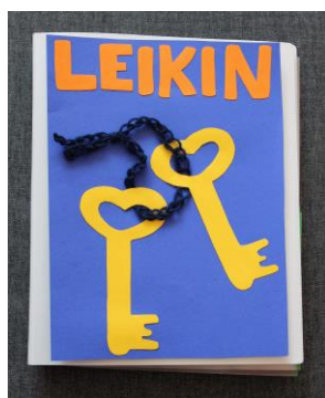
Kuvio 1. Leikin avaimet –leikkikansio

Kaikki kansion (ks. kuvio 1) leikit on valittu sillä periaatteella, että niissä korostuu yhteistoiminta. Leikkihetken tarkoitus on varmistaa, että kaikki lapset tulevat huomioiduksi ja saavat myönteisiä kokemuksia ryhmän muista lapsista. Myönteiset kokemukset helpottavat lasten omaehtoisen leikin aloittamista vieraampien lasten kanssa. Lasten yhteinen toiminta näyttää onnistuvan sitä paremmin, mitä enemmän lapsilla on kokemuksia toistensa kanssa toimimisesta (Koivula 2013: 39).