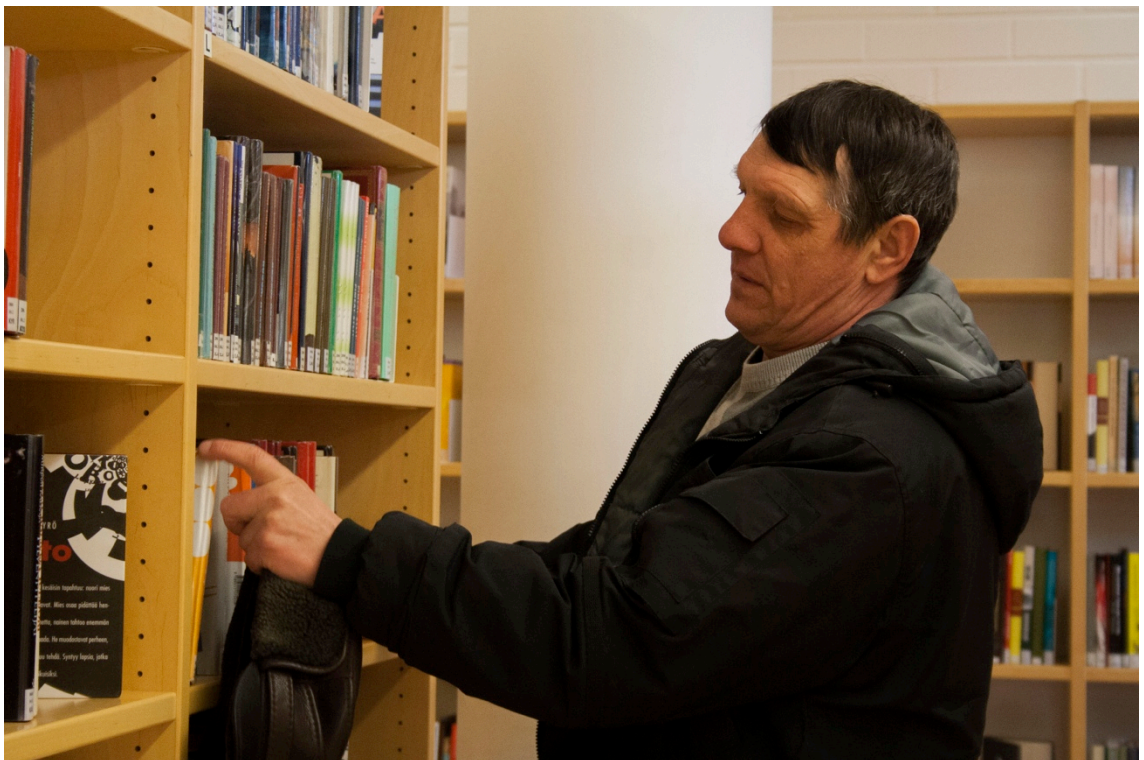
Kuva 8. Onneksi miehiäkin tuli osallistumaan