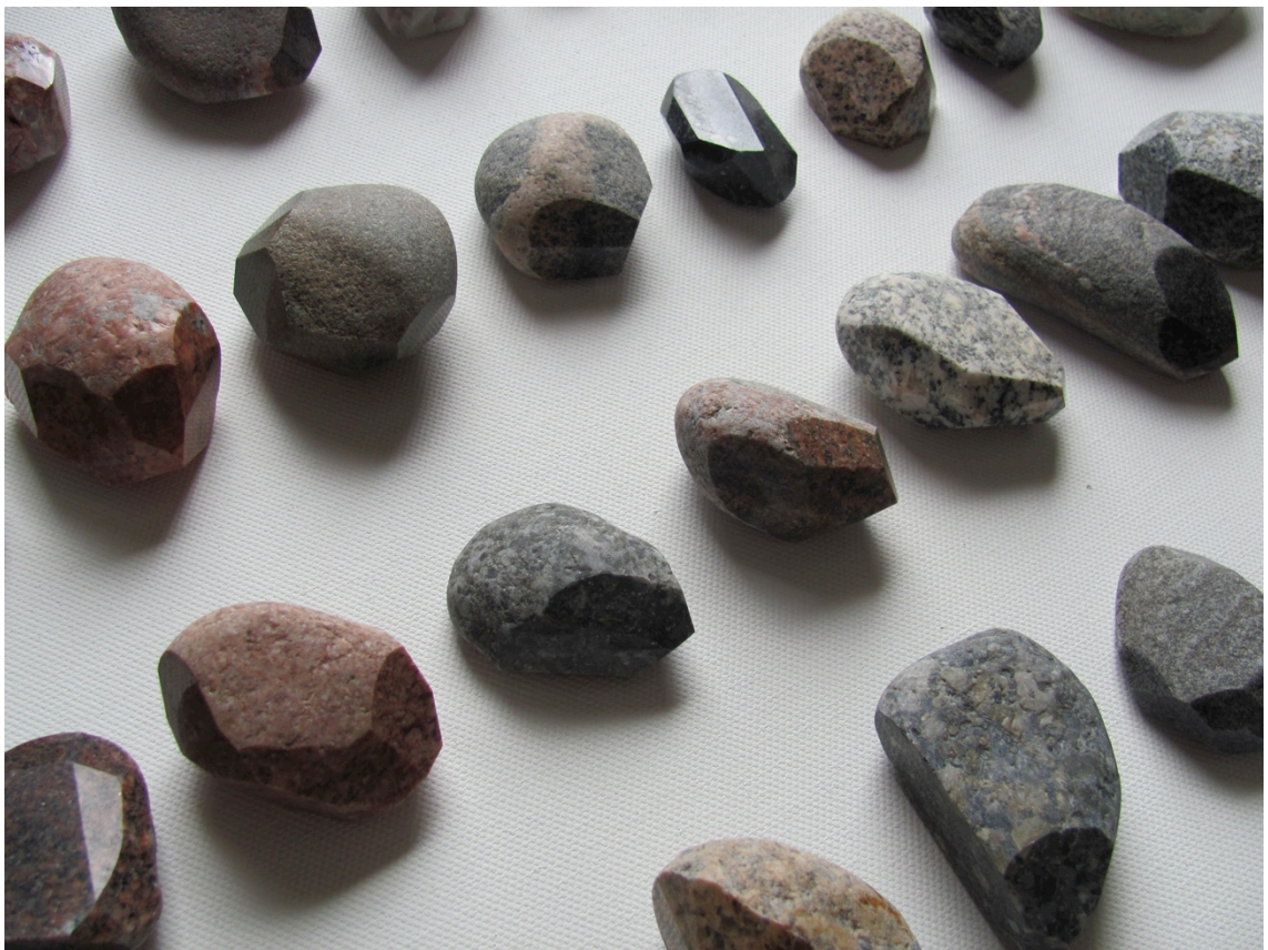
Kuva 2. Kiviaarteita

Alkuvaiheessa halusin piilottaa aarteet (Kuva 2) ja aitoustodistukset sellaisenaan – veistos todistuksen päällä. Siinä oli kuitenkin riskinä, että joiltakin olisi saattanut jäädä huomaamatta ottaa aitoustodistus mukaansa. Ne täytyi siis saada jollakin tavalla yhteen. Sitominen narulla olisi ollut yksi vaihtoehto, mutta halusin, että aarteiden löytäjä saa halutessaan heti ottaa sen käteensä. Päädyin käyttämään pieniä, kirkkaita sellofaanipusseja ja pakata aarteet todistuksineen niihin. Pussit olivat mielestäni tarpeeksi vähäeleisiä ja tyylikkäitä tähän tarkoitukseen. Näin pakattuna osallistujat myös helpommin huomaisivat aarteet piilopaikoissaan.