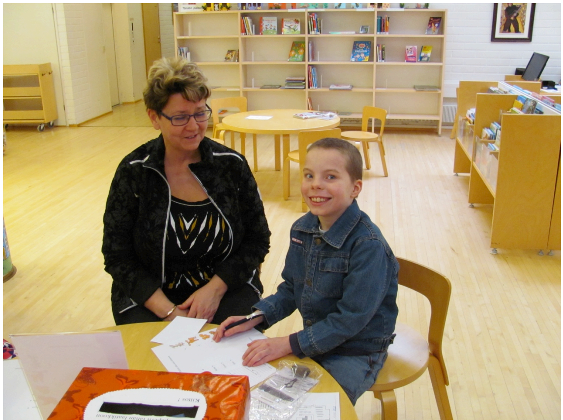
Kuva 4. Innokas etsijä vastaamassa kysymyksiin

Olin pyytänyt apua tapahtuman valokuvaamiseen. Ymmärsin, että sekasotku olisi valmis, jos yrittäisin itse vielä ottaa hyviä kuviakin. Tämä olisi ollut osallistujienkin kannalta hämmentävää ja vaikuttanut epäammattimaiselta. Näin minulle jäi myös aikaa keskustella osallistujien kanssa. Valokuvaajani Johanna Berg on neljännen vuosikurssin valokuvauksen opiskelija ja sai tapahtuman dokumentoimisesta työharjoittelupisteitä. Hän otti hienoja tilanne- ja yleiskuvia koko tapahtuman ajan. Hän myös selvitti osallistujilta, saisiko heitä kuvata. Vain yksi venäläinen nainen ei halunnut näkyä kuvissa. Seuraavaksi on kuvia tapahtumasta (Kuva 4, Kuva 5, Kuva 6, Kuva 7, Kuva 8, Kuva 9, Kuva 10).