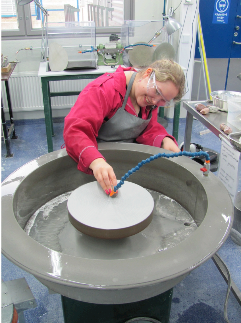
Kuva 1. Kiviaarteiden työstämistä

Opinnäytetyöni ohjaajan kanssa olin keskustellut numeroinnin merkityksestä pienoisveistosten ainutlaatuisuuden korostamisessa. Päädyin tekemään jokaiselle aarteelle aitoustodistuksen. Ks. Liite 2. Todistus on tehty samalla tyyllillä kuin tapahtuman juliste käyttäen pohjalla kuvaa kivien etsimisestä rannalla. Myös tekstin fontti ja ladonta ovat samanlaiset. Todistukset painatin koulun digipainossa postikorttिलाatuiselle ja -kokoiselle paperille. A6-koko tuntui minusta sopivalta rinnastettuna aarteiden kokoon. Todistus on näin myös helppoa säilyttää vaikka valokuva-albumissa.