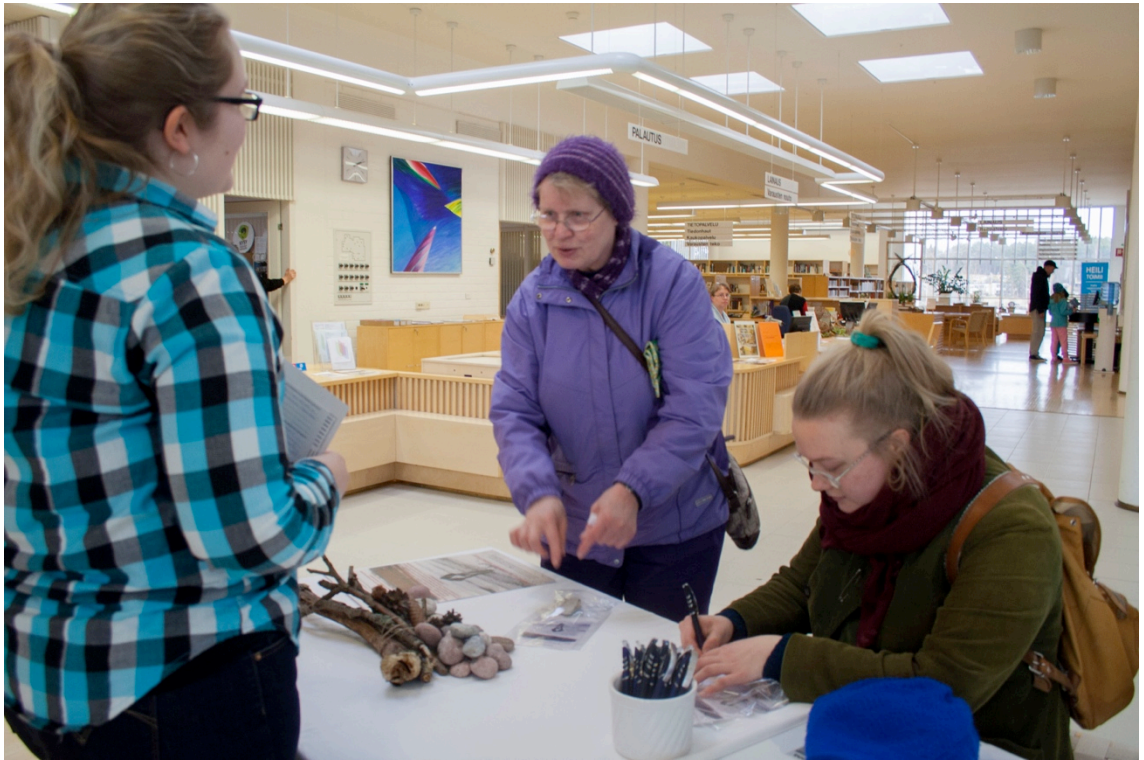
Kuva 7. Keskusteluja osallistujien kanssa