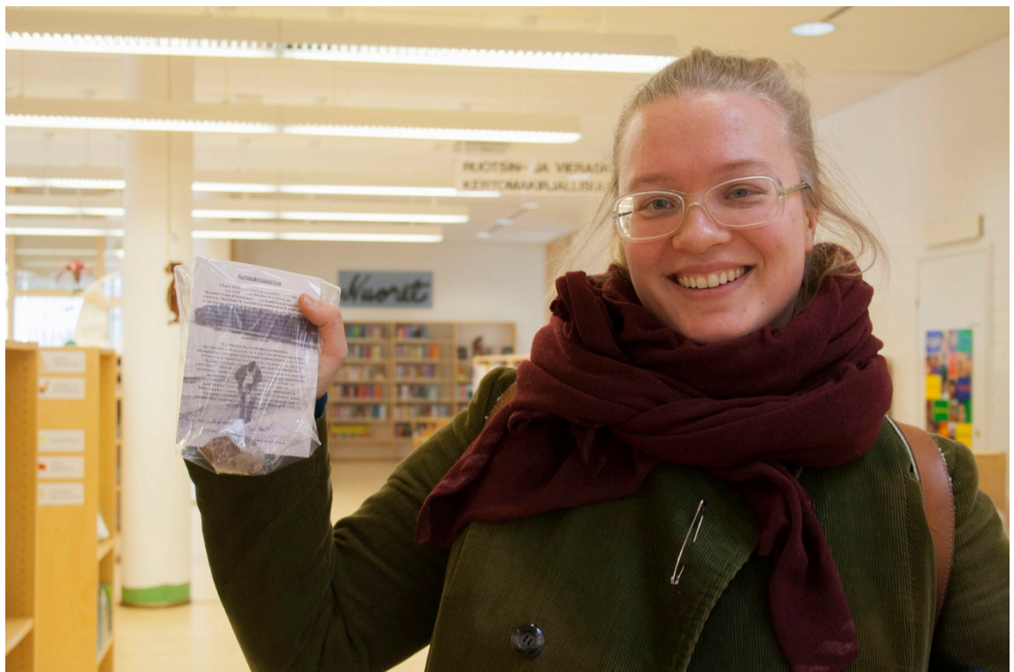
Kuva 10. Löytäminen hymyilyttää

Kaikki aarrekartat oli jaettu parissa tunnissa, ja pian kello kahden jälkeen tapahtuma oli ohi. Olin varautunut olemaan kirjastolla sen sulkeutumiseen saakka, mutta yllättäen alkuperäinen suunnitelmani muutaman tunnin