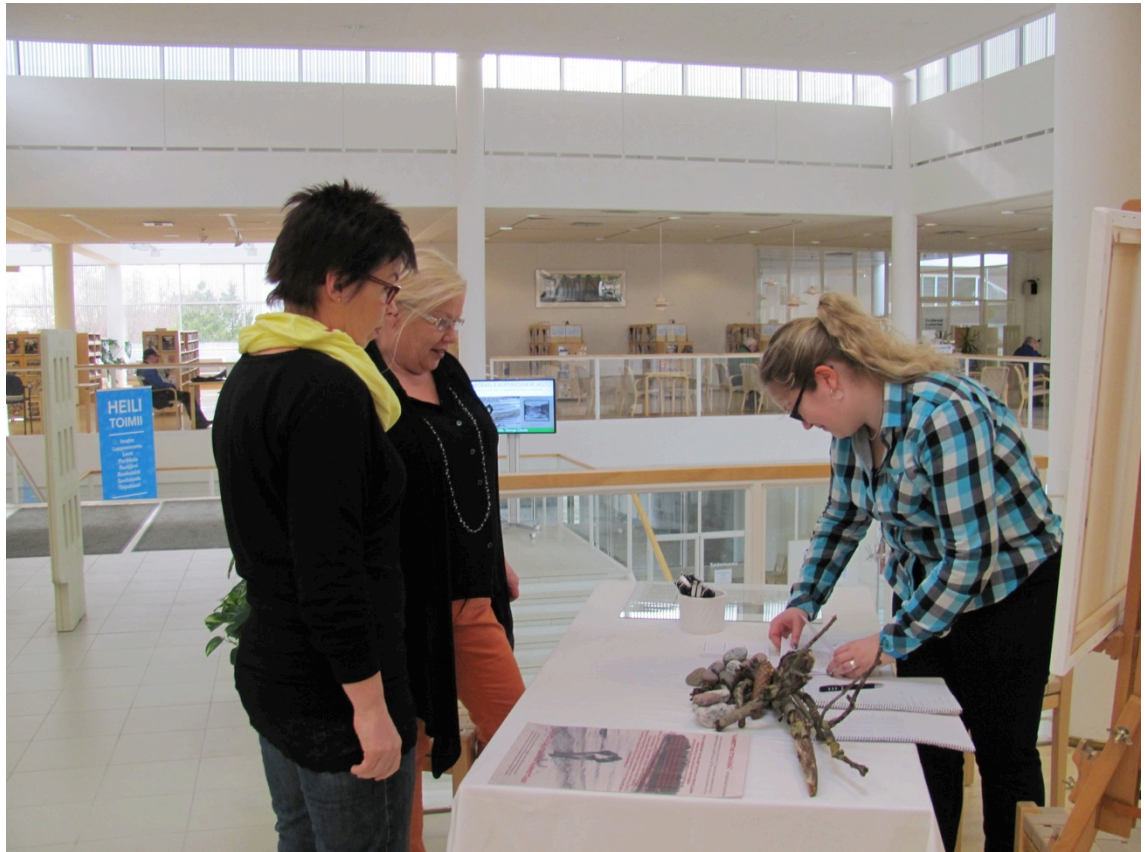
Kuva 3. Tapahtumapaikka ja aarteenetsintäkeskus

Kaikki oli valmista, kun tapahtuman oli aika alkaa kello kaksitoista. Innokkaiden osallistujien ryntäys alkoi heti. Tapahtumasta tiedottaminen minun ja kirjaston väen puolesta oli tuottanut tulosta. Olin ennakkoon pelännytkin, että aarteet saattavat loppua kesken, mutta näin suureen suosioon en ollut osannut varautua.