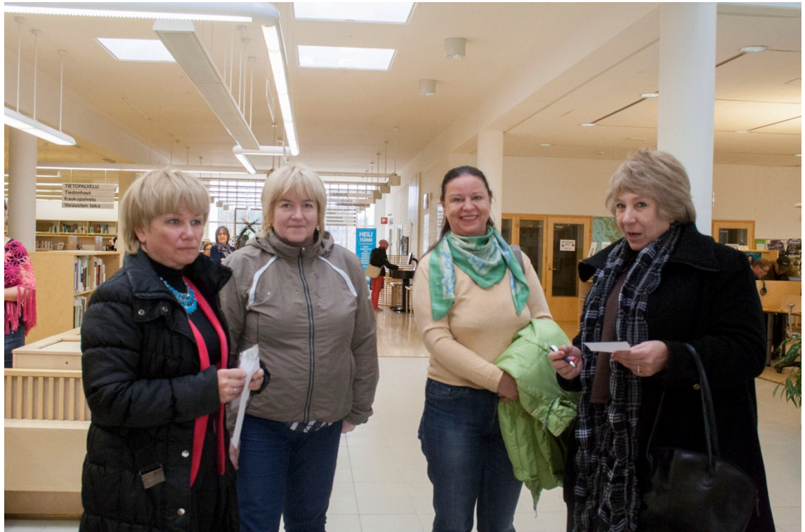
Kuva 9. Venäläisiä suomen kielen opiskelijoita