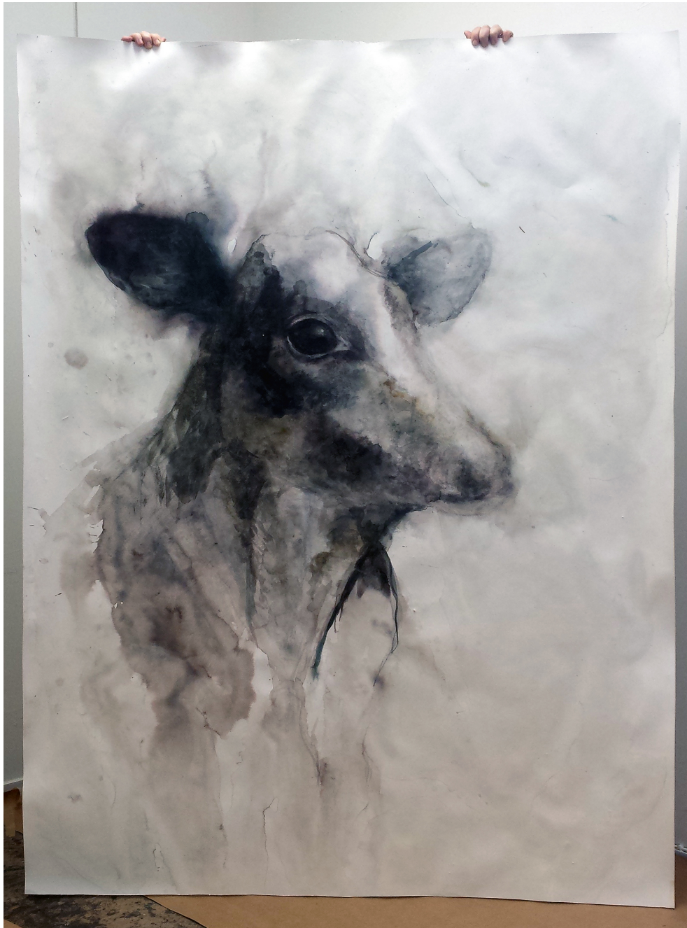
Kuva 5.5.2. Työvaihekuva