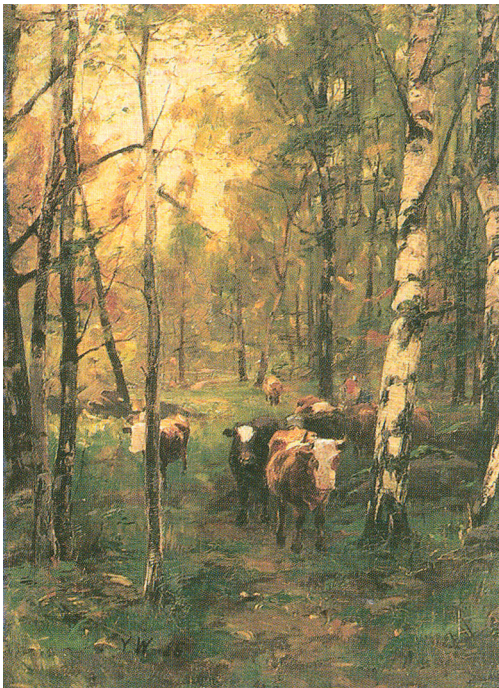
Kuva 4.1 Victor Westerholmin Lehmiä koivumetsässä (1886)

Erik (Eero) Nikolai Järnefeltin (1863 – 1937) Lehmisavu on ehkä Suomen tunnetuimpia nautamaalauksia. Sen tunnelma on vangitseva ja koruton, mutta siitä uhkuu se totuus, että naudat ovat olleet suomalaisenkin historian kulmakiviä. Siinä ihminen ja nauta ovat riippuvaisia toisistaan, ja valo korostaa naudat lähestulkoon jumalaisiin mittakaavoihin. Sama ilmiö toistuu Victor Westerholmin Lehmiä koivumetsässä (1886) (Kuva 4.1.).