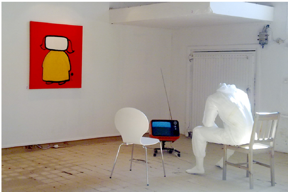
Kuva 5.1. Noise -installaatio, Koskiston taidekeskus 2012

Teoskokonaisuuden luomiseen vaikuttavat henkilökohtaiset lähtökohdat. Olen käsitellyt samaa aihealuetta myös aikaisemmissa installaatioissani Noise -installaatio (Kuva 5.1.), Koskiston taidekeskus 2012, sekä University of West Georgiassa tehdyssä työssäni "Fuck me and leave" – Planet Earth 2013 (Kuva 5.2.) Olen myös tehnyt teossarjan "Childhood" (Kuva 5.3.), joka käsitteli oikeutta onnelliseen lapsuuteen, jota ei pitäisi tarvita jälkikäteen värittää.