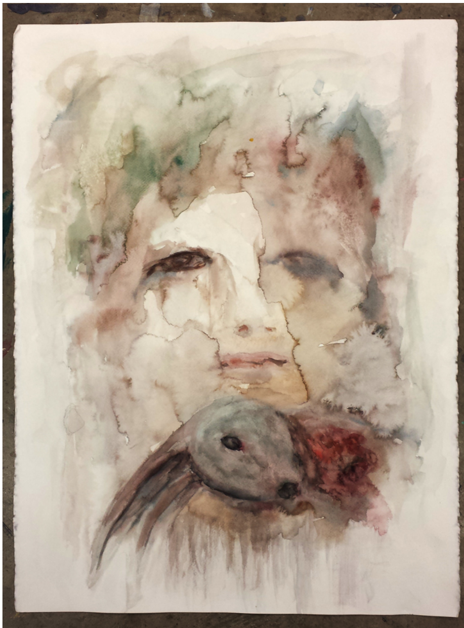
Kuva 5.1.2. Ihminen ja jänis, 2013

Ensimmäisissä maalauksissani ihmiskasvot (Kuvat 5.1.1., 5.1.2.) katsovat katsojaa kohti kenties kysyen, onko teko oikea. Toiset katsojat ovat kokeneet kyseisen kahden teoksen kokonaisuuden mykistäviksi, toiset surulliseksi ja osa taas mieltää niiden merkitykseksi ihmisen oikeuden hallita luontoa, eivätkä siten ole kokeneet akvarellejäni ahdistaviksi. Painopiste maalauksissa on kuitenkin eläin. Ihmiskasvot ovat vain muutamalla vedolla maalatut, koska en halunnut katsojan keskittyvän niihin vaan ainoastaan eläimiin.