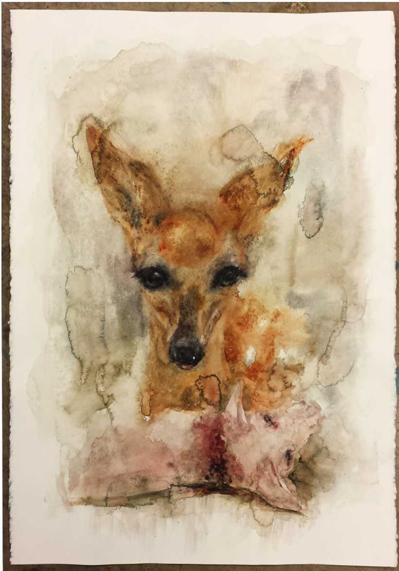
Kuva 5.3.1. Peura ja porsas, 2013

Muun muassa eläinten oikeuksia puolustava järjestö Peta (People for the Ethical Treatment of Animals) on nostanut esille sikojen inhimillisiä piirteitä. Internetistä löytyy kuvia ja videoita mm. eläinten turvakodeista, joissa turvaan otetuille tuotantoeläimille annetaan mahdollisuus elää koko elämä, vailla pelkoa lautaselle joutumisesta. Siellä siat saavat möyriä mutakuopissa ja laskea liukumäkiä sydämensä kyllyydestä.