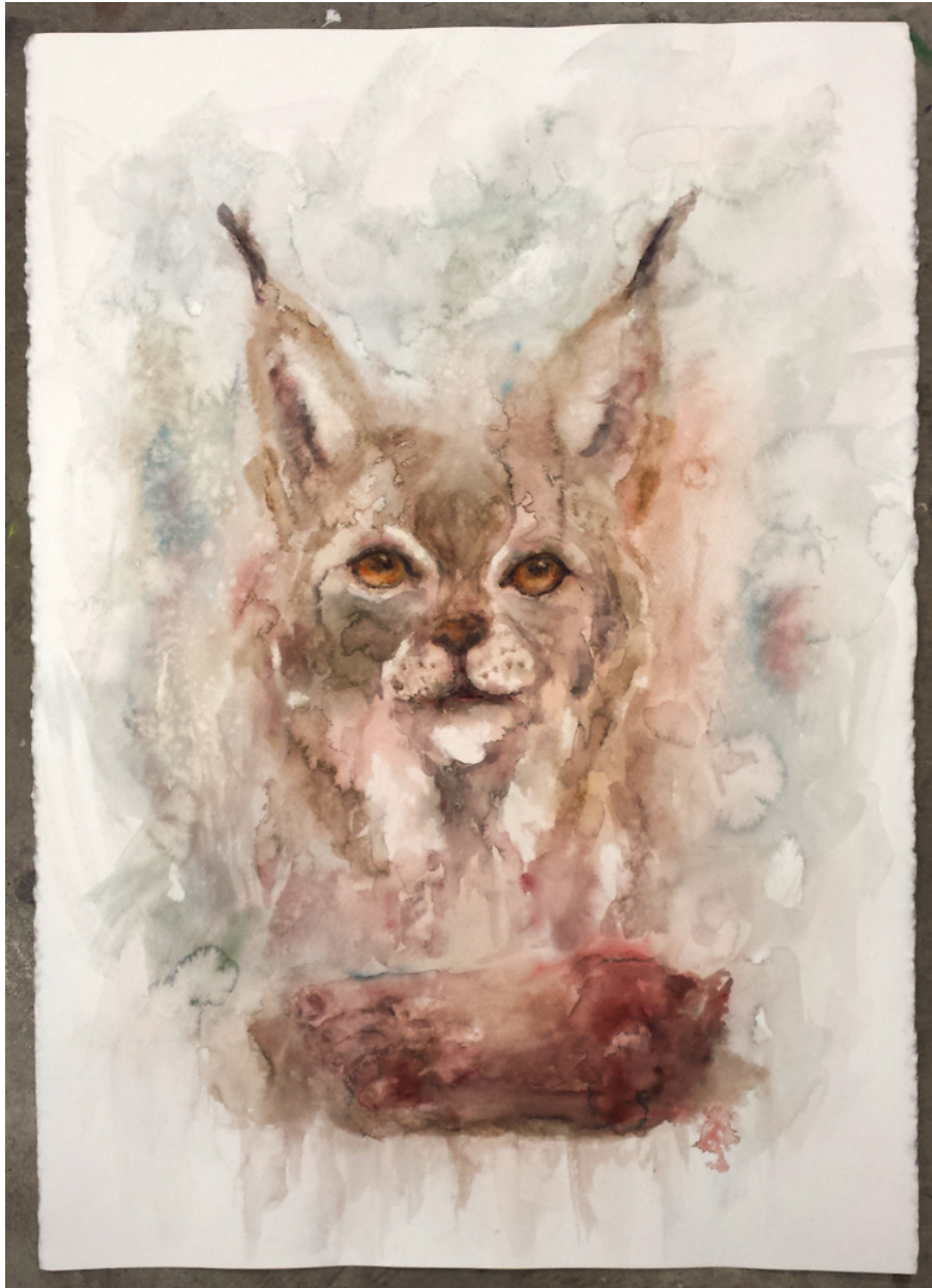
Kuva 5.2.2. Ilves ja jalka

Mitä ihminen tekisikään tuollaisessa tilanteessa? Luultavasti tarttuisi aseeseen ja ampuisi ilveksen, koska sehän voisi hyökätä uudestaan ihmisen kimppuun. Tässä kärjistyy juuri ihmisen halu hallita luontoa ja reviiriään. Vaikka ihminen levittäytyy villieläinten reviirille, ihminen kokee olevansa ylempiarvoinen voiden häätää ja eliminoida eläimet alueeltaan.