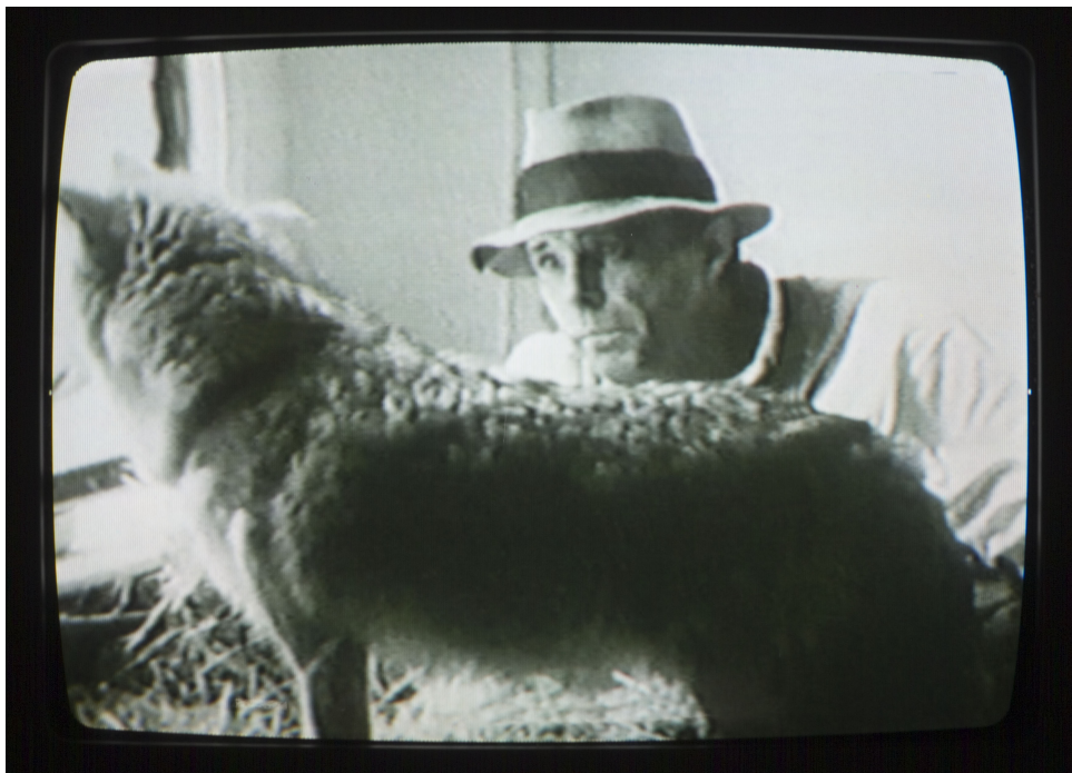
Kuva 4.2 Josep Beuys Coyote 1974

Beuysin performanssi alkoi jo lentokentältä hänen saavuttuaan Yhdysvaltoihin. Hänet kuljetettiin ambulanssilla suoraan galleriaan. Hän jakoi huoneen villin kojootin kanssa kolmen päivän aikana yhteensä kahdeksan tuntia (Kuva 4.2.). Välillä hän seisoi harmaa viltti yllään ja paimenen sauva kädessään, toisinaan hän makasi paikoillaan katsellen kojoottia silmiin.