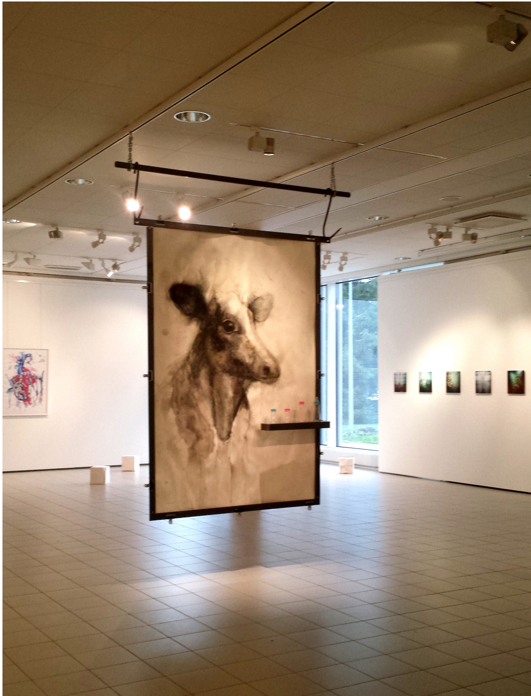
5.5.3 Kyse ei ole vain eläimestä tai ihmisestä, Imatran taidemuseo 2014