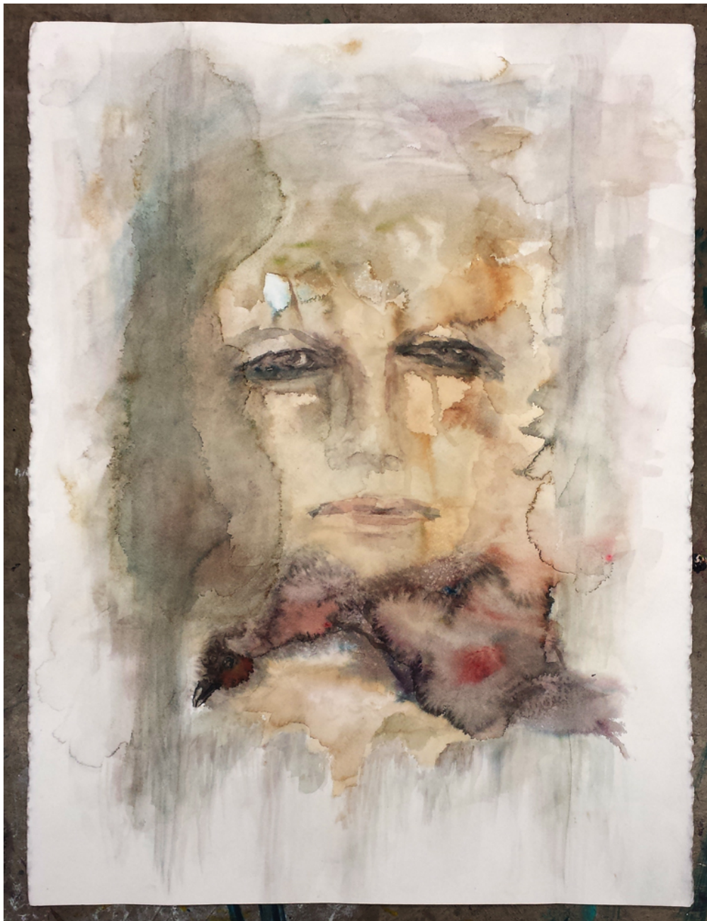
Kuva 5.1.1. Ihminen ja Fasaani 2013