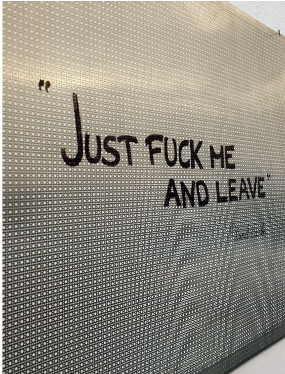
(Kuva 5.2 "Fuck me and leave" – Planet Earth 2013