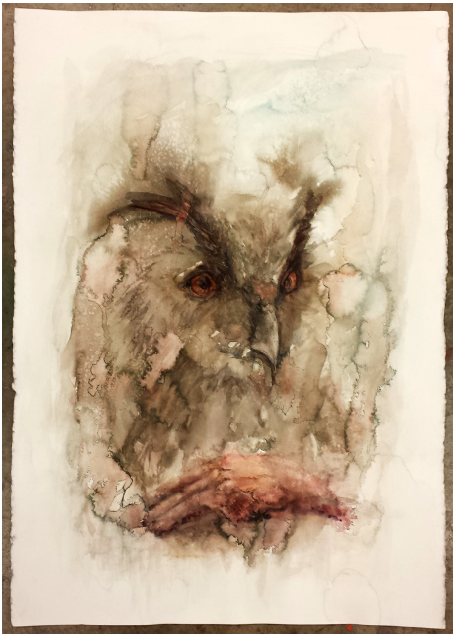
Kuva 5.2.1. Huuhkaja ja käsi

Kääntämällä näkökulmaa aiheideni pohjalta luonnon ja ihmisen väliseen suhteeseen, sain aikaan keskustelua siitä, missä menee raja ja mitä toimenpiteitä se aiheuttaakaan, jos esimerkiksi ilves hyökkäisi ihmisen kimppuun.