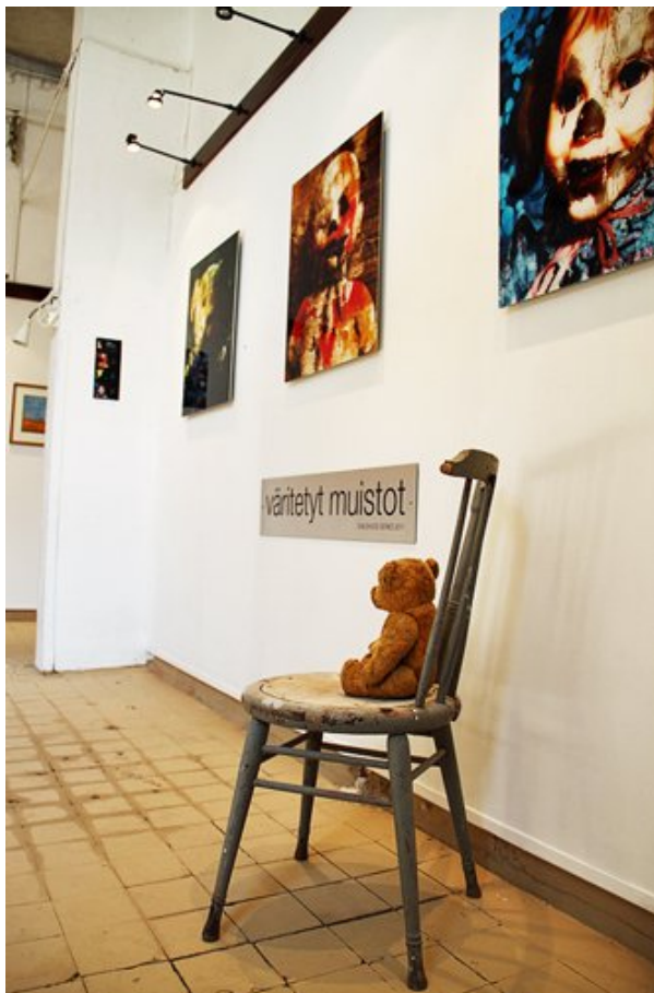
Kuva 5.3 "Childhood" installaatio 2011