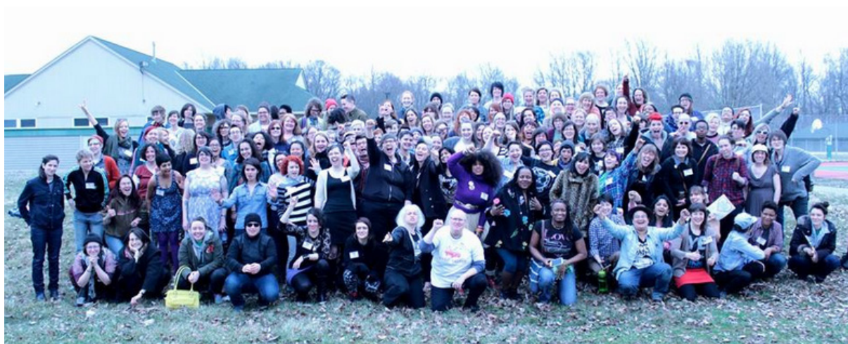
Gruppen på alla konferensdeltagare på GRCA-konferensen i New Jersey i mars 2014.

Den 20-23 mars 2014 deltog fyra representanter från Rock Donnas arbetsteam i den årliga GRCA-konferensen i USA som ordnades på Apple farms Arts and Music centre i Elmer, New Jersey. 180 personer representerade sammanlagt 59 olika lokala Girls Rock-läger från USA och Europa. Under konferensen delade de representerade lägren erfarenheter och utböt idéer sinsemellan och det uppstod flera idéer att jobba vidare på. Rock Donna är inte ännu medlem i GRCA, men kommer att ansöka om medlemskap i maj 2014.