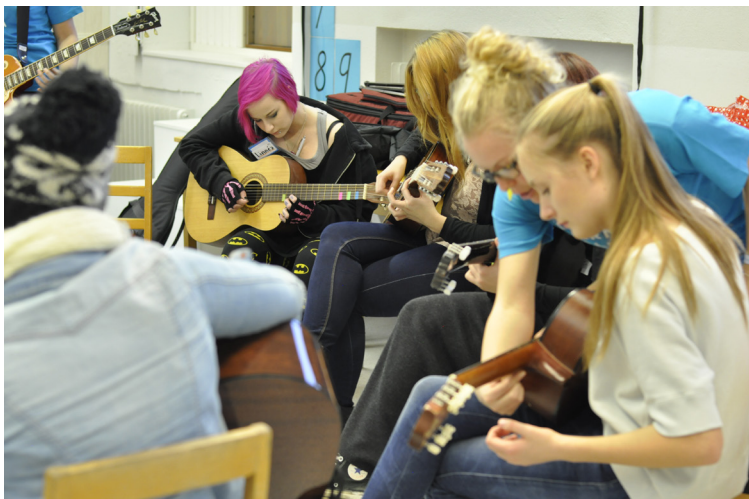
Rock Donna höll ett labb på Kulturkarnevalen i Lovisa i november 2014. Labbet avslutades med att labbdeltagarna uppträdde med sina nyskrivna låtar inför en publik på 500 personer.