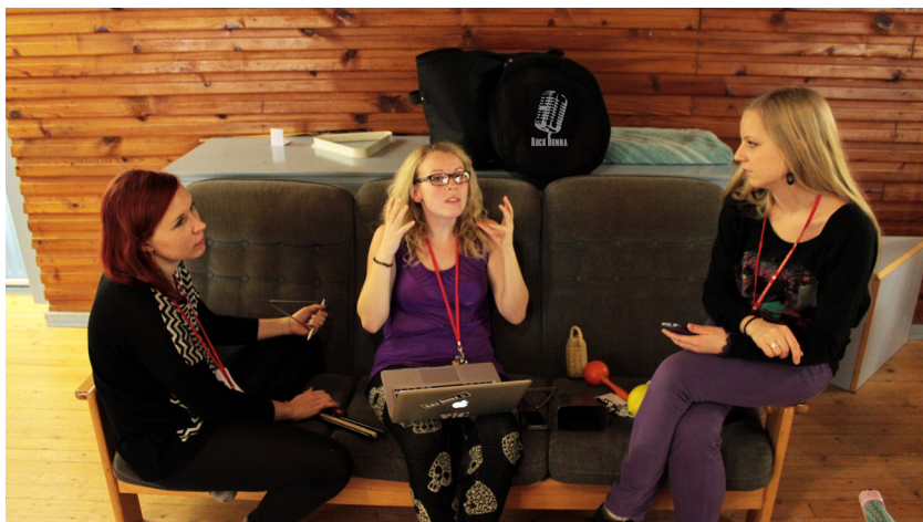
Till bandledarnas förarbete innan lägret hörde att planera det musikaliska lägerinnehållet det vill säga musikundervisningen.

Under lägret: Under lägret ansvarar bandledarna för all musikundervisning som inte hålls av en gästande workshopsledare.