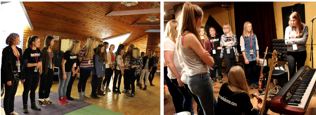
Gruppövningar och studioteknik på Rock Donnas pilotläger 2014.

Under de fyra lägerdagarna fick deltagarna spela olika instrument delta i olika gruppundervisningar och musikrelaterade workshoppar. Dessutom fick deltagarna spela i band och skriva låtar tillsammans samt uppträda på konsert. Utöver musikundervisningen ordnades det även fritidsprogram på kvällarna. Lägerprogrammet var preliminärt fastspikat inför hela lägret, men för att under lägret kunna anpassa programmet enligt gruppens behov bestämdes programmet för varje enskild dag kvällen före och presenterades för deltagare vid varje morgonsamling.