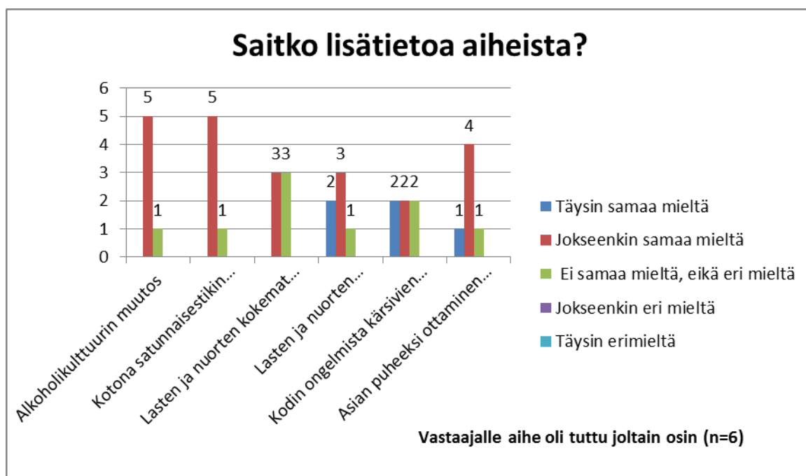
Kuvio 2. Saitko lisätietoa aihealueista? Vastaajalle aihe oli tuttu