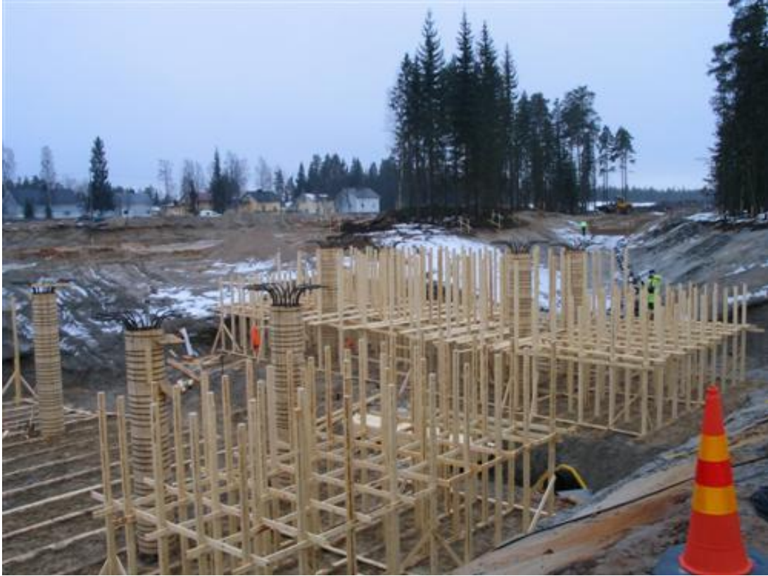
KUVA 3. Siltatelineen pystytys (8)