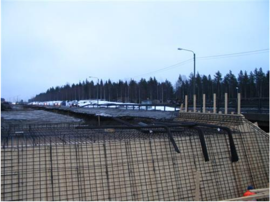
KUVA 5. Kannen raudoitusta (8 ja 9)