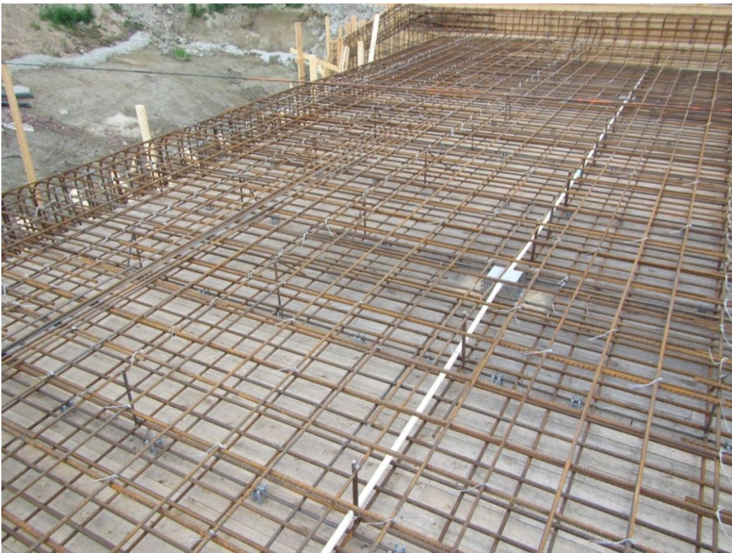
KUVA 4. Kannen raudoitusta (9)