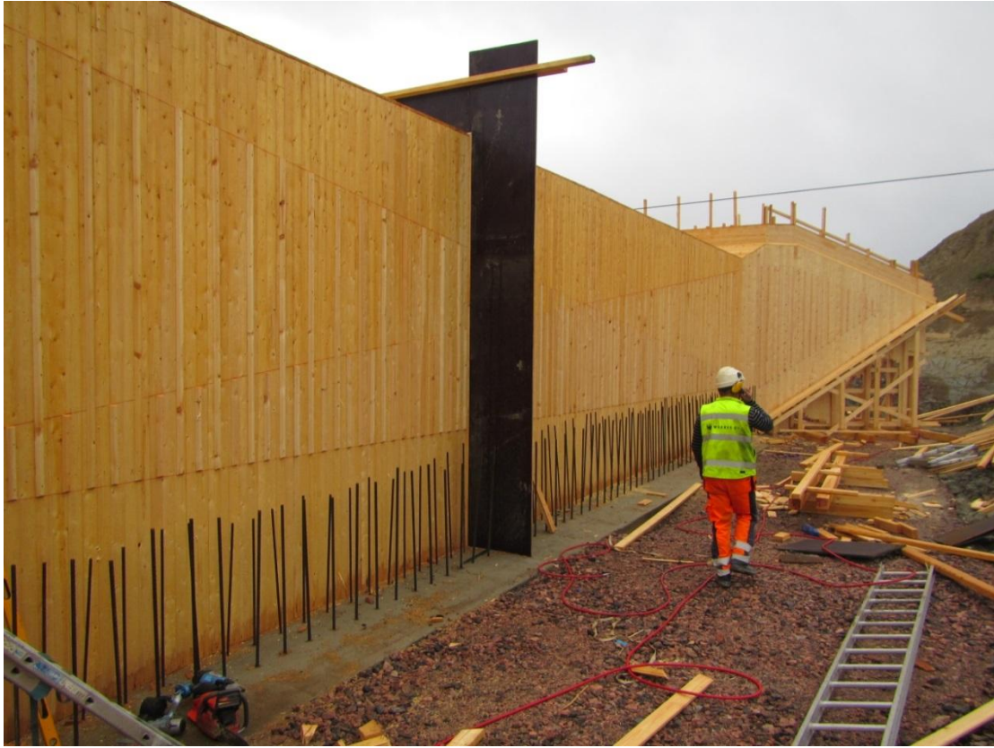
KUVA 7. Muottityöt