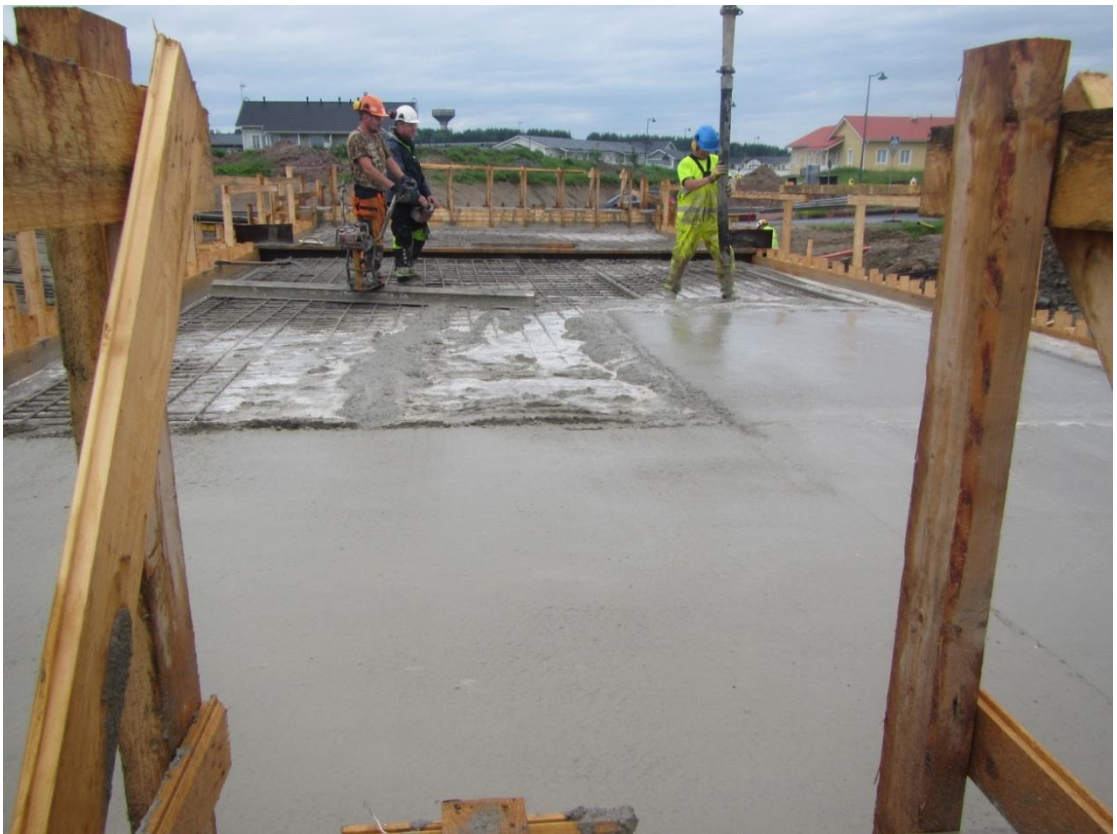
KUVA 6. Kannen betonointi (9)