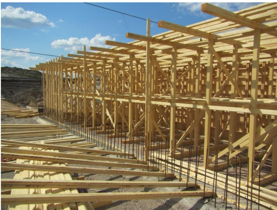
KUVA 2. Siltatelineen pystytys (9)

Tässä luvussa esitellään Marrak Oy:n toiminnan osa-alueita kuvien avulla.